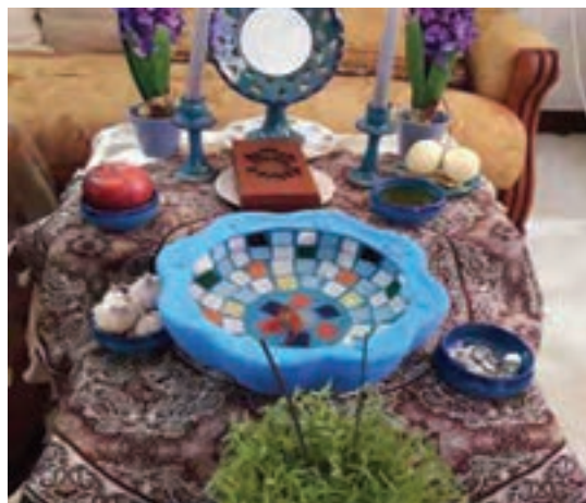
شکل ۱- آداب و رسوم

فعالیت ۱: با توجه به تصاویر بالا راجع به سؤالات زیر در گروه‌های خود گفت‌وگو کنید و نتیجه را در کلاس ارائه دهید.