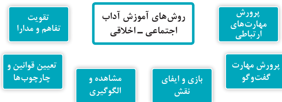
نمودار ۲- روش‌های آموزش آداب اجتماعی - اخلاقی

برای پرورش آگاهی‌های کودک از فرهنگ جامعه و تقویت آداب اجتماعی - اخلاقی، روش‌هایی را می‌توان پیشنهاد کرد که در ادامه به چند روش اشاره می‌شود (نمودار ۲).