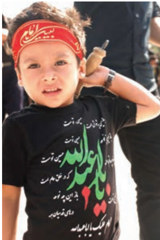
شکل ۵- حضور کودک در مناسبت‌های دینی و ملی