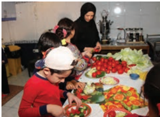
شکل ۴- همکاری و مشارکت کودک در انجام فعالیت‌های روزمره

کودک ممکن است در رفتارهای اجتماعی خود اشتباهاتی داشته باشد، مثلاً اسباب‌بازی‌ها را فقط برای خود بخواهد، زور بگوید، دعوا کند یا حرف‌های نامناسب بزند. در این‌گونه موارد، رفتار اصلاحی والدین و مربیان بسیار اهمیت دارد. رفتارهای همراه با عصبانیت، پرخاش، تحقیر و تنبیه نمی‌تواند در بهبود وضعیت تأثیر چندانی داشته باشد. ۱ بنابراین، خطاهای کودکان در رفتارهای اجتماعی و اخلاقی را با حوصله، ملایمت و صمیمانه تذکر دهید و از روش‌های تغییر رفتار استفاده کنید.