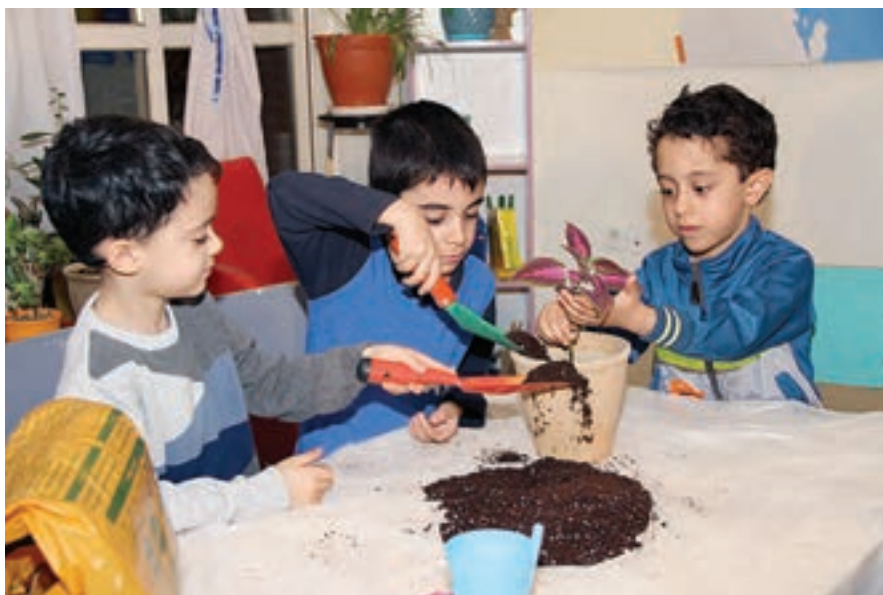
شکل ۶- همکاری کودک در نگهداری از محیط زیست

محیط زیست شامل مجموعه‌ای از عواملی است که انسان را احاطه کرده‌اند، (مانند آب، هوا، خاک، منابع طبیعی، گیاهان، حیوانات و اتمسفر) و بر زندگی ما تأثیر متقابل دارند. به موضوع محیط زیست، پژوهشگرانی از رشته‌های مختلف مانند: منابع طبیعی، کشاورزی، هواشناسی، زمین‌شناسی، زیست‌شناسی، حیات وحش، برنامه‌ریزی شهری، بهداشت، اقتصاد، حقوق و... توجه دارند و برای نگهداری آن اقدامات مختلفی را انجام می‌دهند. کره زمین در معرض انواع خطرهای تهدیدهای زیست‌محیطی قرار دارد و لازم است مسئله احترام به محیط زیست و حفظ و نگهداری از آن، از سنین کودکی آموزش داده شود (شکل ۶).