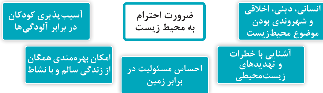
نمودار ۴- ضرورت های احترام به محیط زیست

بیشتر صاحب نظران اعتقاد دارند که در مورد اهمیت و ضرورت احترام به محیط زیست باید به نقش کودکان بیشتر توجه کرد و آگاهی آنها را با مسائل محیط زیست افزایش داد. ضرورت های احترام به محیط زیست در نمودار ۴ نشان داده می شود: