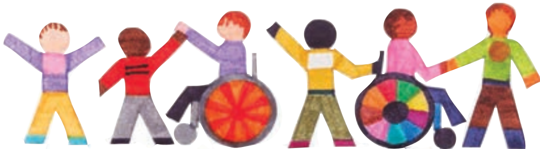
شکل ۴- بازی با کودکان دارای نیازهای ویژه

در این بازی‌ها از کودکان خواسته می‌شود ابتدا بازی خاصی را انتخاب کنند. این انتخاب از میان تمام بازی‌های مورد علاقه کودکان است. سپس باید در فرم و شکل بازی تغییراتی ایجاد کرد تا امکان بهره‌مندی کودک خاص کلاس که نیازهای ویژه دارد نیز مهیا باشد. به همین دلیل، مربیان ناگزیرند که به ویژگی‌های کودک موردنظر توجه کنند و خود را جای او بگذارند تا تغییراتی را در شکل جدید بازی پیشنهاد دهند، به طوری که حضور و فعالیت همه کودکان امکان‌پذیر شود. برای این بازی نام جدیدی انتخاب می‌شود تا تداعی‌کننده شکل آن و در عین حال متضمن دوستی و همدلی باشد. بدیهی است شناخت مربی از نیازهای ویژه این نوع کودکان و نیز مداخله او برای پیشنهادهای تکمیلی، ضروری است. برای مثال، اگر کودکی در حرکت مشکل دارد، بازی باید به گونه‌ای باشد که او بتواند در یک مکان بماند یا در جای خودش حرکت کند (بازی بی‌تحرك یا کم‌تحرك). اگر کودک در ناحیه دست معلولیت دارد، بازی نباید دارای حرکت‌های ظریف و ریز باشد. ابزار بازی‌ها و روش اجرای آنها نیز باید مناسب‌سازی شوند تا همه بتوانند در بازی مشارکت کنند. برای نمونه، می‌توانیم تکه‌های جورچین (پازل) را به شکلی تغییر دهیم که همه کودکان بتوانند با آن بازی کنند. اگر کودکی مشکل شناختی دارد، باید بازی را آسان‌تر کرد تا کودک بتواند آن را بفهمد و یاد بگیرد. در ادامه، نمونه بازی‌هایی که در آن به نیازهای ویژه کودکان این گروه توجه شده، آمده است (شکل ۴).