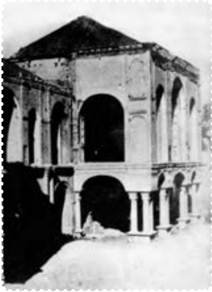
ساختمان مجلس شورای ملی پس از به توپ بستن توسط لیاخوف در ایام مشروطیت

ملک‌المتکلمین و سید جمال‌الدین واعظ اعدام شدند. بعضی از نمایندگان نیز که مورد تعقیب قرار گرفته بودند (از جمله تقی‌زاده)، به سفارت انگلیس پناه بردند. ۱ بدین گونه، دوباره، برای مدتی، استبداد حاکم شد. این دوره که یک سال به طول انجامید بار دیگر استبداد به جای مشروطیت حاکم شد. از این رو آن را دوره استبداد صغیر نامیده‌اند.