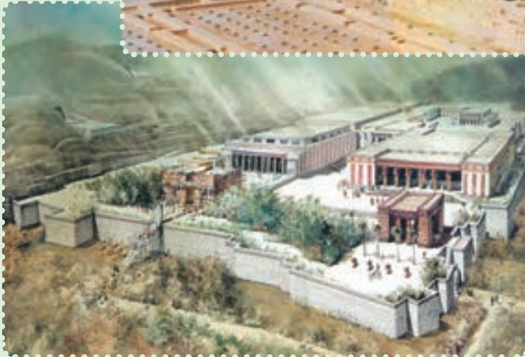
تخت جمشید و طرح خیالی آن

یافته است. ۱ برخی معتقدند، «ذوالقرنین» که در قرآن مجید ۲ به عنوان فرمانروایی نیک سیرت ستوده شده، همان کوروش پادشاه ایران است. ۳ با اینکه مؤسس دولت مقتدر هخامنشیان از سرزمین پارس