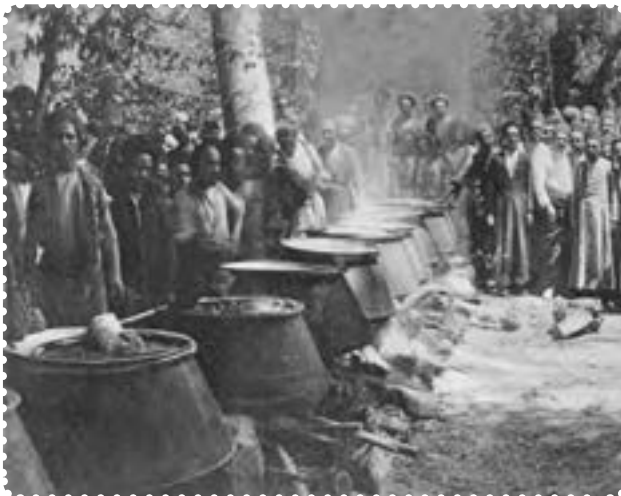
دیگ‌های غذا در سفارت انگلیس برای مشروطه خواهان

بدون پناهندگی به سفارت انگلستان، می‌توانستند به خواسته‌های خود دست یابند. دولت انگلستان بر خلاف دولت روسیه که از دربار حمایت می‌کرد، به ظاهر پشتیبان نهضت مشروطه بود. انگلستان، برای نیل به مقاصد و منافع استعماری‌اش این سیاست را در پیش گرفته بود. اما کسانی که از سیاست پیچیده استعمار انگلستان درک روشنی نداشتند