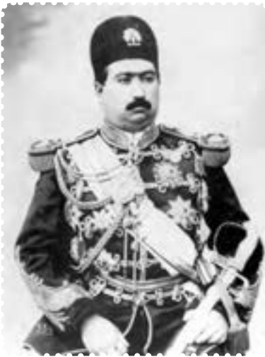
محمد علی شاه قاجار

بعد از مظفرالدین شاه، ولیعهد او، محمدعلی میرزا، با عنوان محمدعلی شاه، به سلطنت رسید. محمدعلی شاه، یکی از شاهان خودکامه دوره قاجار بود که نمی‌خواست در برابر قانون اساسی و مجلس شورای ملی تمکین کند. او در ۲۸ دی ۱۲۸۵ جشن تاج‌گذاری بر پا کرد و از اشراف و نمایندگان دولت‌های خارجی برای شرکت در این مراسم دعوت به عمل آورد، اما نمایندگان مجلس شورای ملی را دعوت نکرد. این، اولین بی‌اعتنایی محمدعلی شاه به مجلس بود. او ملت را بنده و برده خود می‌پنداشت و نمایندگان مجلس را برای دخالت در امور کشور و مشورت در سیاست، لایق نمی‌دانست. ۱