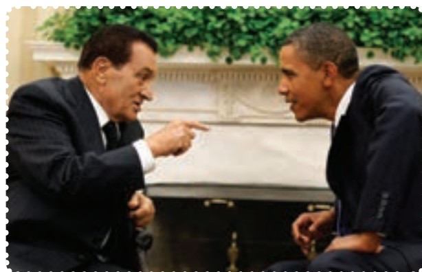
مبارک دیکتاتور مخلوع مصر و او باما رئیس‌جمهور آمریکا

در سال ۱۲۶۰ش/۱۸۸۱م انگلیسی‌ها، مصر را اشغال کردند. تحت تأثیر تحولات ناشی از جنگ جهانی اول، کوشش مصری‌ها برای رهایی از سلطه استعماری انگلستان بیشتر شد و سرانجام انگلیس به وضعیت تحت‌الحمایگی این کشور پایان داد و در این کشور نظام سلطنتی مشروطه اعلام کرد.