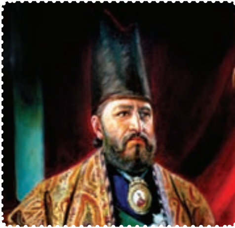
میرزا تقی‌خان امیرکبیر

کوتاه صدارت، برای حفظ تمامیت ارضی و مبارزه با دخالت بیگانگان، تلاش زیادی کرد. در روزگار او، سیاست داخلی و خارجی ایران به شدت تحت تأثیر دولت‌های بیگانه، به‌ویژه روسیه و انگلیس قرار