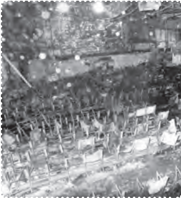
سینما رکس آبادان

امام خمینی، به شدت مورد حمله و توهین قرار گرفته بود. ۱