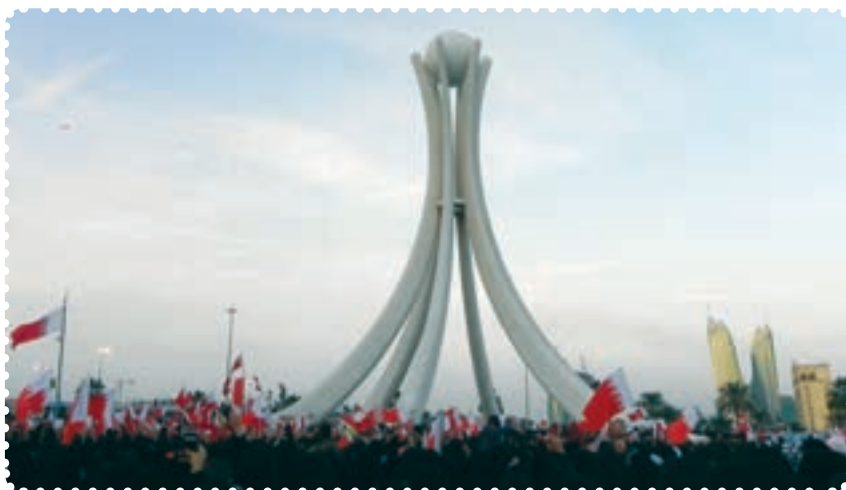
میدان لولو، نقطه آغازین قیام بحرینیان

سابقه جنبش‌ها و فعالیت‌های سیاسی در بحرین به سال‌های قبل از پیروزی انقلاب اسلامی، خصوصاً به اوایل دهه ۱۹۶۰ بر می‌گردد. ۲ اما بروز انقلاب اسلامی در ایران را باید منشأ تحولات و دگرگونی‌های جدید سیاسی در بحرین به حساب آورد. مردم بحرین به‌طور جدی خواستار انجام اصلاحات اساسی و برکناری حکومت آل خلیفه هستند و در این راه شهدای زیادی را تقدیم کرده‌اند ولی به دلیل حمایت خارجی از آن رژیم و سرکوب شدید مردم، انقلاب بحرین هنوز به نتیجه نرسیده است.