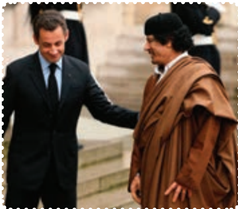
قذافی و سارکوزی رئیس جمهور پیشین فرانسه