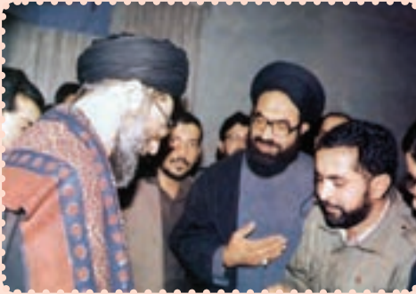
شهید عارف حسینی در محضر رهبر انقلاب اسلامی حضرت آیت الله خامنه‌ای

نهایت فعالیت‌های فکری و سیاسی وی باعث شد که دشمنان اسلام و تشیع وی را در مرداد ۱۳۶۷ به شهادت برسانند.