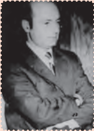
دکتر علی شریعتی (۱۳۱۲-۱۳۵۶ ش)

علی شریعتی در سال ۱۳۱۲ شمسی در روستای مزینان، از توابع سبزوار متولد شد. تحصیلات ابتدایی را نزد پدر خود محمدتقی شریعتی و دوره متوسطه را در دبیرستان های مشهد طی کرد و به دانشسرای تربیت معلم راه یافت. در سال ۱۳۳۲ در رشته ادبیات فارسی از دانشگاه مشهد فارغ التحصیل شد و در سال ۱۳۴۳ از دانشگاه سوربن فرانسه در رشته زبان شناسی تطبیقی دکترا گرفت و در همان سال به ایران بازگشت.