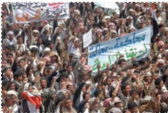
قیام مردم مسلمان یمن

کرد. سرانجام پس از ماه‌ها درگیری نظامی با سقوط طرابلس، حکومت قذافی سرنگون و خود او کشته شد. نکته جالب در مورد قذافی این است که وضعیت او بیش از هر دیکتاتوری به صدام شبیه بود. ت) بیداری اسلامی در یمن: جمهوری یمن در جنوب شبه جزیره عربستان واقع است و دارای نژادهای عرب (۸۶ درصد)، ترک، هندی، ایرانی و سومالیایی است. بیش از ۵۰ درصد یمنی‌ها شیعی مذهب‌اند که غالباً در منطقه صعده و شمال یمن ساکن‌اند. البته عمده شیعیان یمن زیدی‌اند که بعد از امام سجاد (ع)، زید بن علی (ع) را امام می‌دانند. مردم یمن در پی انقلاب‌های گوناگون در کشورهای اسلامی، اعتراضات و تظاهرات گسترده‌ای را در شهرهای مختلف علیه رژیم دیکتاتوری علی عبدالله