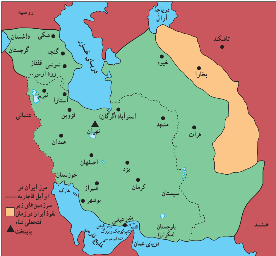
قلمرو ایران (در اوایل قاجاریه)

هجوم سیاسی- نظامی دولت‌های استعمارگر اروپایی، زمینه‌ساز بیداری اسلامی در ایران شد. عالمان دین برای مبارزه با نفوذ بیگانگان و مخالفت با سلطه استعماری از قواعد قرآنی و اسلامی مانند «قاعده نفی سبیل»، «جهاد» و «فتوا» بهره بردند. عالمانی همچون آیت‌الله شیخ جعفر نجفی کاشف الغطاء و آیت‌الله سید محمد مجاهد، که مقیم عتبات عالیات بودند، و ملا احمد نراقی و برخی از علمای ایران علیه روس‌ها فتوای جهاد دادند، و بعضی از آنها خود نیز در جبهه‌های جنگ شرکت کردند. این امر موجب شد که مردم ایران و حتی شهرهای نجف و کربلا، مشتاقانه در مناطق اشغالی به مقابله با روس‌ها پردازند و جلوی پیشروی آنان را بگیرند.