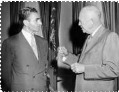
شاه در ملاقات با آیزنهاور رئیس‌جمهور آمریکا

آمریکا که از کمک به دولت دکتر مصدق اجتناب می‌کرد، پس از پیروزی کودتاچیان کمک‌های زیادی در زمینه‌های نظامی و اقتصادی به دولت کودتا کرد. ۱ باروی کارآمدن دولت نظامی زاهدی ۲ ، فضای تیره‌ای در جامعه ایران حکم فرما شد، فرمانداری نظامی تهران به سرتیپ تیمور بختیار سپرده شد. بختیار که افسری بی‌رحم و خونریز بود، برای استقرار و تثبیت حکومت کودتا، سرکوب نیروهای ضدکودتا