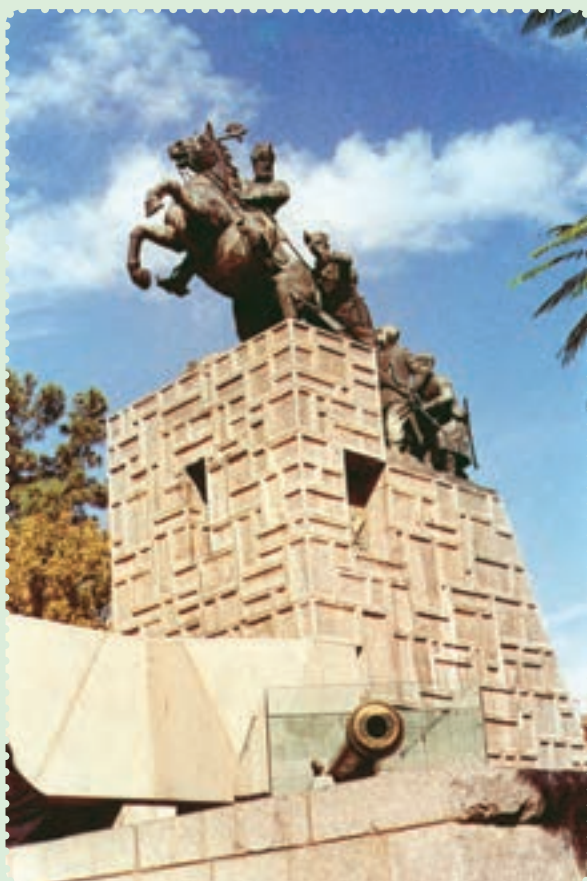
مجسمه و آرامگاه نادرشاه افشار در مشهد مقدس

توانست با شیوه حکومت داری توأم با ملاحظت، عدالت و رفاه نسبی، نام نیکی از خود بر جای بگذارد. ۱ وی تلاش کرد روابط خارجی ایران را که به دلیل هرج و مرج و نبود امنیت دچار اختلال شده بود، سامان بخشد، همچنین در برابر گسترش فعالیت‌های بازرگانی انگلستان در ایران ایستادگی کرد ۲ و از منافع نامشروع و استعماری این دولت جلوگیری به عمل آورد.