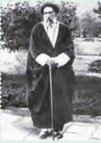
سید حسن مدرس نماینده ادوار مختلف مجلس شورای ملی

اقدام های خودسرانه و خشونت آمیز رضاخان در دوران تصدی وزارت جنگ، منجر به طرح استیضاح او در مجلس، به رهبری آیت الله سید حسن مدرس شد اما رضاخان، با طرح شایعه استعفای خود و صحنه سازی، طرفدارانش را علیه مجلس تحریک کرد و مخالفان را مورد ضرب و شتم و ارباب، قرار داد.