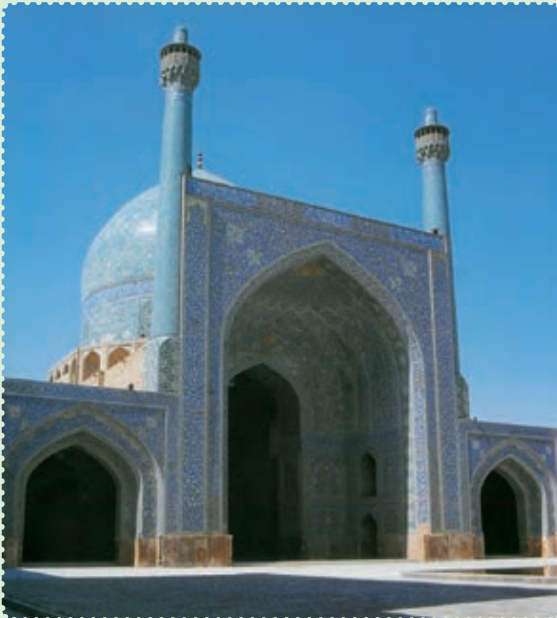
مسجد امام از آثار دوره صفوی در اصفهان

صفویان حکومتی تشکیل دادند که بیش از دو سده دوام یافت. در پرتو این حکومت مقتدر، علاوه بر برقراری امنیت و رونق اقتصادی، پیشرفت بازرگانی و کشاورزی و صنعت، تشکیل ارتش منظم و سیاست خارجی مقتدرانه، آنها توانستند فرهنگ و تمدن ایران و اسلام را بار دیگر شکوفا کنند. هنر و معماری در این دوره نیز از نظر کمی و کیفی توسعه و تحول یافت. اصفهان، پایتخت صفویان، دارای مجموعه‌ای از معماری عصر صفوی است که نشان می‌دهد، معماری ایرانی