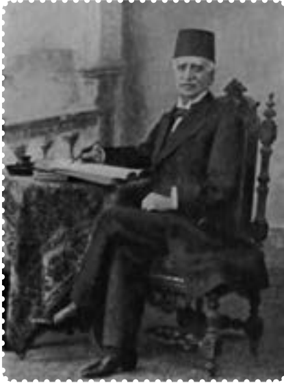
میرزا ملکم خان

ایران (معادن، جنگل‌ها، صنایع، گمرکات، بنادر، شیلات و...) که پشتوانه کشور و متعلق به نسل حاضر و آینده بود به تاراج رفت.