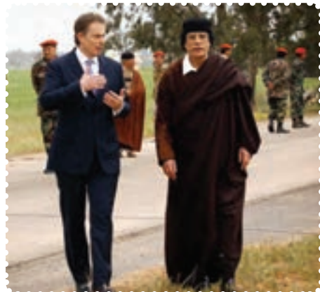
سرهنک قذافی دیکتاتور پیشین لیبی در کنار نخست وزیر انگلستان

کرد. سرانجام پس از ماه‌ها درگیری نظامی با سقوط طرابلس، حکومت قذافی سرنگون و خود او کشته شد. نکته جالب در مورد قذافی این است که وضعیت او بیش از هر دیکتاتوری به صدام شبیه بود. ت) بیداری اسلامی در یمن: جمهوری یمن در جنوب شبه جزیره عربستان واقع است و دارای نژادهای عرب (۸۶ درصد)، ترک، هندی، ایرانی و سومالیایی است. بیش از ۵۰ درصد یمنی‌ها شیعی مذهب‌اند که غالباً در منطقه صعده و شمال یمن ساکن‌اند. البته عمده شیعیان یمن زیدی‌اند که بعد از امام سجاد (ع)، زید بن علی (ع) را امام می‌دانند. مردم یمن در پی انقلاب‌های گوناگون در کشورهای اسلامی، اعتراضات و تظاهرات گسترده‌ای را در شهرهای مختلف علیه رژیم دیکتاتوری علی عبدالله