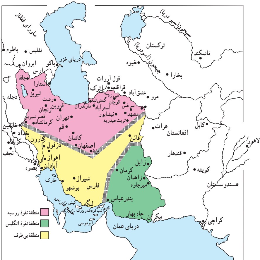
نقشه تقسیم ایران براساس قرارداد ۱۹۰۷

افغانستان که دارای ارزش حیاتی برای دفاع از هند بود، قلمرو نفوذ انگلستان مقرر گردید. قسمت سوم که شامل کویرها و بیابان‌های بی‌آب و علف بود، منطقه بی‌طرف و متعلق به ایران شناخته شد. منظور از این کار هم آن بود که دو دولت تا حدودی از یکدیگر فاصله بگیرند و از برخوردهای احتمالی بین آنها، جلوگیری شود.