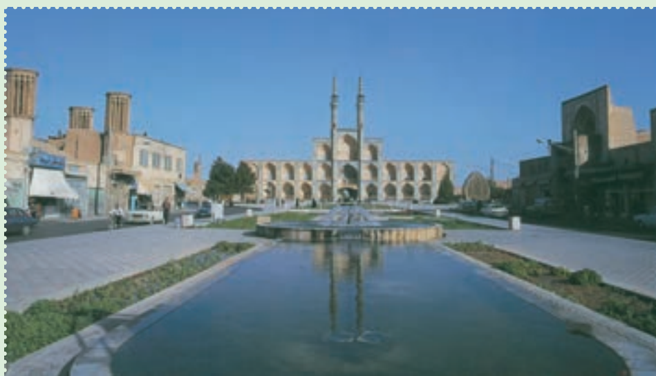
میدان تاریخی امیر چخماق در مرکز شهر یزد

با آنکه مغولان در آغاز ویرانی های بسیاری به همراه آوردند، ولی بر اثر آشنایی با فرهنگ ایران و اسلام، از طریق آنان فرهنگ، هنر و تمدن ایران و اسلام رواج یافت. پس از پایان حکومت ایلخانان، حکومت های ملوک الطوائفی و محلی متعددی چون تیموریان، آل جلائر، آل مظفر، سرداران و آل کرت، اتابکان، قراقویونلوها و آق قویونلوها طی قرن های هشتم و نهم قمری بر ایران حکومت کردند، اما هیچ کدام نتوانستند یکپارچگی ایران را حفظ کنند. سرانجام در سال ۹۰۷ق، حکومت صفوی توانست پس از