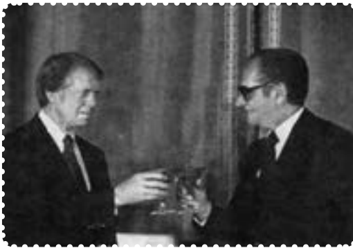
کارتر و شاه

در این درس با وضعیت کشور در آستانه انقلاب اسلامی آشنا می‌شوید. سوءاستفاده آمریکایی‌ها از ایران تحت سلطه، روی کار آمدن جیمی کارتر، چگونگی برخورد با زندانیان سیاسی، سفر کارتر به ایران، رحلت آیت‌الله حاج آقا مصطفی خمینی، انتشار مقاله اهانت آمیز نسبت به امام خمینی، قیام نوزدهم دی قم و کشتار هفده شهریور ۱۳۵۷ در تهران مهم‌ترین موضوع‌های مورد بررسی در این درس است.