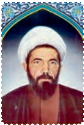
شهید دکتر محمد مفتاح

ترور فیزیکی در فاصله کوتاهی از عمر انقلاب آغاز شد و دو مرحله داشت. مرحله اول آن از ابتدای سال ۱۳۵۸ آغاز شد: در سوم اردیبهشت ماه ۱۳۵۸، تیمسار قرنی، اولین رئیس ستاد مشترک ارتش جمهوری اسلامی ایران را به شهادت رساندند. در شامگاه یازدهم اردیبهشت ماه همان سال، رئیس شورای انقلاب، علامه شهید، آیت‌الله مرتضی مطهری، که پس از امام، دارای بالاترین موقعیت دینی، سیاسی و فرهنگی کشور بود و از نظر علمی نیز موقعیت بسیار ممتازی در میان علمای زمان خویش داشت و از نظریه پردازان بسیار ارزشمند انقلاب اسلامی به‌شمار