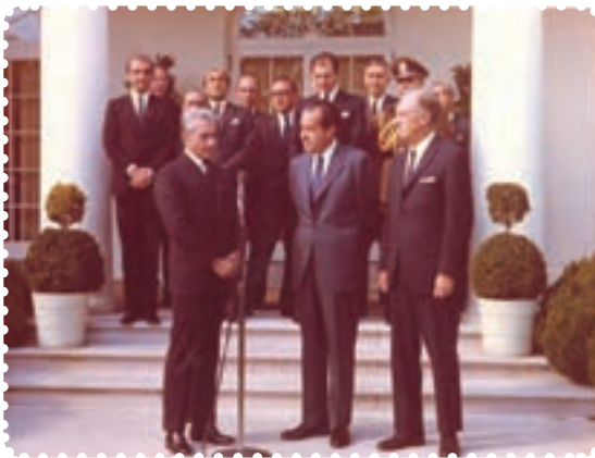
محمد رضا شاه در دیدار با نیکسون رئیس‌جمهور آمریکا

زندانی و تبعید کردن روحانیان، دانشمندان، فرهنگیان، استادان دانشگاه و نویسندگان پیامدهای منفی بسیاری برای رژیم داشت. براساس اعلام سازمان عفو بین‌المللی، ایران در سال‌های مذکور از نظر تعداد زندانیان سیاسی، مقام سوم را در جهان داشت. ۱