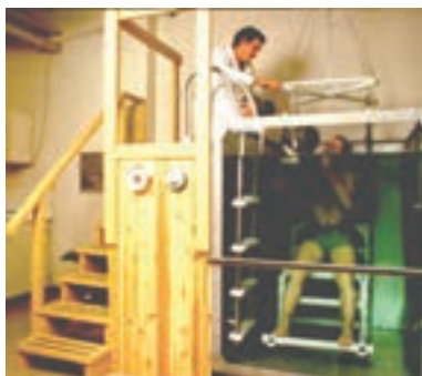
توزین زیر آب