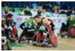
راگبی با ویلچر