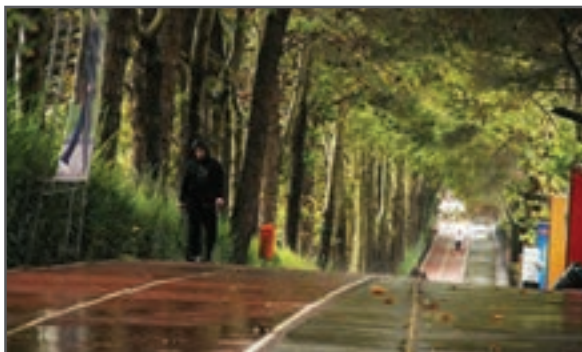
شکل ۳-۶- جاده تندرستی

مکان و مسیری است که در سال‌های اخیر برای ورزش و تندرستی و سلامتی احداث شده است. این جاده‌ها معمولاً در پارک‌های تفریحی، فضاهای باز، مجموعه‌های ورزشی قرار دارند و شرایط مناسبی برای انجام ورزش صبحگاهی و شامگاهی به وجود آورده‌اند. (شکل ۳-۶)