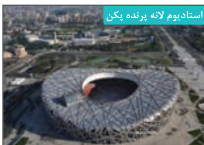
استادیوم لانه پرنده پکن

مکانی است که از یک میدان بازی درست شده (مانند فوتبال، دوچرخه‌سواری و دوومیدانی) که دور تا دور میدان، جایگاه تماشاگران که به صورت پلکانی قرار دارد و زیر جایگاه مکان‌های سرپوشیده برای بدن‌سازی، ژیمناستیک و ... طراحی شده است. در میان رشته‌های ورزشی، ورزش تنیس، فوتبال، دوچرخه‌سواری و دوومیدانی استادیوم مخصوص خود را دارند. از نمونه استادیوم‌های معروف استادیوم‌های تنیس ویمبلدون و لانه پرنده پکن (آشیانه پرنده) را می‌توان نام برد. (شکل ۳-۴)