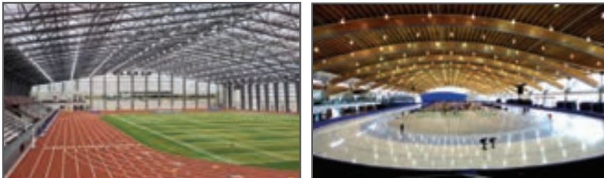
شکل ۲-۳- نمونه‌ای از ورزشگاه‌های مدرن

به گروه‌های مختلف تقسیم شوید و در مورد اماکن ورزشی عمومی و تخصصی محله خود یا محل تحصیل خود بحث کنید و نتایج را به کلاس ارائه دهید.