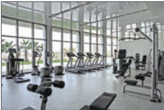
شکل ۱۲-۳ در و پنجره مناسب در مکان ورزشی

۵ تکیه‌گاه کافی برای نصب تخته‌های بسکتبال، ابزار ژیمناستیک و ... بر روی دیوارها وجود داشته باشد.