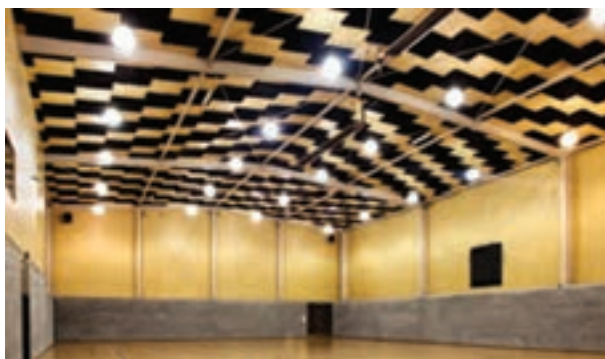
شکل ۱۴-۳- نور مصنوعی در سالن ورزشی

* به دلیل استفاده از نور مصنوعی زمان بهره‌برداری از سالن افزایش می‌یابد.