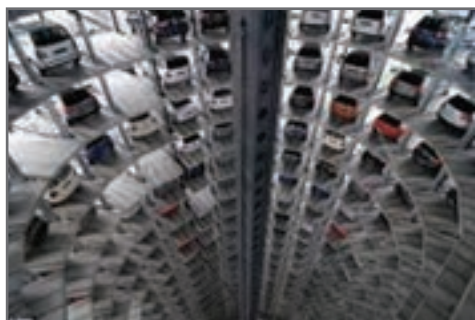
شکل ۱۹-۳-ب) پارکینگ مدرن ورزشگاه

اصولی‌ترین روش احداث پارکینگ این است که پارکینگ در پیرامون فضای ورزشی روبه‌روی در ورود و خروج باشد و به لحاظ کاربری به چند نوع تقسیم می‌شود (شکل ۱۹-۳)