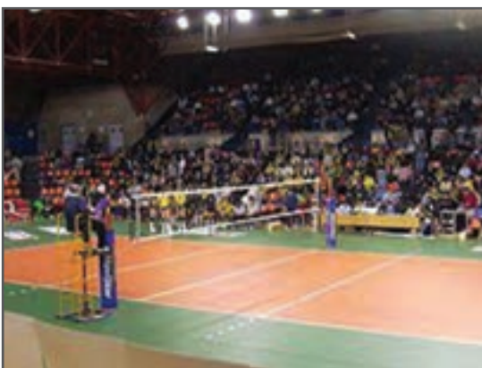
شکل ۹-۳- ب) کف ارتجاعی در سالن والیبال

کف‌ها گران‌قیمت بوده و به دلیل مواد به کار رفته، خاصیت ارتجاعی دارند. (شکل ۹-۳)