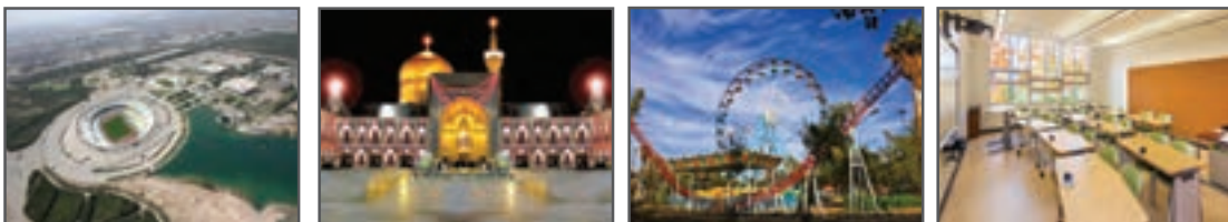
شکل ۱-۳- انواع اماکن ورزشی، مذهبی، ...

جهان ما روز به روز پیشرفت می‌کند و واژه‌های «مشخص»، «مشخصه» و «تخصیص» مفهوم بیشتری در زندگی ما پیدا می‌کنند. از آنجایی که در گذشته اعضای یک خانواده همگی در یک اتاق مشترک زندگی می‌کردند اما امروزه هر یک یا افراد درخواست تخصیص یک اتاق مستقل، یا حداقل یک فضای مشخص برای خود را دارند. بیمارستان‌ها در گذشته‌های دور همه بیماران خود را در سالن‌های بزرگی که به بخش‌های کوچک‌تر تقسیم می‌شد، درمان می‌کردند و حتی پزشکان عمومی، بیماران مشخصی را تحت درمان قرار می‌دادند.