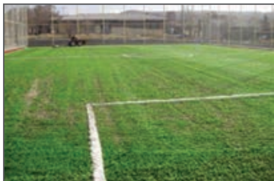
شکل ۱۰-۳- زمین غیر ارتجاعی در زمین بازی پارک

* کف‌های غیر ارتجاعی: خاصیت ارتجاعی ندارند مانند: کف پوش‌های بتنی، آسفالت، خاک، چمن و چوب (شکل ۱۰-۳)