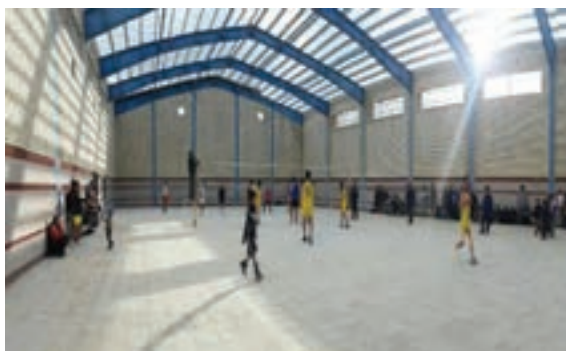
شکل ۱۵-۳- نور طبیعی در سالن ورزشی

* سالن فقط در ساعاتی از شبانه‌روز قابل استفاده است.