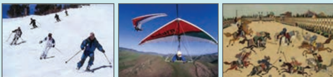
شکل ۸-۳- نمونه‌هایی از ورزش‌های فضای باز

به نظر می‌رسد تمام فعالیت‌های ورزشی می‌تواند در یک مجموعه ورزشی برگزار شود. اما برخی رشته‌های خاص، امکان احداث در یک مجموعه ورزشی را هم ندارند. (شکل ۸-۳) این امر یا به دلیل نیازهای ورزشی مانند رشته‌های کایت‌سواری، چوگان، ورزش‌های تفریحی، اسکی و ... است و یا به دلیل تفاوت‌های فلسفی و اعتقادی حاکم بر رشته ورزشی، مانند زورخانه می‌باشد.