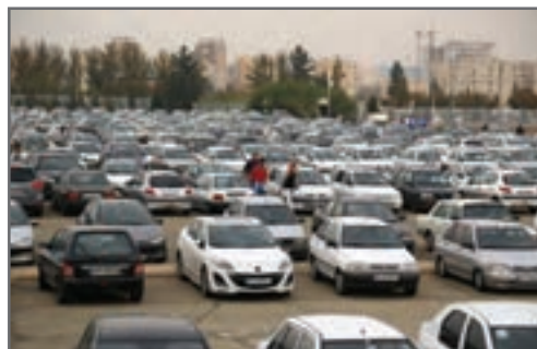
شکل ۱۹-۳-الف) پارکینگ معمولی ورزشگاه