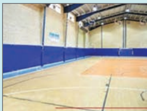
شکل ۱۱-۳- نمونه‌ای از دیوار اماکن ورزشی

در ارتباط با دیوارها رعایت نکات زیر ضروری است: ۱ برای پوشش دیواره‌های استخر و رختکن و سرویس‌های بهداشتی از موادی استفاده شود که در برابر رطوبت مقاوم باشند. ۲ تا ارتفاع ۲ الی ۳ متری، هیچ‌گونه برآمدگی خراشنده یا ساینده‌ای نداشته باشد. دیوار تا ارتفاع ۳ متر جاذب صدا باشد. ۳ روی کلیه ستون‌ها محافظ‌ها و پوشش‌های ایمنی وجود داشته باشد.