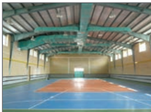
سقف غیر کاذب یا نمایان