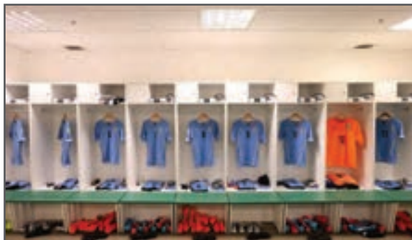
شکل ۳-۱۶- رختکن مجهز