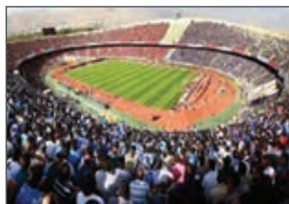
شکل ۳-۵- مجموعه ورزشی آزادی

مجموعه ورزشی، جامع‌ترین و کامل‌ترین مکان ورزشی است مانند مجموعه ورزشی آزادی که وسعت زیادی دارد و دارای امکانات ورزشی منظمی مانند: