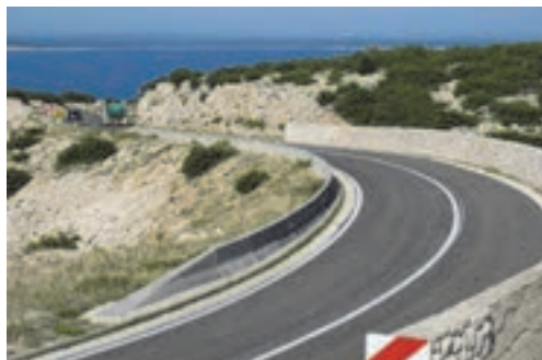
شکل ۸ - سنگ چینی اطراف راه