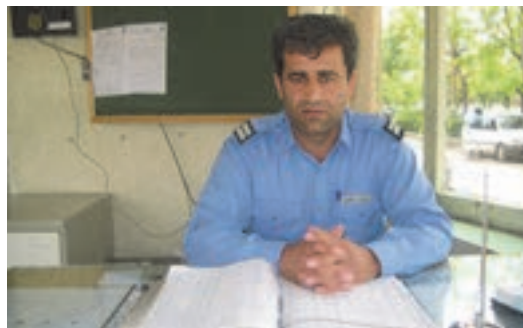
شکل ۵- نگهبان

■ متصدی ایمنی و آتش‌سوزی: فردی است که وظیفه پیشگیری از وقوع آتش‌سوزی در پایانه را به عهده دارد و هنگام وقوع آتش‌سوزی در پایانه افراد را از آتش دور کرده و تا رسیدن مأموران آتش‌نشانی با رعایت نکات ایمنی و با استفاده از تجهیزات اطفاء حریق را انجام داده و نکات فنی و موارد ضروری را به مأموران آتش‌نشانی گزارش می‌دهد.