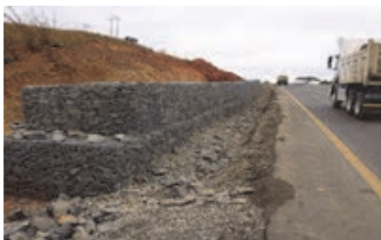
شکل ۱۰- دیوارهای گابیونی کنار راه

■ متصدی مسافربری بین‌المللی: که به آن کارگزار مسافربری هم می‌گویند. این فرد با در اختیار گذاردن وسیله حمل و نقل مناسب، زمان جابه‌جایی مشخص، تشریفات جانبی بین راهی و هزینه توافق شده، مسافر/ مسافران را از مبدأ توافقی به مقصد توافق شده می‌رساند.