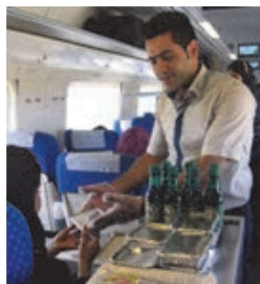
شکل ۴- مهماندار

■ کارمند خدمات ویژه مسافری: فردی است که به عنوان متصدی به افراد معلول و توان‌یاب بر اساس قوانین حمایت از معلولان و با استفاده از تجهیزات مناسب، وظیفه کمک‌رسانی به آنها را همراه با رعایت نکات ایمنی در وسایل نقلیه عمومی به عهده دارد.