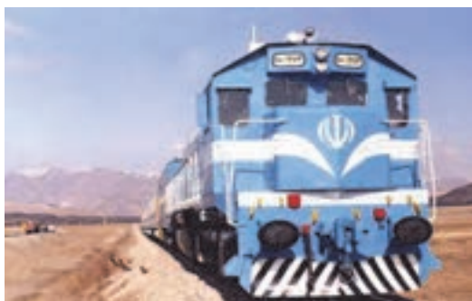
شکل ۲- حمل‌ونقل ریلی

اما حمل‌ونقل ریلی مابین ایستگاه‌هایی خاص در طول مسیر انجام می‌شود و قطار نمی‌تواند در هر مکانی که بخواهد توقف داشته باشد. اما حمل‌ونقل جاده‌ای متفاوت است. یعنی امکان حمل‌ونقل مسافر و یا تحویل گرفتن