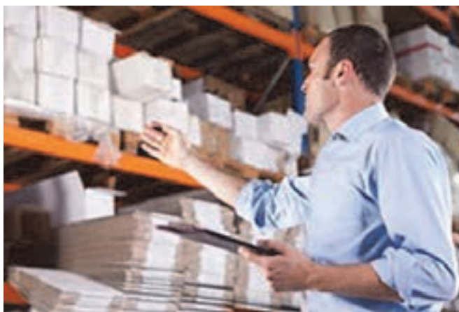
شکل ۶- متصدی انبار

■ متصدی سیستم‌های امنیتی پایانه: فردی است که توانایی استفاده، راه اندازی، فعال کردن و