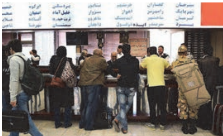
شکل ۳- متصدی فروش بلیت

■ متصدی انبار توشه مسافر: فردی است که در شرکت‌ها و پایانه‌های مسافربری مسئولیت دریافت توشه و کنترل توشه مسافران بر اساس دستورالعمل‌ها، ثبت و صدور رسید توشه، نگهداری و تحویل توشه را به عهده دارد.