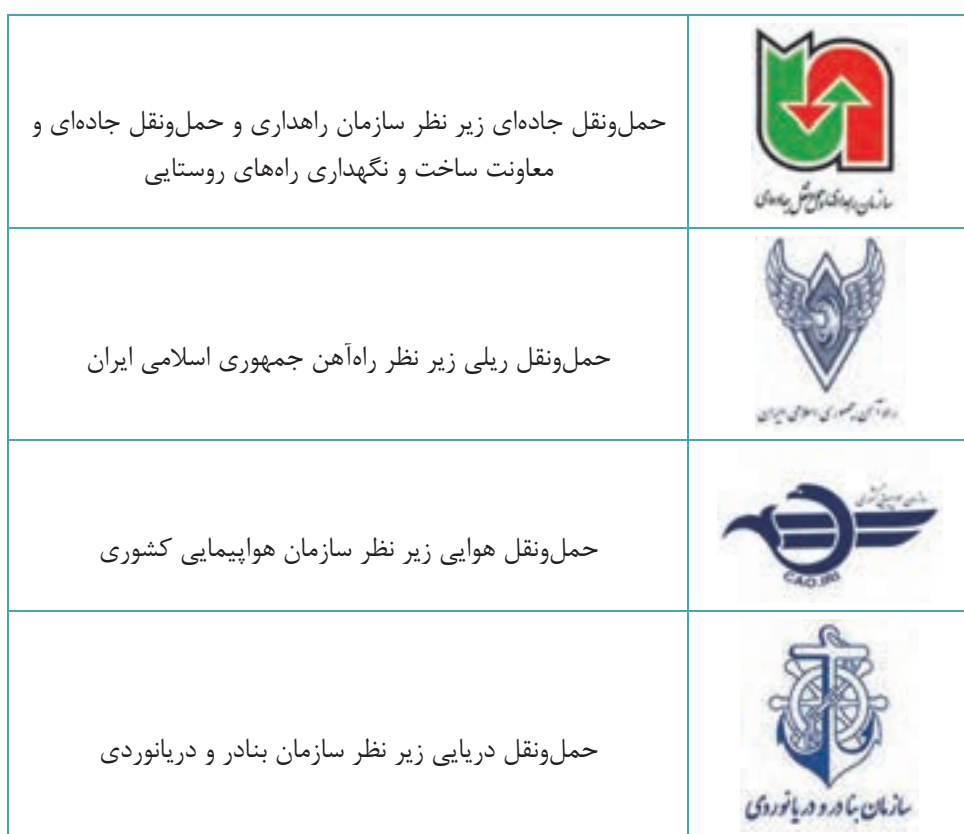
جدول ۱- سازمان‌های مرتبط با شیوه‌های مختلف حمل و نقل

در کشور ما متولی بخش حمل و نقل درون شهری (داخل شهر) وزارت کشور و شهرداری‌ها بوده و در سطح بین شهری و بین‌المللی (خارج کشور) وزارت راه و شهرسازی این امور را به عهده دارند. هر کدام از بخش‌های حمل و نقل برون شهری نیز به دلیل تفاوت در زیرساخت و بهره‌برداری، زیر نظر یکی از سازمان‌های تابعه وزارت راه و شهرسازی به صورت مجزا و با قوانین مربوط به آن می‌باشد.