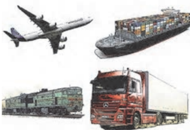
شکل ۱- حمل‌ونقل دریایی، هوایی، زمینی

حمل‌ونقل دارای شیوه‌های مختلف زمینی، هوایی و دریایی می‌باشد. در میان شیوه‌های حمل‌ونقل، حمل‌ونقل هوایی نسبتاً گران‌قیمت بوده و لذا برای مسافرت‌های سریع یا مسافت‌های طولانی و بارهای خاص مدنظر قرار می‌گیرد. حمل‌ونقل دریایی نیز، به وجود دریا یا مسیرهای آبی (دریا، اقیانوس) وابستگی دارد. بنابراین حمل‌ونقل در داخل کشورها غالباً به صورت جاده‌ای یا ریلی انجام می‌گیرد.