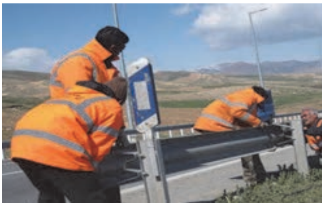
شکل ۷- نصب گاردریل کنار راه

گاردریل‌ها را می‌شناسد، توانایی بکارگیری سیستم گاردریل براساس شرایط فیزیکی و هندسی منطقه را دارد، قابلیت خواندن نقشه‌های اجرایی، برآورد مصالح و تجهیزات برای نصب گاردریل و اجرای عملیات نصب بر اساس استاندارد ایمنی راه‌ها و ابلاغیه‌های سازمان راهداری را دارد.