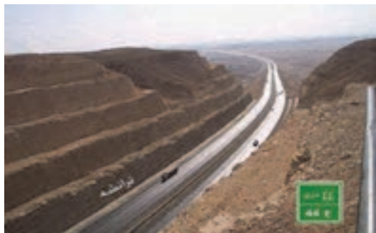
شکل ۹- ترانشه (شیروانی‌های خاکی اطراف راه)