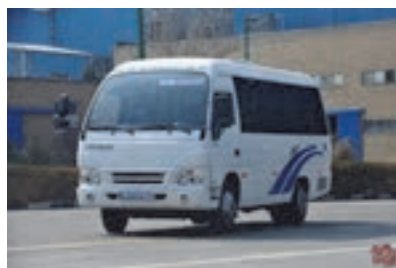
شکل ۱۳- مینی بوس