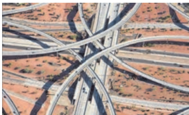
شکل ۲۷- تقاطع غیر هم‌سطح

■ تقاطع: محدوده‌ای است که در آن دو یا چند مسیر به صورت هم‌سطح یا غیرهم‌سطح با یکدیگر تلاقی می‌کنند.