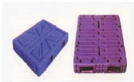
شکل ۲۳- انواع پالت

■ پک: بسته واحدی است (مانند کارتن و کیسه‌های کاغذی حاوی سیمان) که از چندین لایه بار مشابه یا متفاوت تشکیل گردیده و جهت حمل بر روی پالت قرار می‌گیرد.