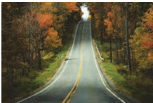
شکل ۲۴- راه

■ راه: مسیریایی که برای عبور و مرور عموم وسایل نقلیه موتوری و غیر موتوری مورد استفاده قرار می‌گیرد.