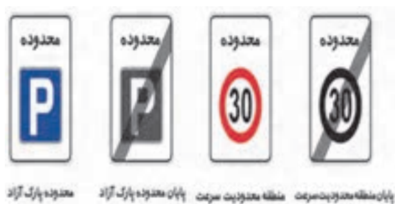
شکل ۴۳- تابلوی آگاهی دهنده