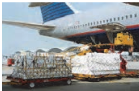
شکل ۴۹- ترخیص کالا

۲- کیفیت زیرساخت‌ها: این شاخص مربوط به اندازه‌گیری کیفیت زیرساخت‌های کشور در حمل‌ونقل مانند راه‌ها، راه‌آهن، بنادر و فرودگاه‌ها و همچنین ارتباطات از راه دور و فناوری اطلاعات است.