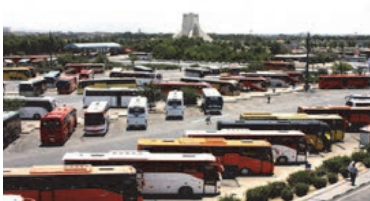
شکل ۴۴- نمایی از یک پایانه مسافربری

■ پایانه مسافربری: فضایی برای سوار و پیاده کردن مسافران اتوبوس‌های شهری و بین شهری است که اتوبوس مسیر برنامه‌ریزی شده خود را از آنجا شروع کرده یا در آن خاتمه می‌دهد. پایانه مسافربری غالباً به شکل یک ساختمان بزرگ همراه با امکانات رفاهی طراحی می‌شود. شرکت‌های مسافربری دارای دفاتر فروش بلیت در پایانه‌ها هستند و مسافران از طریق سکوها مشخص سوار یا پیاده می‌شوند.