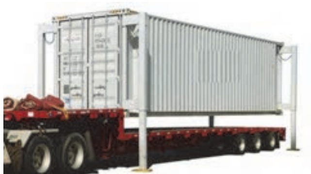
شکل ۲۲- کانتینر