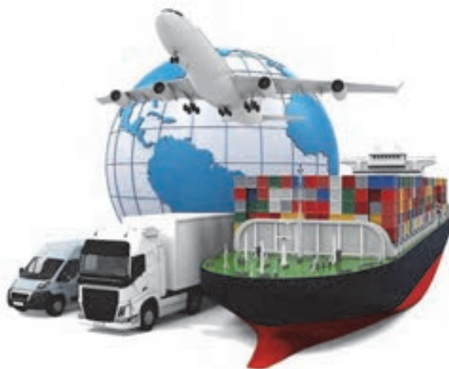
شکل ۱- شیوه‌های مختلف حمل‌ونقل

اولین سؤالی که در این کتاب برای شما پیش می‌آید این است که حمل‌ونقل چیست؟ حمل‌ونقل به معنی جابه‌جایی مسافر یا بار از مبدأ به مقصد است. دسترسی انسان به کالا و خدمات از طریق شبکه جابه‌جایی (مسیرهای حمل‌ونقل) و وسایل جابجا کننده (وسایل حمل‌ونقل) ایجاد می‌گردد. به طور کلی حمل‌ونقل در سراسر جهان به سه سطح درون‌شهری، بین‌شهری و بین‌المللی تقسیم می‌شود و معمولاً با یکی از شیوه‌های (شقوق) حمل‌ونقل جاده‌ای، هوایی، ریلی، دریایی، لوله‌ای و یا مجموعه‌ای از آنها انجام می‌گیرد.