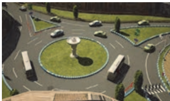
شکل ۳۳- خیابان‌های اطراف یک میدان

■ خیابان: راه عبور و مرور در محل سکونت و فعالیت مردم در شهرها که عرض آن بیش از ۶ متر باشد.