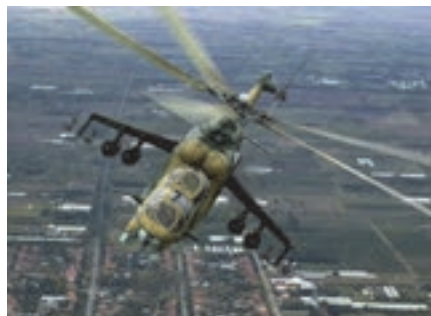
شکل ۷- الهام از سنجاقک برای ساخت بالگرد

الگوبرداری از بال جغد برای ساخت هواپیمای بی‌صدا، بال جغد دارای ساختارهایی است که به این پرنده اجازه می‌دهد که بدون هیچ صدایی پرواز کند محققان از این موضوع الگوبرداری کرده و هواپیماهای بی‌صدا را تولید کرده‌اند.