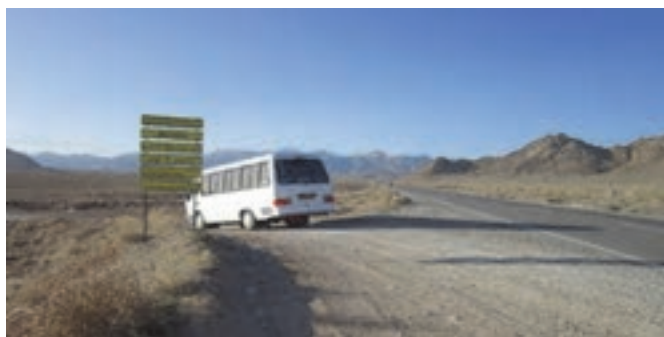
شکل ۳۴- جاده و انشعاب فرعی از آن