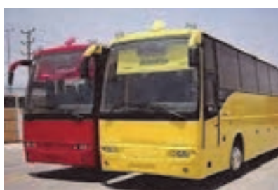
شکل ۱۴- اتوبوس

قطارهای شهری مانند مترو، مونوریل و تراموا نیز ناوگان مسافری محسوب می شوند.