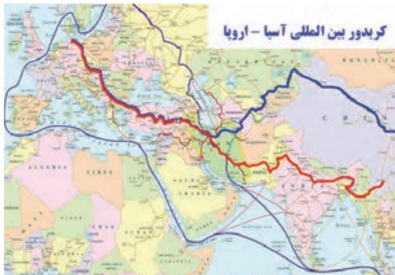
شکل ۳۸- راهگذر بین‌المللی آسیا - اروپا

■ راهگذر (کریدور): به محل تردد بین‌المللی با هریک از شیوه‌های حمل‌ونقلی جاده‌ای، دریایی، ریلی، هوایی یا ترکیبی کالا و مسافر گفته می‌شود که براساس موافقتنامه‌های بین‌المللی امضا شده بین کشورها تعیین شده باشد.