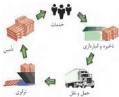
شکل ۴۸- لجستیک (مراحل تولید تا توزیع کالا)

امور مرتبط با بخش حمل و نقل و انبارداری (که به آن لجستیک نیز گفته می‌شود) یکی از فرآیندهای مهم توسعه کشورها محسوب می‌شود. به زبان دیگر لجستیک عبارت است از سازماندهی حرکت کالا یا محصول از زمانی که تولید می‌شود یا برداشت می‌شود تا زمانی که به‌دست مصرف‌کننده می‌رسد با حداقل هزینه در کوتاه‌ترین زمان ممکن. همچنین لجستیک کلیه فرآیندهای انبارداری، بسته‌بندی، توزیع و حمل و نقل را در برمی‌گیرد. (شکل ۴۸)