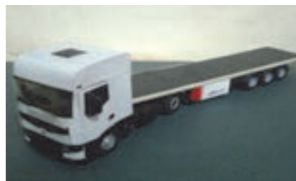
شکل ۱۷- کامیون کفی