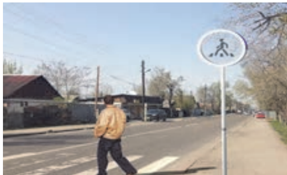
شکل ۳۰- گذرگاه ویژه عابر پیاده

■ گذرگاه پیاده: مسیرهایی که در تقاطع راه‌ها یا هر محل دیگری از سواره رو به وسیله خط‌کشی یا میخ‌کوبی یا سایر علائم جهت عبور افراد پیاده اختصاص داده شده است.