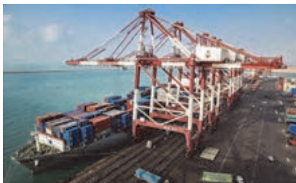
شکل ۵۱- گمرک بندر شهید رجایی - بندرعباس

وابستگی اقتصادی کشور به درآمدهای حاصل از صادرات نفت و لزوم کاهش این وابستگی از جمله مهم‌ترین اهداف مورد نظر مسئولان و برنامه‌ریزان کشور است. حمل و نقل بین‌المللی و ترانزیت کالا، می‌تواند یکی از منابع مهم کسب درآمد برای کشورمان، محسوب شود. هنگامی که یک کالا از گمرک کشور وارد و از داخل کشور عبور و از گمرک دیگری خارج می‌شود، از طریق عوارض گمرکی، عوارض جاده‌ای و سایر پرداخت‌ها، درآمدهای قابل توجهی را برای کشور ایجاد می‌نماید. همچنین افزایش ارتباطات تجاری به‌خصوص در سطح بین‌المللی باعث انتقال فرهنگ و آیین هر کشور به کشورهای دیگر خواهد بود که این امر برای کشور عزیزمان و انتقال فرهنگ ایرانی - اسلامی بسیار مهم و ارزشمند خواهد بود.