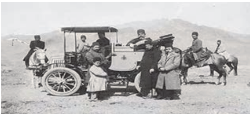
شکل ۳- نمایی از اتومبیل کالسکه‌ای

در تهران قدیم نیز چندین چاپارخانه (پیک خانه - که خدمات پستی در آن انجام می‌گرفت) و همچنین کاروانسرا وجود داشت که علاوه بر نامه‌رسانی، امور حمل مسافر به خارج از شهر نیز از این طریق انجام می‌گرفت. اتومبیل برای اولین بار در ایران در سال ۱۲۸۰ توسط مظفرالدین شاه از کشور بلژیک خریداری و به ایران آورده شد.