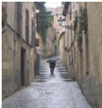
شکل ۳۱- کوچه

■ معابر محلی: راه‌هایی هستند که در طراحی و بهره‌برداری از آنها نیازهای وسایل نقلیه و عابران پیاده، با اهمیت یکسان در نظر گرفته می‌شود و ارتباط بین کوچه‌ها و خیابان‌های شریانی فرعی را برقرار می‌کنند.