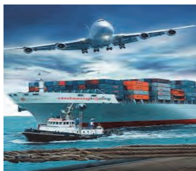
شکل ۱۱- انواع حمل‌ونقل