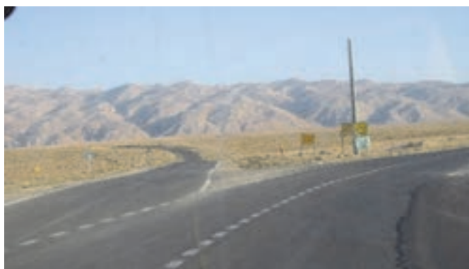
شکل ۳۵- جاده اصلی و انشعابات فرعی آن