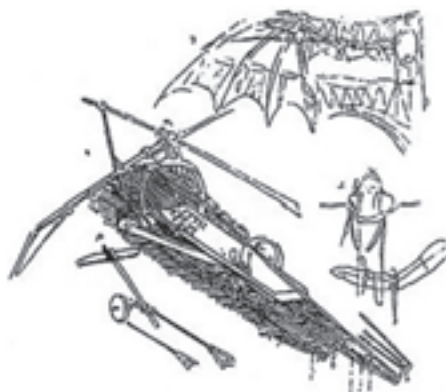
شکل ۶- طراحی ماشین پرنده با الهام از پرندگان

همواره خلقت منبع الهامی برای دانشمندان و طراحان بوده است. بسیاری از اختراعات کنونی موجود در جهان با الهام از طبیعت بیکران خداوند منان ساخته شده است. از آلبرت اینشتین ۱ نقل شده است که «به طبیعت با دقت نگاه کنید آنگاه جواب پرسش های خود را خواهید یافت». در بخش های مختلف حمل و نقل نیز دانشمندان با الهام از طبیعت دست به ساخت و طراحی وسایل و تجهیزاتی زده است که در ادامه به بخشی از آنها پرداخته شده است: