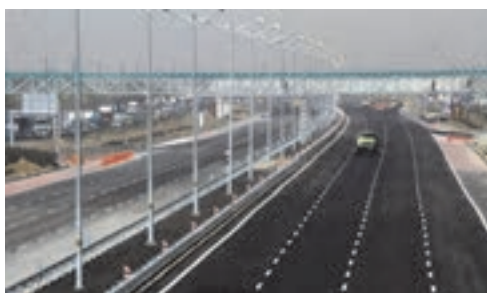
شکل ۳۶- نمونه هایی از بزرگراه

■ آزادراه: آزادراه به راهی گفته می شود که حداقل دارای دو خط اتومبیل رو و یک شانه حداقل به عرض سه متر برای هر طرف رفت و برگشت بوده و دو طرف آن به نحوی محصور بوده و در تمام طول آزادراه از هم کاملاً مجزا باشد و ارتباط آنها با هم تنها به وسیله راه های فرعی که از زیر یا بالای آزادراه عبور کند تأمین شود و هیچ راه دیگری آن را قطع نکند.