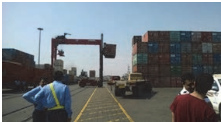
شکل ۴۵- محل تخلیه و بارگیری در یک پایانه باری (دریایی - ریلی) در بندرعباس

■ پایانه باری: پایانه بار محلی است که به منظور ساماندهی امور حمل‌ونقل کالا و ارائه خدمات مورد نیاز رانندگان وسیله‌نقلیه عمومی باری، مؤسسات و شرکت‌های حمل‌ونقل کالا و صاحبان بار احداث شده است.