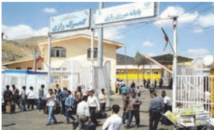
شکل ۴۶- پایانه مرزی و گمرک رازی

■ مجتمع خدماتی - رفاهی: مکانی است که در محورهای اصلی و ترانزیتی کشور جهت ارائه خدمات مورد نیاز رانندگان، مسافران و وسایل نقلیه به صورت متمرکز احداث می‌شود. از جمله این خدمات می‌توان به تعمیرگاه، درمانگاه، رستوران، مسجد، استراحتگاه، جایگاه‌های عرضه سوخت، پارکینگ و... اشاره نمود.