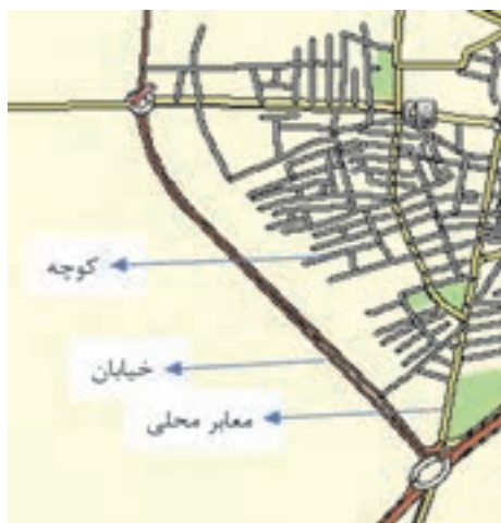
شکل ۳۲- اتصال کوچه و خیابان با معابر محلی

■ معابر محلی: راه‌هایی هستند که در طراحی و بهره‌برداری از آنها نیازهای وسایل نقلیه و عابران پیاده، با اهمیت یکسان در نظر گرفته می‌شود و ارتباط بین کوچه‌ها و خیابان‌های شریانی فرعی را برقرار می‌کنند.