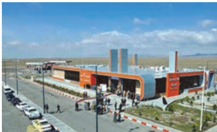
شکل ۴۷- مجتمع خدماتی - رفاهی

■ مجتمع خدماتی - رفاهی: مکانی است که در محورهای اصلی و ترانزیتی کشور جهت ارائه خدمات مورد نیاز رانندگان، مسافران و وسایل نقلیه به صورت متمرکز احداث می‌شود. از جمله این خدمات می‌توان به تعمیرگاه، درمانگاه، رستوران، مسجد، استراحتگاه، جایگاه‌های عرضه سوخت، پارکینگ و... اشاره نمود.