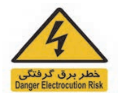
شکل ۴۱- تابلوی هشداردهنده

■ علائم راه‌ها: هر نوع علامت عمودی و افقی مانند تابلو، خط کشی، چراغ راهنمایی و رانندگی، نوشته و ترسیم و هم چنین تجهیزات هدایت کننده که به وسیله مقامات صلاحیت‌دار یا رانندگان برای کنترل و تنظیم عبور و مرور به کار می‌رود. در نمودار زیر انواع تابلوهای مورد استفاده در راهنمایی و رانندگی مشخص گردیده است.