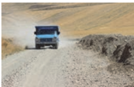
شکل ۲۶- نمونه‌هایی از راه روستایی

■ تقاطع: محدوده‌ای است که در آن دو یا چند مسیر به صورت هم‌سطح یا غیرهم‌سطح با یکدیگر تلاقی می‌کنند.