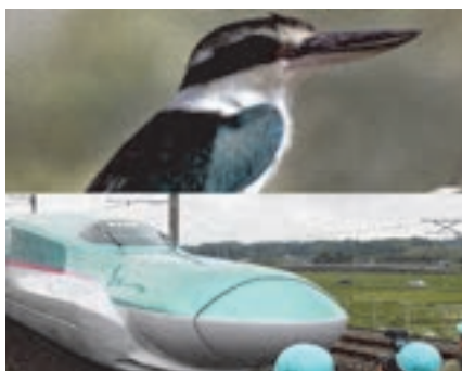
شکل ۱۰- الهام از مرغ ماهی‌خوار برای ساخت قطار سریع‌السیر

با الگوبرداری از منقار مرغ ماهی‌خوار برای طراحی قطار سریع‌السیر، آنها را با دماغه‌هایی بلند و منقار مانند طراحی کردند که این امر اجازه خروج با صدای کمتری از تونل‌ها را می‌دهند. (شکل ۱۰)