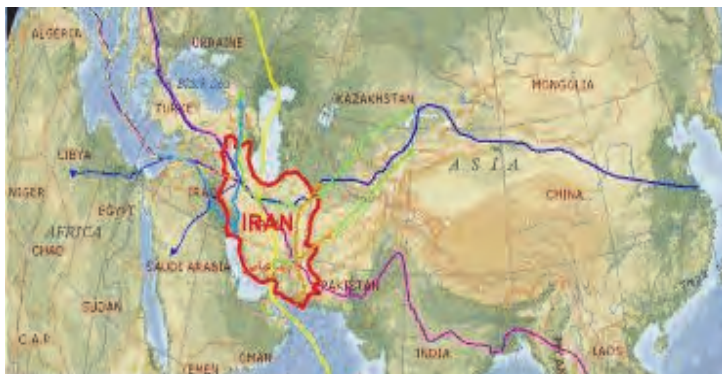
شکل ۵۲- راه‌گذرهای بین‌المللی عبوری از ایران

یکی از مزیت‌های تجاری، اقتصادی و منطقه‌ای ایران قرارگرفتن در میان ۱۱ کشور محصور در خشکی می‌باشد که این امر باعث ایجاد محوریت تجاری و ترانزیتی کالا، انرژی و حمل‌ونقل است. موقعیت جغرافیایی ایران به شکلی است که از شمال با کشورهای آسیای مرکزی و روسیه، از غرب با کشورهای عراق، ترکیه، لبنان و اروپا، از جنوب با کشورهای حاشیه خلیج فارس و اقیانوس هند و دریای عمان و از شرق با کشورهای افغانستان، پاکستان، هند و چین ارتباط جاده‌ای دارد. می‌توانید در نقشه زیر، نحوه ارتباط کشورهایمانند چین و هند با اروپا و همچنین کشورهای شمال ایران با اقیانوس‌ها از طریق ایران را مشاهده نمایید.