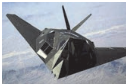
شکل ۸- الهام از جغد برای ساخت هواپیمای بی‌صدا

استفاده از الگوی کلونی مورچه‌ها جهت اداره ترافیک شهری و الهام از کرم خاکی در طراحی ماشین‌آلات حفاری تونل ۱ (TBM)