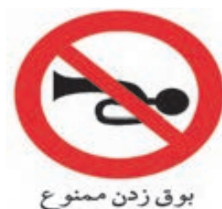
شکل ۴۲- تابلوی بازدارنده