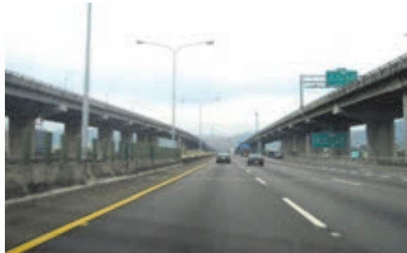
شکل ۳۷- آزادراه

■ راهگذر (کریدور): به محل تردد بین‌المللی با هریک از شیوه‌های حمل‌ونقلی جاده‌ای، دریایی، ریلی، هوایی یا ترکیبی کالا و مسافر گفته می‌شود که براساس موافقتنامه‌های بین‌المللی امضا شده بین کشورها تعیین شده باشد.