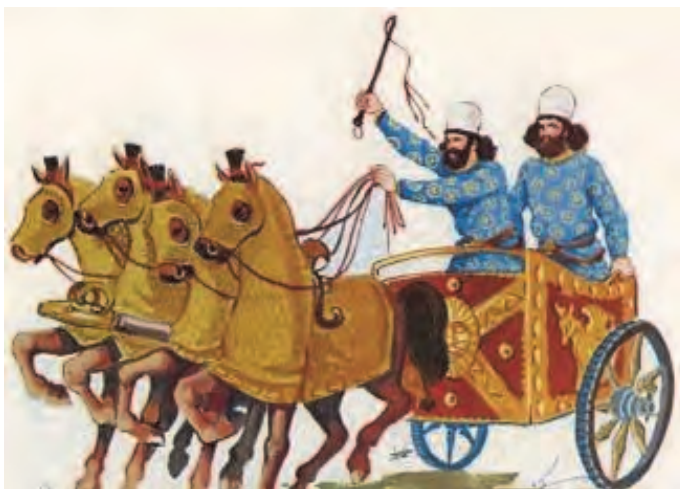
شکل ۲- چاپارها در دوران هخامنشی

آیا تاکنون اندیشیده‌اید که راه‌ها چرا به‌وجود آمدند؟ چگونه به‌وجود آمدند؟ اولین جاده‌های محکم و امروزی را رومی‌ها ساختند. آنها برای جابه‌جایی سربازان و افراد و حمل و نقل کالا از جاده‌ها استفاده می‌کردند و به تدریج تشکیلات مرتبی برای حمل و نقل بار و مسافر ایجاد کردند. در ایران طی سال‌های ۴۰۰ تا ۵۰۰ قبل از میلاد، شبکه‌ای از راه‌ها به‌وجود آمدند و پایتخت ایران با تمام ایالت‌ها ارتباط پیدا می‌کرد. در زمان‌های بسیار قدیم در کشور، چاپارها (نامه بر - پیک) در سراسر کشور فرامین، پیام و دستورات حکومتی را از نقطه‌ای به نقطه دیگر کشور می‌فرستادند (شکل ۲).