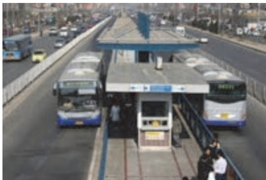
شکل ۲۸- خط ویژه اتوبوس

■ پیاده رو: قسمتی از خیابان که در امتداد آن واقع شده و برای عبور و مرور افراد پیاده اختصاص یافته است.