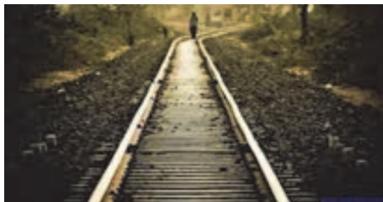
شکل ۲۵- خطوط راه آهن

■ راه روستایی: راه‌های معمولاً غیر آسفالتی (با روکش شنی) که ارتباط بین روستاها را فراهم می‌آورد.