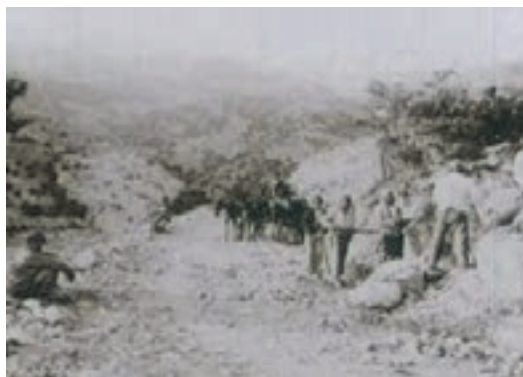
شکل ۵- جاده ابریشم

این مسیر تا سده شانزدهم، تقریباً به مدت ۱۷۰۰ سال از اعتبار تجاری و بازرگانی برخوردار بوده است. در دهه‌های آخر قرن بیستم با توسعه و تکمیل کامیون‌های بار و تجاری شدن عملیات حمل‌ونقل جاده‌ای، حیات جدیدی در تجارت زمینی ایجاد شد و بار دیگر توسعه تجارت زمینی آسیا - اروپا در دستور کار کشورها قرار گرفت. بخش عمده‌ای از مسیر راه ابریشم از قلمرو ایران عبور می‌کند.