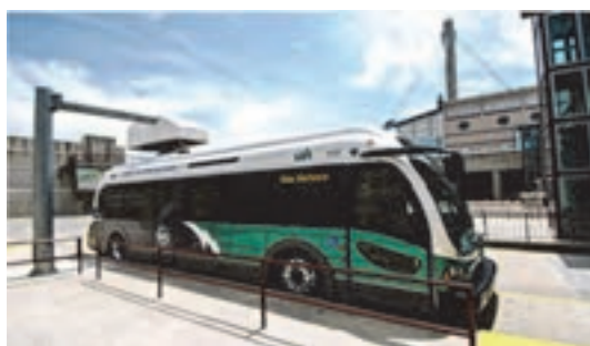
شکل ۱۶- اتوبوس برقی

وسایل نقلیه مسافری ممکن است برقی باشند. مانند اتوبوس های برقی. وسایل نقلیه برقی بیشتر در شهرها و برای کاهش آلودگی استفاده می شوند.