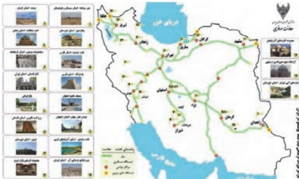
شکل ۱۲- گردشگری ریلی در ایران

■ گردشگری: مسافرت از محل زندگی به نقطه‌ای دیگر به منظور تفریح و سیاحت است.