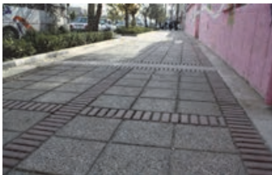
شکل ۲۹- پیاده رو

■ پیاده رو: قسمتی از خیابان که در امتداد آن واقع شده و برای عبور و مرور افراد پیاده اختصاص یافته است.