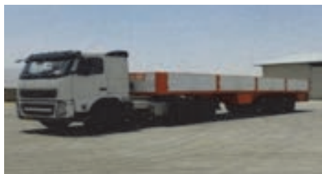
شکل ۱۸- کامیون لبه‌دار

این وسایل نقلیه برای حمل بارها استفاده می‌شود. انواع آن شامل وانت‌ها با ظرفیت عموماً کمتر از ۳/۵ تن، کامیونت با ظرفیت حمل از ۳/۵ تن تا ۶ تن و کامیون‌ها با ظرفیت حمل ۶ تن بار و بیشتر است. کامیون‌ها انواع مختلفی مانند کفی، لبه‌دار، مسقف، یخچال‌دار، میکسر، بونکر و کمپرسی دارند.