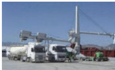
شکل ۲۰- تانکر