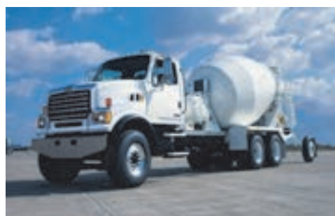
شکل ۲۱- میکسر

اما کامیون‌ها از نظر ظرفیت حمل بار به طور کلی به چهار دسته زیر تقسیم می‌شوند.