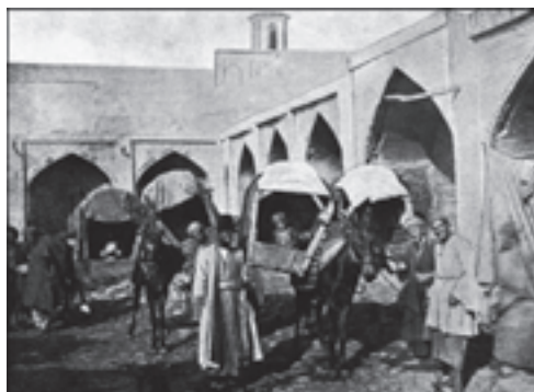
شکل ۴- نمایی از کاروانسرا و چاهارخانه

جاده ابریشم ۱ از جمله راه‌های مهمی بوده که از اهمیت تاریخی زیادی برخوردار است. همچنین به‌عنوان مهم‌ترین جاده در زمینه حمل‌ونقل کالا و مسافر و از قدیمی‌ترین مسیرهای مبادله‌ی کالای تجاری و دانش و فرهنگ بشری بوده و بین تمدن‌های یونانی و لاتین با آسیای شرقی، هندوستان و چین به مسافت ۱۲ هزار کیلومتری از روستای توان هوانگ چین تا شهر رم امتداد داشته است.