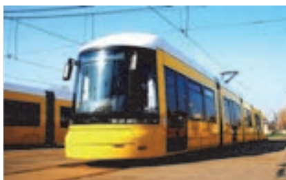
شکل ۱۵- انواع قطارهای شهری

وسایل نقلیه مسافری ممکن است برقی باشند. مانند اتوبوس های برقی. وسایل نقلیه برقی بیشتر در شهرها و برای کاهش آلودگی استفاده می شوند.