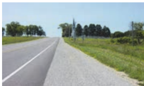
شکل ۳۹- نمونه‌هایی از شانه راه

■ علائم راه‌ها: هر نوع علامت عمودی و افقی مانند تابلو، خط کشی، چراغ راهنمایی و رانندگی، نوشته و ترسیم و هم چنین تجهیزات هدایت کننده که به وسیله مقامات صلاحیت‌دار یا رانندگان برای کنترل و تنظیم عبور و مرور به کار می‌رود. در نمودار زیر انواع تابلوهای مورد استفاده در راهنمایی و رانندگی مشخص گردیده است.