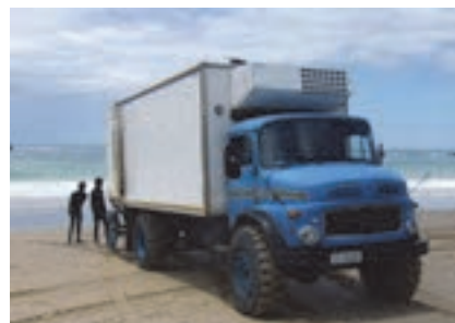
شکل ۱۹- کامیون یخچال‌دار