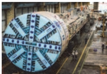
شکل ۹- الهام از کرم خاکی برای ساخت دستگاه حفار تونل