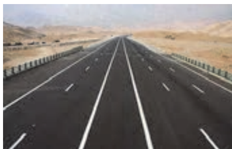
شکل ۵۰- وجود زیرساخت مناسب جاده‌ای و ریلی

بسیار ضروری است. بنابراین همه‌ی اجزای زنجیره‌ی محموله‌ها باید قابلیت ردیابی داشته باشد.