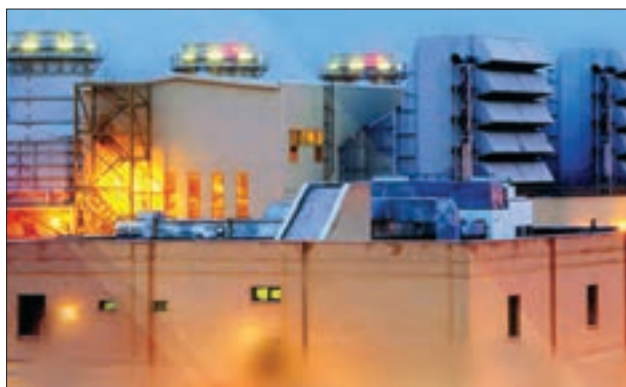
■ مجتمع تولیدی مپنا

از جمله عوامل شکل‌گیری این اقتصاد در طول تاریخ معاصر ایران، کشف نفت و سرمایه‌های حاصل از فروش نفت به خارجیان بوده است. اگرچه سرمایه‌های نفتی می‌تواند به انواع دارایی‌ها و ثروت‌ها مانند صنایع و کارخانجات تولیدی مختلف تبدیل شود؛ اما اگر به درستی استفاده نشود، می‌تواند اقتصادی وابسته ایجاد کند که رشد و افول آن، به قیمت و درآمد نفتی وابسته است. آیا درباره آثار نوسانات قیمت نفت بر یک اقتصاد وابسته چیزی می‌دانید؟ چنین اقتصادی از آن جهت که درآمد هنگفت و بدون زحمتی ایجاد می‌کند، باعث شکل‌گیری تولید ملی ضعیف و شکننده‌ای می‌شود که مستقیم و غیرمستقیم وابسته به نفت است؛ دولت بزرگی به وجود می‌آید که می‌کوشد رفاه اقتصادی را به مدد نفت و نه رواج کسب و کار، افزایش دهد و حتی هزینه‌های آموزش و بهداشت را - که در بیشتر نقاط دنیا از محل مالیات‌ها پرداخت می‌شود - به کمک درآمدهای نفتی تأمین کند.