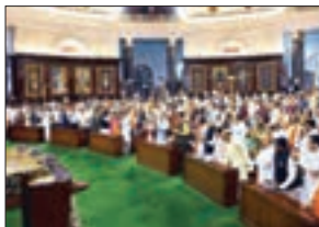
■ پارلمان هند