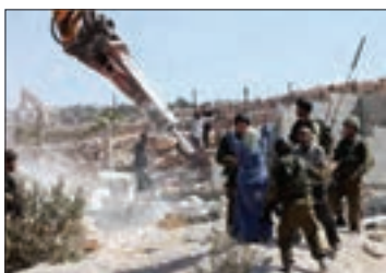
■ اجرای طرح‌های توسعه طلبانه رژیم اشغالگر قدس و تلاش برای تغییر ترکیب جمعیتی سرزمین‌های اشغالی

رژیم اشغالگر قدس برای تغییر ترکیب جمعیتی سرزمین‌های اشغالی و بیشتر شدن تعداد یهودیان نسبت به مسلمانان و اجرای طرح‌های توسعه طلبانه خود، ضمن حذف فیزیکی اعراب مسلمان و آواره کردن آنها به جذب مهاجران یهودی از سراسر دنیا و کوچ دادن آنها به سرزمین‌های اشغالی اقدام می‌کند.