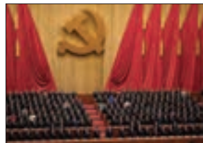
■ حزب کمونیست چین