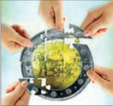
■ حضور فعال و مؤثر افراد جامعه در شکل‌گیری هویت اقتصادی

به آن دسته از فعالیت‌های روزمره که برای تهیه و تولید وسایل ضروری زندگی و رفح نیازهای مادی و معیشتی خود و دیگران انجام می‌دهیم، کنش اقتصادی می‌گویند. کنش‌های اقتصادی ما، بخشی از کنش‌های اجتماعی‌اند؛ زیرا در رابطه با دیگران صورت می‌گیرند. مجموعه