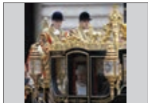
■ مشروطه سلطنتی انگلستان

گفته شد که جهان اجتماعی دارای هویت سیاسی است. جهان اجتماعی با پذیرش یک نظام سیاسی خاص، هویت سیاسی پیدا می کند. نظام های سیاسی انواع گوناگونی دارند. با چه ملاک هایی می توان نظام های سیاسی را دسته بندی کرد و چه انواعی برای نظام های سیاسی وجود دارد؟