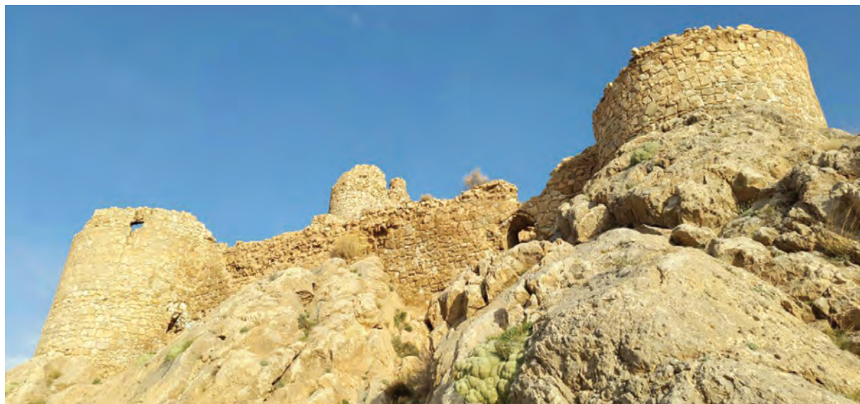
بقایای شیر قلعه شه‌میرزاد - استان سمنان

در سال‌های اخیر دانش باستان‌شناسی با بهره‌گیری از ابزارها و روش‌های مدرن، پیشرفت زیادی کرده است و نتایج تحقیقات آن علم، معیاری مناسب برای سنجش اعتبار اخبار تاریخی محسوب می‌شود. نتایج تحقیقات علمی باستان‌شناسان روی محوطه‌ها، بناها و آثار گوناگون تاریخی، به مورخان کمک می‌کند که اخبار و مندرجات کتاب‌های تاریخی را به دقت ارزیابی کنند.