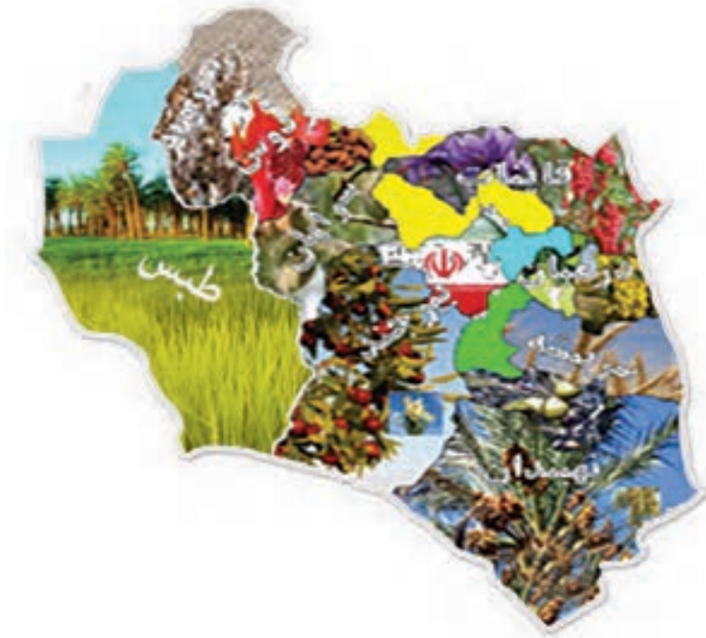
شکل ۲-۱۳- نقشه پراکندگی محصولات کشاورزی استان

استان ما دارای ۱۳۲۶۳۹ هکتار اراضی زیر کشت محصولات زراعی با تولید ۵۷۰۴۱۲ تن و ۴۶۸۸۸ هکتار سطح زیر کشت محصولات باغی با تولید ۶۱۸۹۳ تن است. همچنین از لحاظ دام، استان دارای ۳۴۱۹۳۷۷ واحد دامی می باشد که علاوه بر تولید نیاز استان، به سایر استان های همجوار نیز تولیدات آن ارسال می شود.