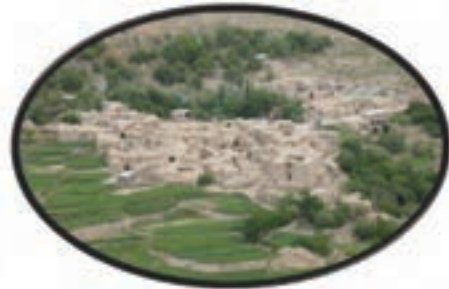
شکل ۱۵-۱۲- روستای آرک شهر خوسف

● منطقه نمونه گردشگری درخش و آسیابان (قهستان)، روستای هدف گردشگری در میان و فورگ در شهرستان در میان: این منطقه در شهرستان در میان در ۷۰ کیلومتر محور بیرجند - در میان - زیرکوه واقع شده است و یکی از قدیمی ترین نقاط استان خراسان جنوبی محسوب می شود. اهمیت آن بیشتر از لحاظ جاذبه های تاریخی و فرهنگی است؛ هرچند دارای مناطق بیلاقی با درختان و باغات سرسبز می باشد و روستاهای هدف گردشگری در میان و فورگ در مسیر جاده اسدیبه به سریشه و بیرجند واقع شده است.