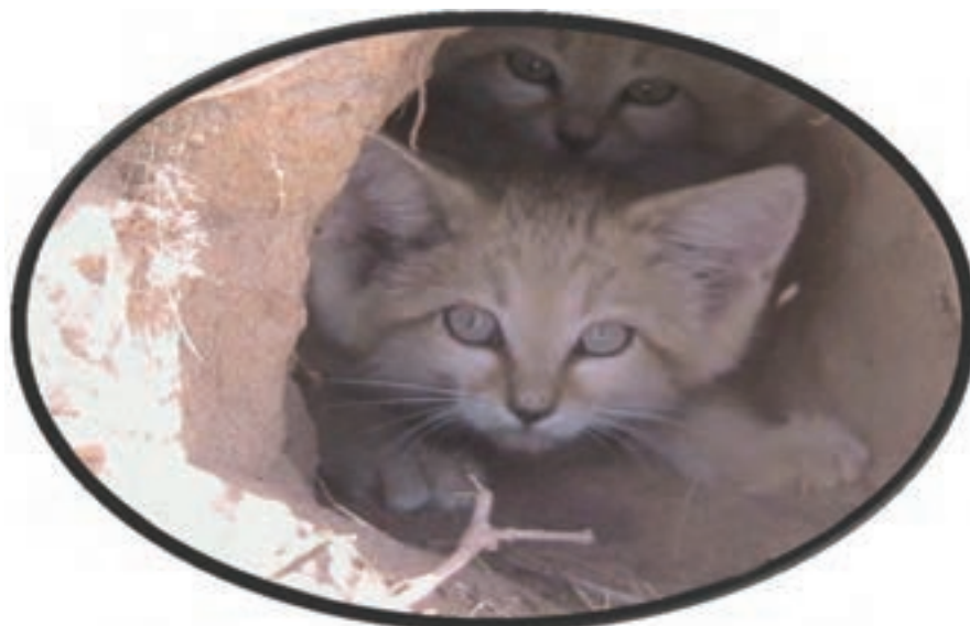
شکل ۲۵-۱۲- گربه شنی در حال انقراض شهرستان زیرکوه

● روستاهای هدف گردشگری چنشت و ماخونیک در سریشه: روستای هدف گردشگری چنشت در ۳۵ کیلومتری شهر مود واقع شده است و از نظر جاذبه‌های طبیعی و تاریخی - فرهنگی اهمیت خاصی دارد اما روستای ماخونیک در محور سریشه به دُرُح قرار دارد. و بیشتر از اهمیت تاریخی برخوردار است.