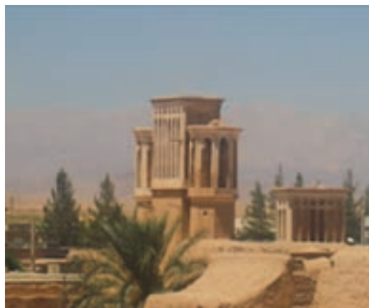
شکل ۳-۱۲- بادگیرهای بشرویه