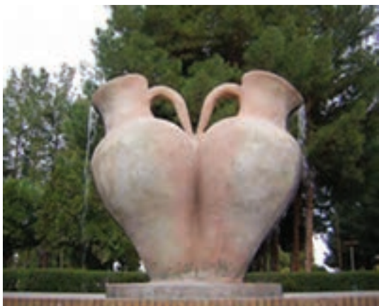
شکل ۴-۱۲- بوستان شهری بشرویه