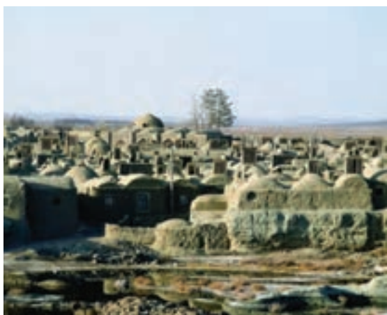
شکل ۱۴-۱۲- بافت تاریخی روستای خور شهر خوسف