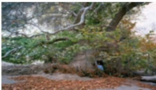
شکل ۱۹-۱۲- درخت هزار ساله دوشنگان