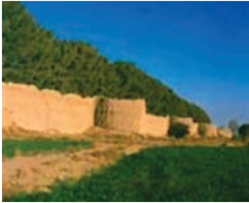
شکل ۲۸-۱۲- قلعه باغ شهرمود