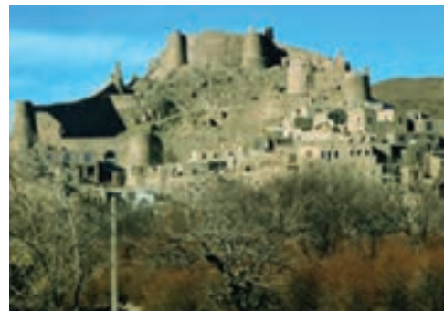
شکل ۱۷-۱۲- قلعه فورگ در میان