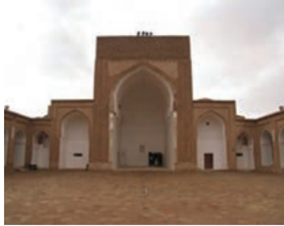
شکل ۳۴-۱۲- مسجد جامع فردوس

● منطقه نمونه گردشگری بوذرجمهر قاین : منطقه نمونه گردشگری بوذرجمهر با وسعتی حدود ۵۰۹ هکتار در ضلع شرقی شهر قاین واقع شده است که پیوند تنگاتنگی با پایتخت زعفران جهان و کانون شهری دیرینه و پایدار سرزمین قهستان و فرهنگ و تمدن کهن دارد.