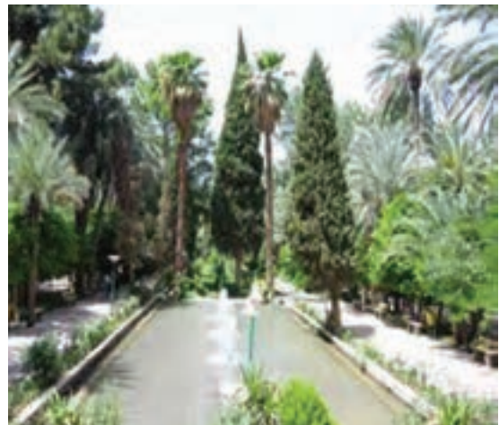
شکل ۲۹-۱۲- باغ گلشن