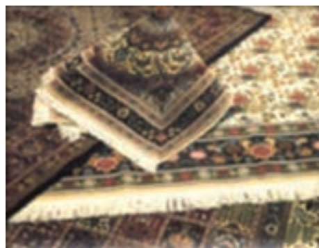
شکل ۶-۱۳- فرش مود

* کدام یک از صنایع دستی در شهرستان محل زندگی شما از رونق برخوردار است؟ چند مورد را نام ببرید. ب) بخش معدن: به جدول ۵-۱۳ توزیع پراکندگی معادن استان ما نگاه کنید. بگویید که بیشترین و کمترین معادن فعال استان در محدوده کدام شهرستان‌ها واقع شده است؟