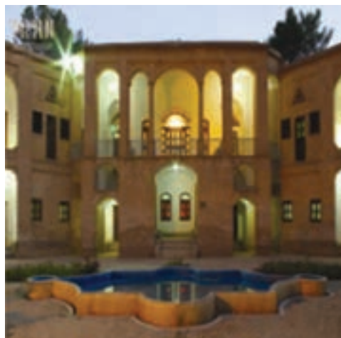
شکل ۱-۱۲- باغ موزه و عمارت اکبریّه بیرجند