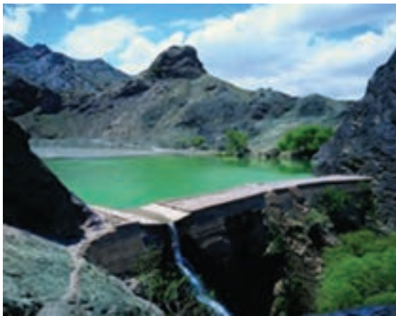
شکل ۸-۱۲- بنددره بیرجند