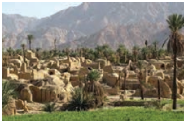
شکل ۳۱-۱۲- روستای اصفهک

● منطقه نمونه گردشگری تون و باغستان - آبگرم فردوس : شهر تاریخی و قدیمی تون در جنوب شهر فردوس با وسعتی حدود ۱۸ هکتار واقع شده است که مجموعه‌ای از جاذبه‌های تاریخی و فرهنگی را تشکیل می‌دهد؛ اما منطقه نمونه گردشگری باغستان آبگرم بیشتر از جاذبه‌های طبیعی برخوردار است.