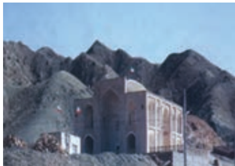
شکل ۱۸-۱۲- امامزاده سلطان ابراهیم رضا