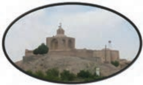
شکل ۱۶-۱۲- آرامگاه ابن حسام در شهر خوسف