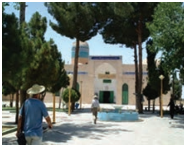
شکل ۳۲-۱۲- امامزادگان سلطان محمد و سلطان ابراهیم