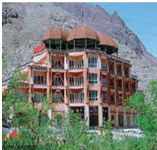
شکل ۱۱-۱۲- هتل کوهستان بند عمرشاه (امیرشاه) بیرجند