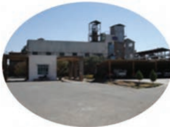
شکل ۵-۱۳- توانمندی‌های اقتصادی در بخش صنعت