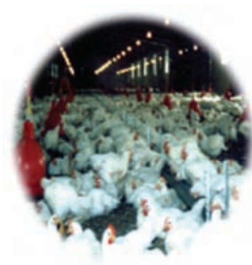
شکل ۴-۱۳- توانمندی‌های اقتصادی در بخش پرورش دام و طیور