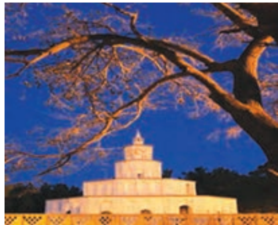
شکل ۷-۱۲- ارگ کلاه فرنگی بیرجند