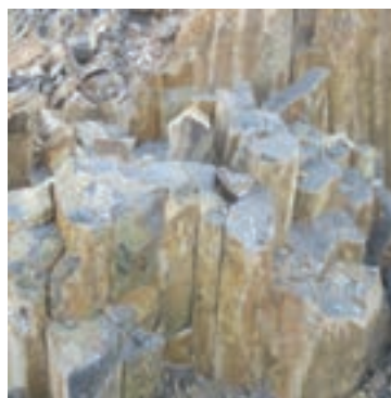
شکل ۷-۱۳- توانمندی های اقتصادی در بخش معدن