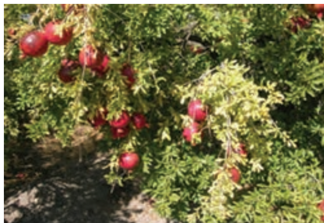
شکل ۳-۱۳- باغات انار در استان خراسان جنوبی

پ) دامپروری : علی‌رغم شرایط نامناسب اقلیمی، بیش از ۱۵۱۵۳ خانوار عشایری در استان به فعالیت‌های دامی مشغول‌اند. علاوه بر آن در بخش دامپروری، پرورش مرغ گوشتی و تخم‌گذار، گاو شیری و گوشتی، گوسفند، بز و شتر به صورت سنتی و صنعتی انجام می‌پذیرد.