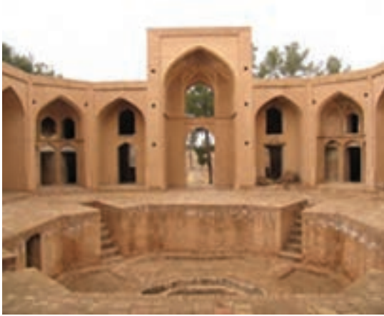
شکل ۳۵-۱۲- مدرسه علیای فردوس