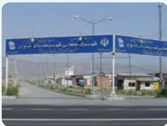
شکل ۴-۶- شهرک صنعتی خوی

صنعتی استان از نظر ایجاد اشتغال شهرک صنعتی خوی است. این شهرک با وسعت ۲۲۱/۸۳ هکتار در ۱۵ کیلومتر ۱۵ خوی - سلماس قرار دارد. تعداد واحدهای به بهره‌برداری رسیده این شهرک ۱۰۵ واحد و میزان اشتغال ۲۱۰۲ نفر است. نزدیکی به نیروگاه سیکل ترکیبی، فرودگاه خوی و شبکه راه آهن سراسری در سال‌های اخیر در توسعه آن نقش مهمی ایفا کرده است.