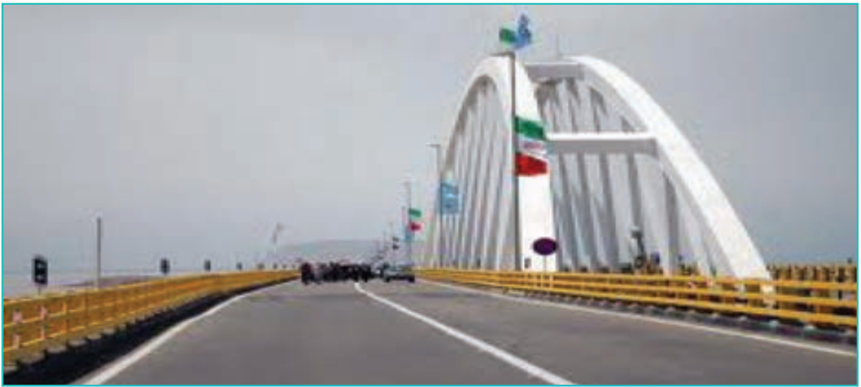
شکل ۶-۶- پل میان گذر دریاچه ارومیه