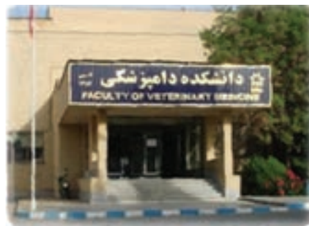
شکل ۷-۶- دانشگاه‌های ارومیه