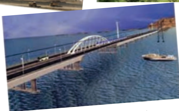
شکل ۱-۶- بخش‌های دستاوردهای انقلاب اسلامی