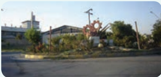
شکل ۳-۶- شهرک صنعتی شماره یک ارومیه

شهرک صنعتی شماره یک ارومیه، در ۷ کیلومتر ۷ جاده ارومیه در بزرگراه شهید کلاتری قرار دارد. مساحت این شهرک ۳۴/۵۳ هکتار و تعداد واحدهای بهره‌برداری رسیده آن ۷۹ واحد و میزان اشتغال در این شهرک ۴۴۹۴ نفر است. افتتاح میان‌گذر دریاچه ارومیه و دسترسی به بزرگراه شهید کلاتری بر اهمیت این شهرک در سال‌های اخیر افزوده است.