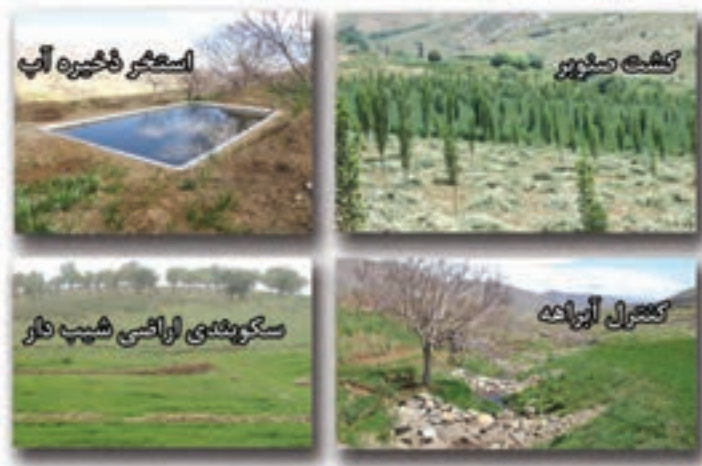
شکل ۵-۶- مهم ترین دستاوردهای بخش منابع طبیعی