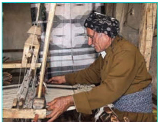
شکل ۵۸-۵- صنایع نساجی سنتی استان