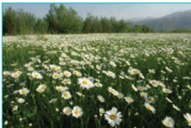
شکل ۵۲-۵ دشت های پرگل