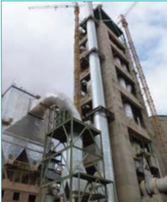
شکل ۵۳-۵- کارخانه سیمان

صنایع تولید مواد غذایی و آشامیدنی پس از صنایع فرآوری و تبدیلی معدنی دومین تخصص صنعتی استان در سال ۱۳۸۵ بود و ۲۱/۶ درصد از کل صنایع استان را شامل می‌شد.