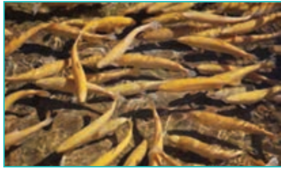
شکل ۴۷-۵- پرورش ماهی