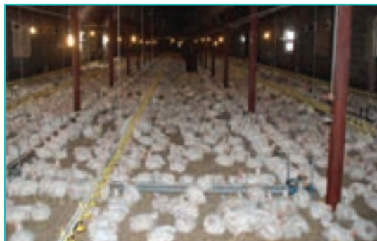
شکل ۵۰-۵ مرغداری صنعتی