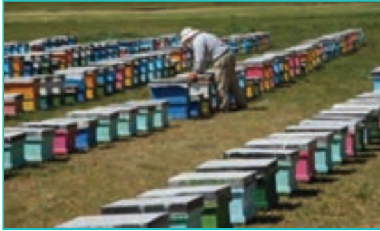
شکل ۴۸-۵- پرورش زنبور عسل