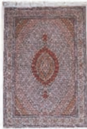
نام طرح: ماهی نام نقشه: شکارگاه ابعاد: ۶×۴ ۲.۵×۵ ۲.۵×۳.۵ ۲×۳ ۱×۱.۵ ۱.۵×۲ بافت: ارومیه - خوی - سلماس - ماکو - چالدران - پلدشت