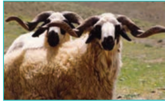
شکل ۴۹-۵- پرورش دام