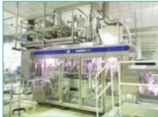
شکل ۵۴-۵- کارخانه شیر باستوریزه

آیا می‌توانید صنایع تبدیلی کشاورزی استان محل زندگی خود را نام ببرید؟