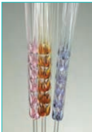
شکل ۶۴-۵- شیشه‌گری

۴- معرق چوب: این هنر ۴۰ سال پیش به شهرستان ارومیه راه پیدا کرد و با منبت تلفیق شد و رشته جدیدی به نام معرق - منبت یا معرق برجسته بوجود آمد.