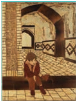
شکل ۶۳-۵- معرق چوب

۴- معرق چوب: این هنر ۴۰ سال پیش به شهرستان ارومیه راه پیدا کرد و با منبت تلفیق شد و رشته جدیدی به نام معرق - منبت یا معرق برجسته بوجود آمد.