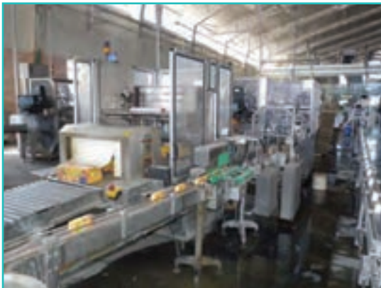
شکل ۵۵-۵- کارخانه آب میوه‌گیری