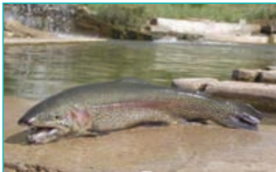
شکل ۵۱-۵ پرورش ماهی