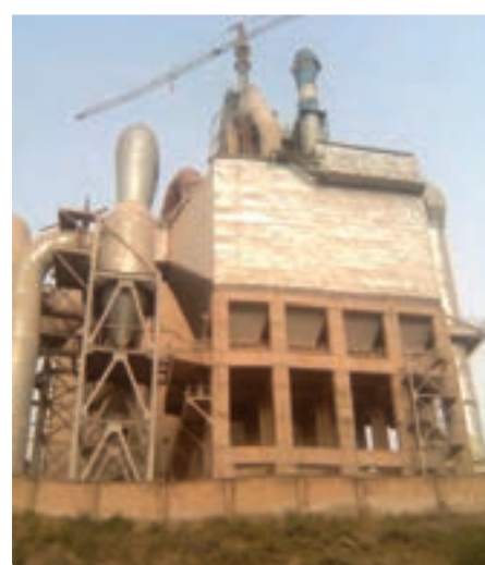
شکل ۲۶-۵- کارخانه سیمان لوشان

در توسعه بخش صنعت استان، اصلی‌ترین قابلیت‌های توسعه عبارت‌اند از: - بالابودن سطح سواد، آگاهی و فرهنگ عمومی، و وجود نیروهای تحصیل کرده و دارای تخصص بالا - وجود مواد معدنی و مواد اولیه مورد نیاز برخی از صنایع در محل - برخورداری از امکانات متنوع تولید و توانایی به کارگیری انرژی‌های نوین تجدیدپذیر برای تأمین برق.