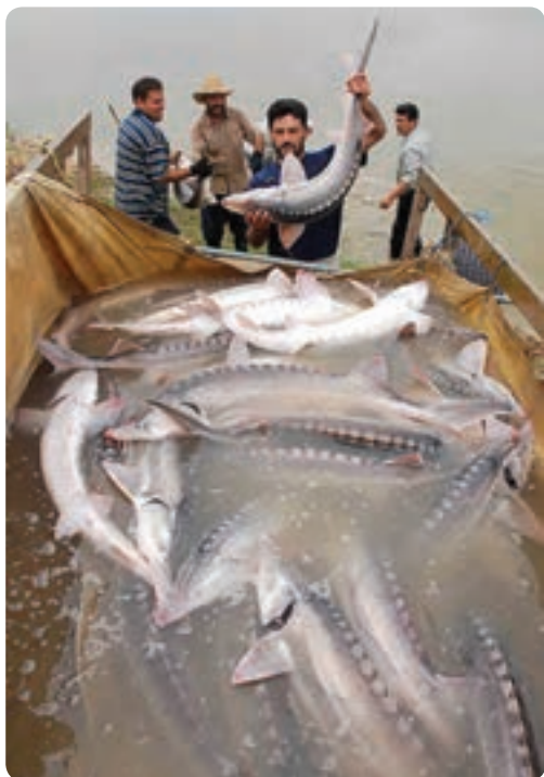
شکل ۲۴-۵- رهاسازی ماهیان خاویاری