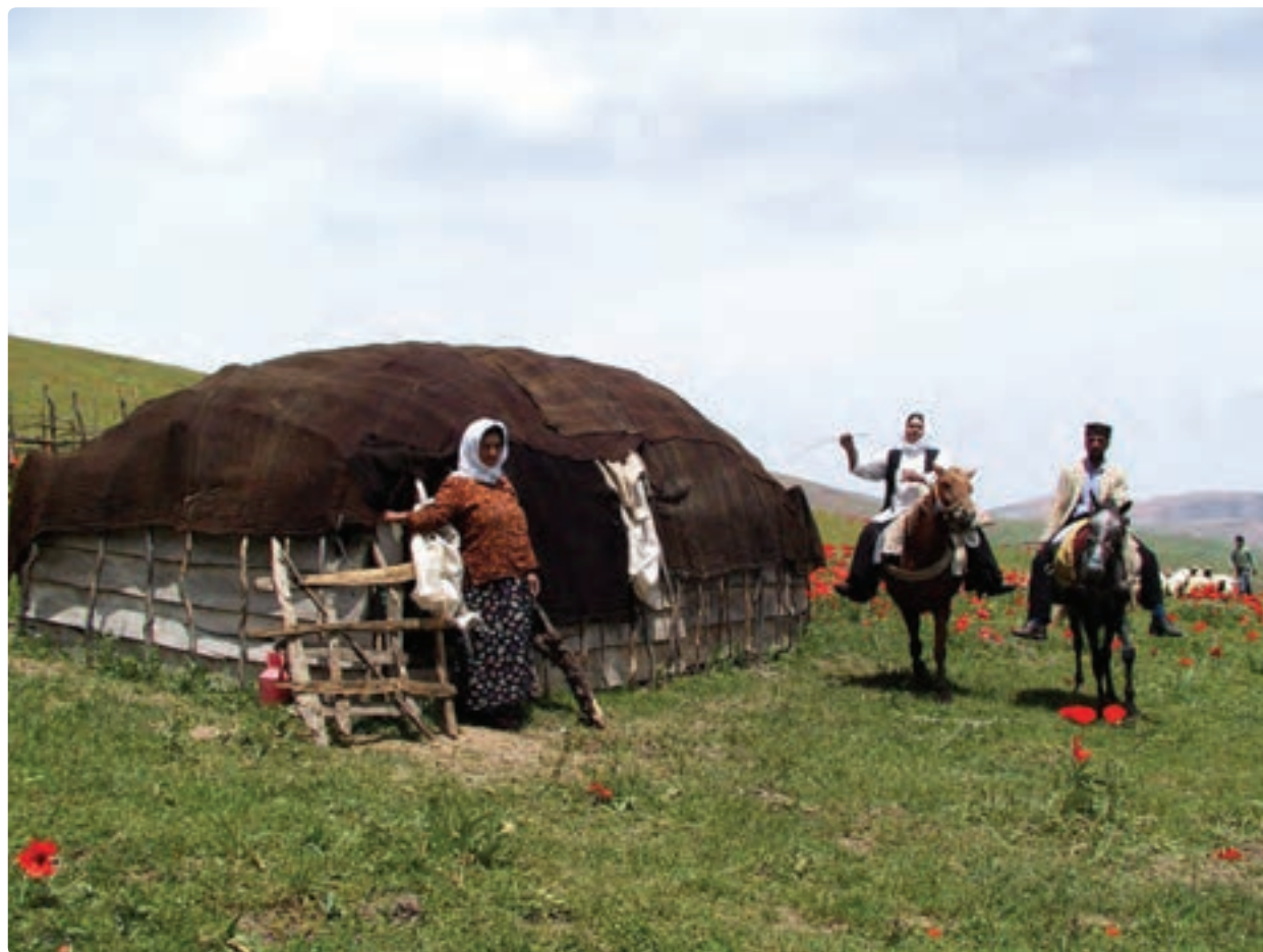
شکل ۱۷-۵- دامداران گیلانی در شکردهشت