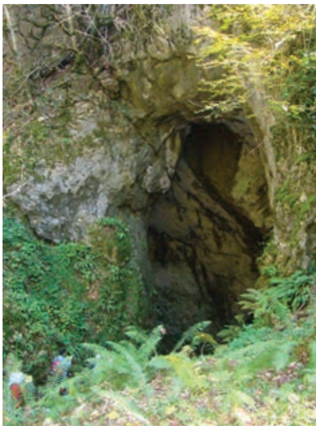
شکل ۷-۵- غار آویشو - شاندرمن

۲- جاذبه‌های تاریخی و یادمانی: قدیمی‌ترین بناهای تاریخی و یادمانی گیلان در کوهپایه‌ها و مناطق کوهستانی است و آثار مربوط به پیش از ورود آریایی‌ها مثل تپه‌های مارلیک در حوالی روستای نصفی رحمت‌آباد رودبار و مسکن ماقبل تاریخ مریان در روستای مریان کرگانرود تالش از نظر تاریخی اهمیت ویژه‌ای دارند.