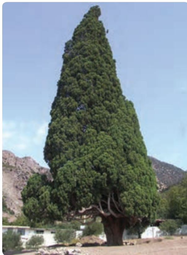
شکل ۱۴-۵-الف- سرو هزارساله هرزویل در رودبار