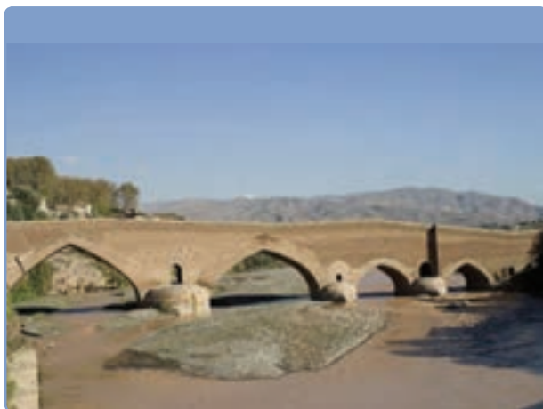
شکل ۱۲-۵- پل تاریخی لوشان (تنها پل ارتباطی به قسمت‌های داخلی کشور)