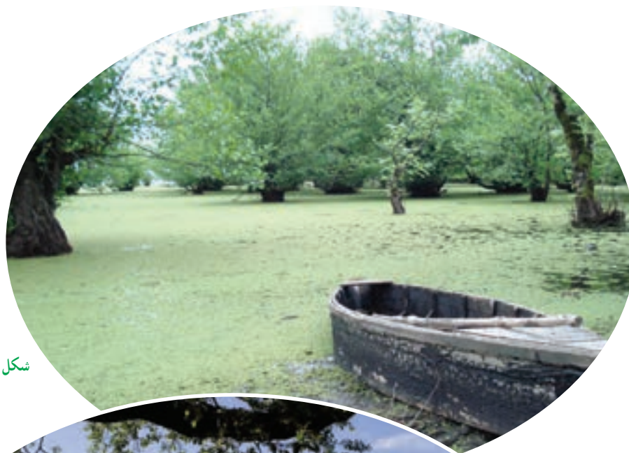
شکل ۲-۵- تالاب استیل آستارا