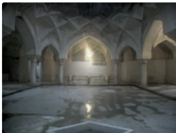
شکل ۱۱-۵- حمام گلشن لاهیجان