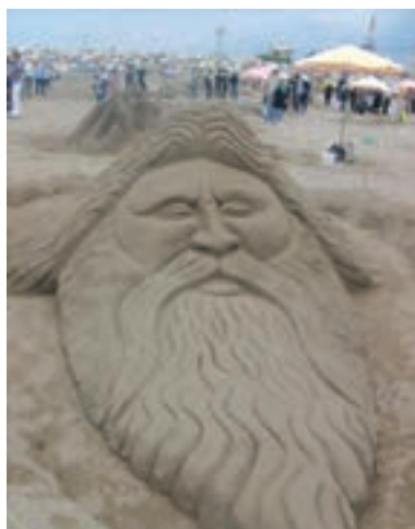
شکل ۱-۵-ج - جشنواره مجسمه‌های شنی در سواحل گیلان

استان گیلان یکی از مراکز مهم گردشگری در ایران است. این استان دارای امتیازهای قابل توجهی برای جذب گردشگر است که به چند مورد آن اشاره می‌شود. از جمله: آب و هوای مناسب، تنوع ناهمواری و پوشش گیاهی، تنوع چشم‌اندازهای انسانی و موقعیت نسبی مناسب برای جذب گردشگران داخلی و خارجی.