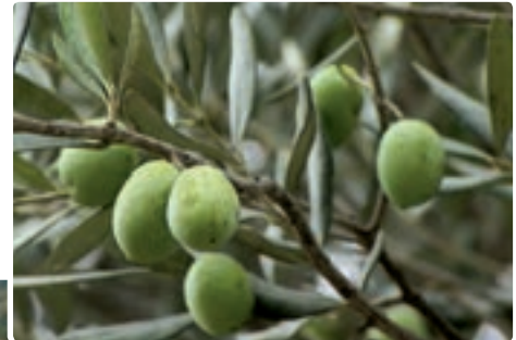
شکل ۲۰-۵-الف - محصول زیتون

مهم ترین کانون فعالیت های کشاورزی استان، مناطق پست جلگه ای است. زمین های کوهپایه ای به پوشش جنگلی و در برخی مناطق محصولات باغی اختصاص دارد کشت برخی از محصولات خاص زمین های جلگه ای مانند برنج در امتداد درّه ها بر روی تراس های رودخانه ای تا جایی که وسعت زمین و شرایط رویش اجازه دهد، در نواحی کوهپایه ای نیز معمول است. درّه سفیدرود از رستم آباد تا حوالی منجیل و لوشان به کشت زیتون اختصاص دارد.