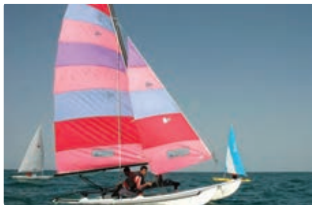
شکل ۱-۵-ب - قایقرانی