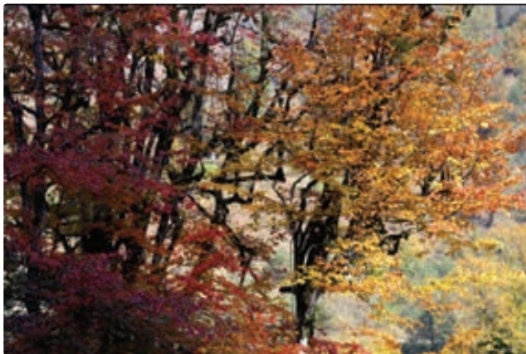
شکل ۵-۶- پاییز جنگل‌های ماسال

از جاذبه‌های طبیعی شهرستان محلّ زندگی خود گزارشی تهیه و در کلاس ارائه دهید.