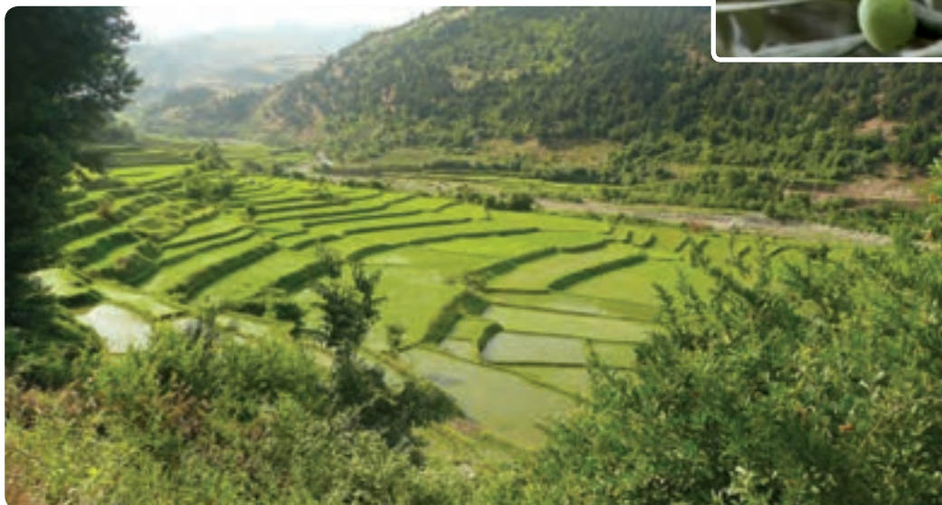
شکل ۲۰-۵-ب - تراس بندی زمین برای کشت برنج در نواحی کوهپایه ای