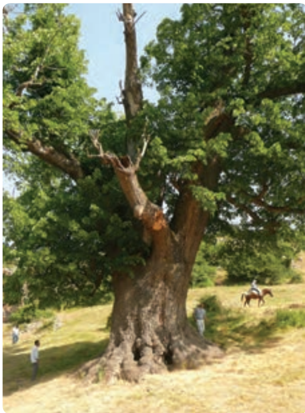
شکل ۱۴-۵-ب- درختی کهنسال و غول پیکر در ارتفاعات رودبار