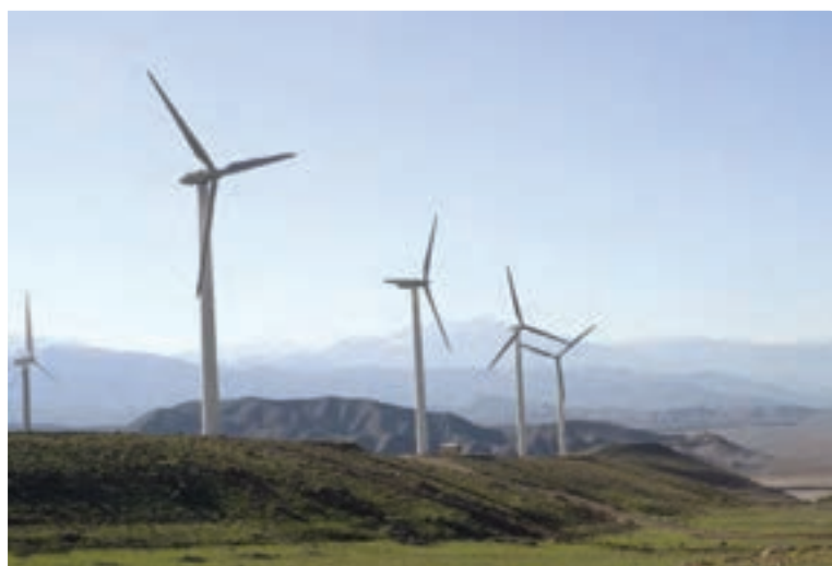
شکل ۲۷-۵- نیروگاه برق بادی منجیل