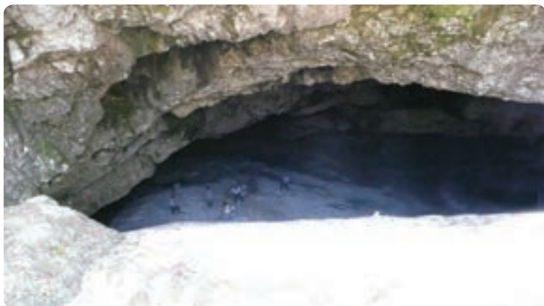
شکل ۵-۵- بر فچال در کوه دلفک

پ) رودها: بستر رودهای گیلان عموماً در مسیر دره‌های کوهستانی که از جنگل‌های سرسبز و انبوه پوشیده شده‌اند، قرار دارد. این رودها از نظر ماهیگیری و صید قزل‌آلا اهمیت داشته، به دلیل جریان تند خود برای قایقرانی قابلیت دارند. ت) کوهستان‌ها و نواحی ییلاقی: نواحی ییلاقی گیلان به دلیل تلفیق جنگل، مرتع و رودهای جاری در آن از ییلاق‌های سایر قسمت‌های کشور ما متمایزند و علاوه بر آب و هوای مطبوع دارای چشمه‌های آب معدنی و قابل دسترسی هستند.