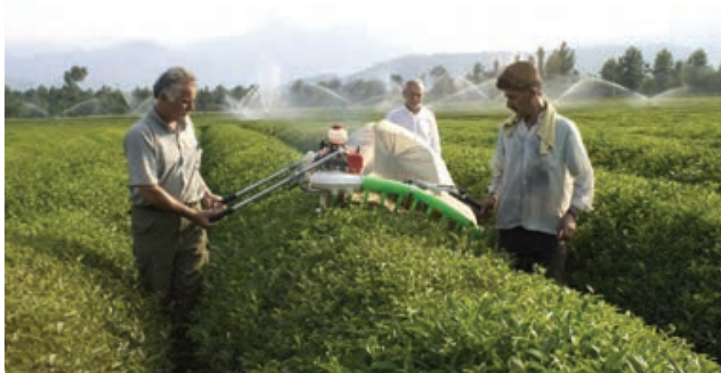
شکل ۲۵-۵- کشاورزی مدرن (مکانیزه)