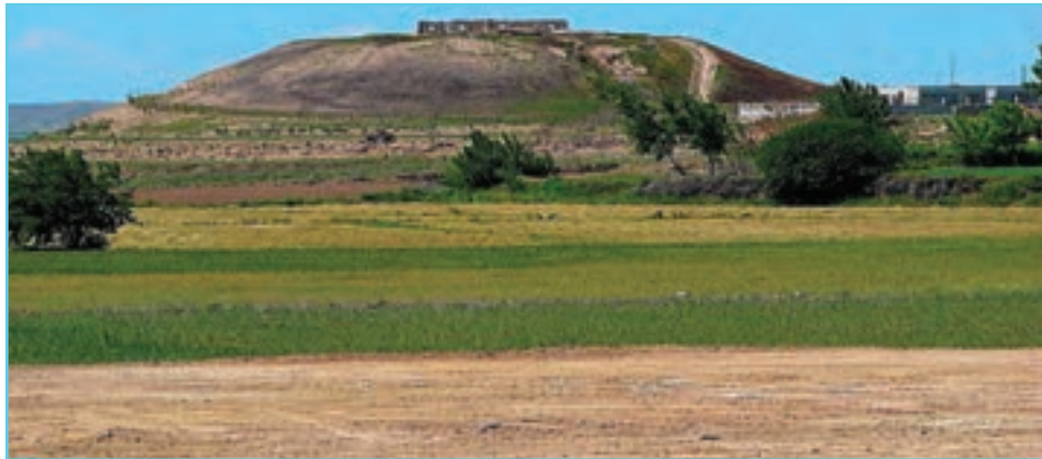
شکل ۹-۴- تپه نادری در اصلاندوز

اردبیل در دوره صفوی از لحاظ سیاسی و اقتصادی سرآمد شهرهای ایران بود. در آغاز دوره قاجار عباس میرزا نایب السلطنه فتحعلی شاه قاجار مرکز ستاد سپاهیان خود را در اردبیل قرار داد و به کمک افسران فرانسوی قلعه‌ای در برابر هجوم قوای روسیه بنا کرد که بعدها تبدیل به زندان شد. آیا شما نام آن قلعه را می‌دانید؟ در جنگ ایران و روسیه در ۱۲۱۸ هـ. ق قوای روس به اردبیل حمله کرد و تا تنظیم عهدنامه ترکمنچای این شهر در اشغال بیگانه بود. در زمان اشغال همه اشیای قیمتی و بی‌همتای مقبره شیخ صفی‌الدین و زینت آلات دیگر مقبره‌ها و کتاب‌های مهم کتابخانه اردبیل که شاه عباس وقف کرده بود و از کتاب‌های خطی نفیس و بی‌نظیر و بی‌همتا بود غارت شد. پس از ولیعهد نشین شدن تبریز در دوره قاجار اردبیل از رونق افتاد، ولی مردم استان اردبیل در تحولات مهم بعدی از جمله مشروطیت و حوادث بعد از شهریور ۱۳۲۰ هـ. ش، ملی شدن صنعت نفت، وقوع انقلاب اسلامی، دوران جنگ و سازندگی همپای مردم آذربایجان و ایران اسلامی در حفظ هویت ایرانی - اسلامی تلاش زیادی کرده‌اند. مغان بخش شمالی استان که سابقاً موغا یا مغان یا موقان نام داشته با داشتن مناطقی مانند باجروان، ورتان، برزند و اولتان و... سابقه تاریخی بسیار طولانی دارد.