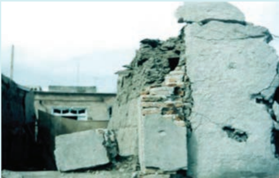
شکل ۱۷-۴- بمباران اردبیل

دربارهٔ بمباران هوایی اردبیل تحقیق کرده و برای همکلاسی هایتان توضیح دهید.