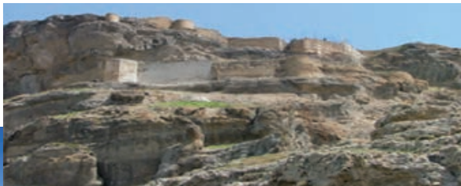
شکل ۱۰-۴- قلعه قهقهه در مشکین شهر