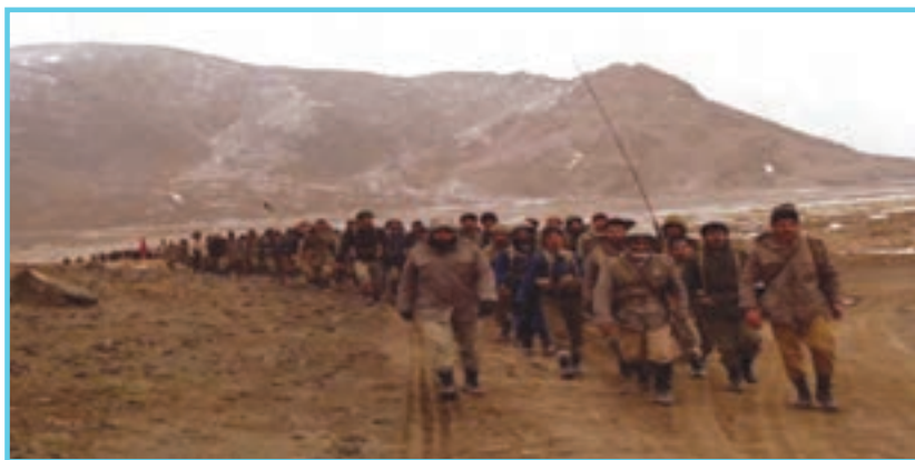
شکل ۱۴-۴- رزمندگان اسلام در جبهه

در طول ۸ سال دفاع مقدس مردم غیرتمند اردبیل در تمامی مراحل جنگ حضور فعال داشتند. از ابتدا تا پایان دفاع مقدس با اعزام ده‌ها هزار نیرو به جبهه‌های نبرد و شرکت در عملیات‌های مختلف حضور مؤثر داشتند. سپاه اردبیل از فعال‌ترین یگان‌ها در طول هشت سال دفاع مقدس بود که در حدود ۳۵۰۰۰ نفر نیرو به جبهه اعزام کرد. دومین یگان