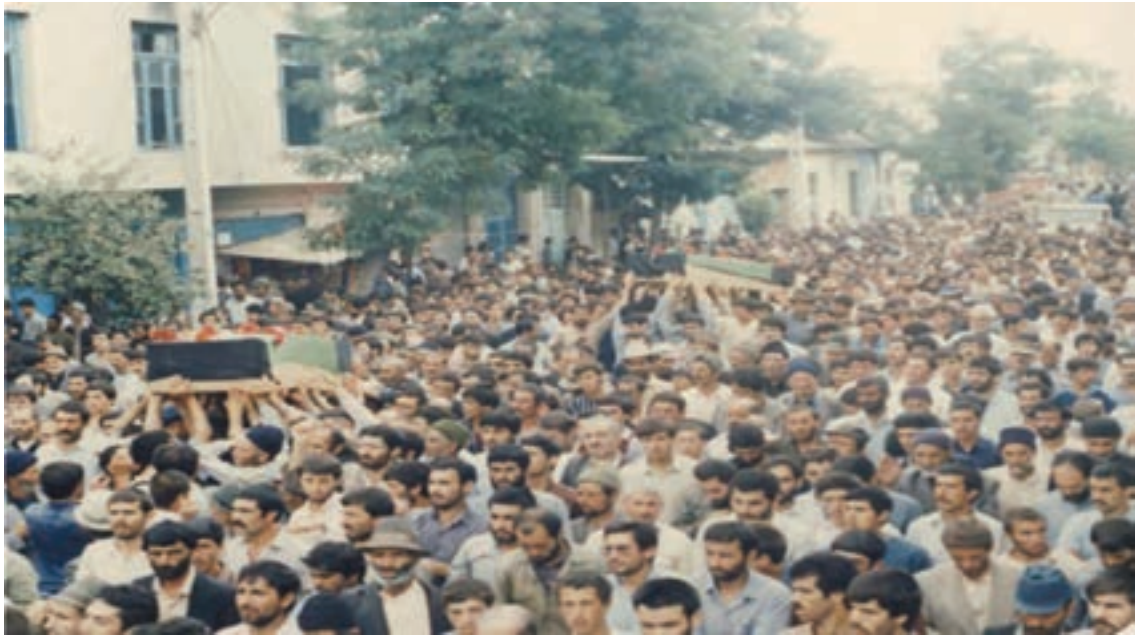
شکل ۱۶-۴- تشییع بیکر شهیدا