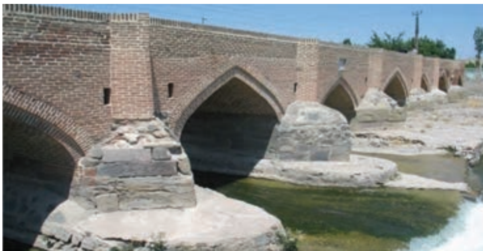
شکل ۸-۴- پل هفت چشمه اردبیل از دوره صفویه