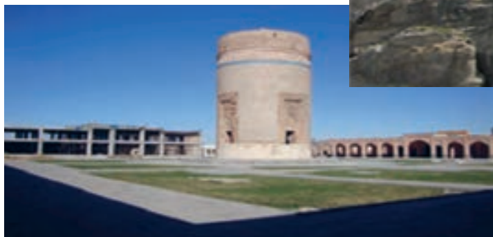
شکل ۱۱-۴- بقعه شیخ حیدر مشکین شهر

خیابان در دوره صفویه رونق بیشتری داشته است. در زمان شیخ حیدر که حاکم و والی این شهر بوده به دلیل تلاش وی برای رونق و آبادانی آن اهمیتی فوق العاده یافت. در دوره قاجار به ویژه در جنگ های ایران و روسیه این شهر از مراکز بسیار مهم برای استقرار سپاه عباس میرزای ولیعهد بوده است. در سال ۱۲۷۵ ه. ق. لشکریان روس پس از جنگ سختی با توپ و تفنگ و تجهیزات کامل شهر را به مدت ۶ ماه محاصره کرده و پس از سرکوب ایلات شاهسون که به شدت مقاومت می کردند، اموال مردم به عنوان غرامت توسط روس ها به یغما رفت.