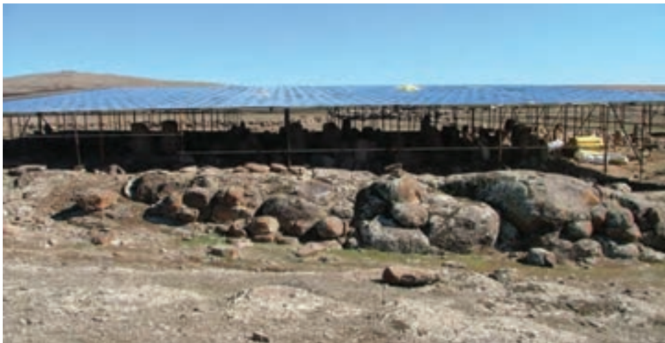
شکل ۱-۴- شهر یری در مشکین شهر مربوط به دوره پیش از تاریخ

با توجه به مدارک موجود باستان‌شناسی، می‌توان گفت منطقه اردبیل حداقل از هزاره ششم قبل از میلاد مسکون بوده است؛ چرا که سراسر منطقه از تپه‌های باستانی یا به عبارت دیگر مناطق استقراری که روزگاری دژ یا شهرک یا روستا بودند پوشیده شده است مانند شهر یری در مشکین شهر، قلعه اولتان در پارس آباد و بوینی یوغون (دژ بهمن) در نیر.