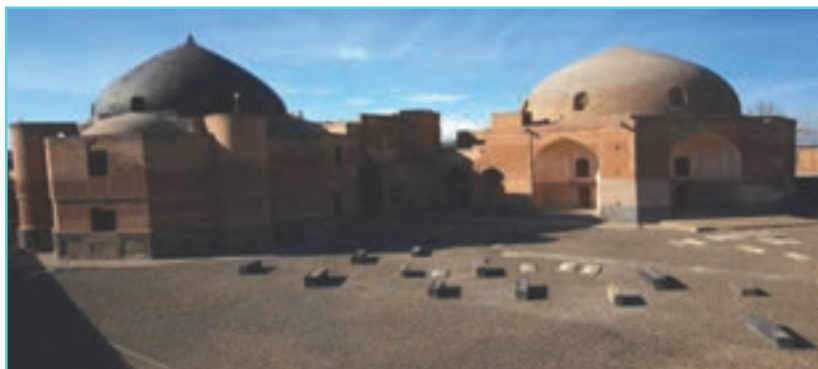
شکل ۴-۵- خانقاه شیخ صفی‌الدین در اردبیل

در دوره ایلخانان به دلیل رشد و گسترش تصوف، خانقاه‌های زیادی در نواحی مختلف ایران بنا شدند که مهم‌ترین آنها خانقاه شیخ صفی‌الدین در اردبیل بود. بزرگی مقام شیخ صفی‌الدین در عرفان باعث شد که اردبیل کعبه آمل و قبله صوفیان شود. علاوه بر مردم، حاکمان و بزرگان نیز احترام خاصی به شیخ صفی‌الدین و فرزندان آنها می‌گذاشتند، به طوری که معروف است امیر تیمور لنگ در ملاقات با شیخ خواجه علی در اردبیل هزاران اسیر عثمانی را به درخواست ایشان آزاد کرد.