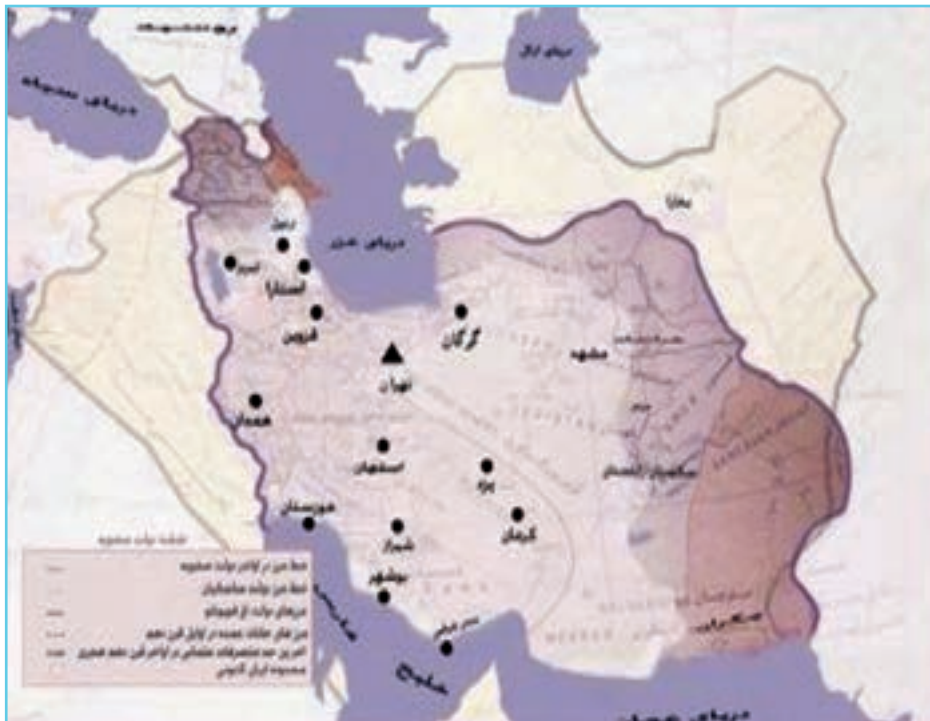
شکل ۴-۶- نقشه ایران در دوره صفویه که در آن ایران به‌عنوان خاستگاه مذهب تشیع در جهان مطرح شد.

شاه اسماعیل نواده شیخ صفی برای تشکیل حکومت واحد ایرانی از اردبیل قیام کرد و همه ولایات را مطیع خود ساخت. شورش‌ها را خواباند و ملوک الطوائفی را از بین برد. نخستین اقدام او رسمی کردن مذهب شیعه در ایران بود. بنابراین، اردبیل خاستگاه مذهب شیعه و تشکیل دولت ملی در ایران به شمار می‌رود.