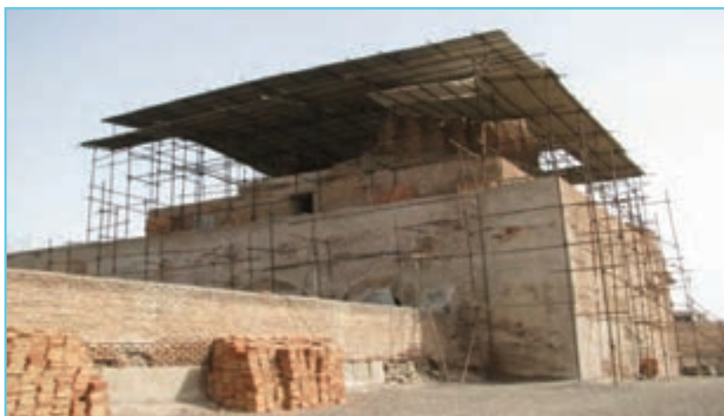
شکل ۴-۴- مسجد جمعه اردبیل یادگاری از دوره سلجوقیان

استان اردبیل امروزی به سبب موقعیت خاص خود، همواره در معرض تهاجم کوه‌نشینان قفقاز و اقوام دشت‌های جنوبی روسیه بوده است. چنانکه ترکان خزر و گرجیان بارها از دربند‌های قفقاز به دشت‌های اردبیل تاختند. با حضور ترکان سلجوقی در ایران، منطقه ما نیز در قلمرو آنها قرار گرفت و فرهنگ ترکان در میان مردم استان گسترش یافت. اردبیل در زمان حمله مغول نیز مرکز حکومت آذربایجان بود که غارت شد. ابن حوقل در کتاب صورة الارض می‌نویسد: «...مردم اردبیل در برابر مغولان به شدت مقاومت کردند و یک بار نیز آنها را شکست دادند. ولی سرانجام تسلیم شدند.»