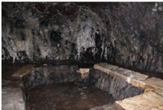
شکل ۱۲-۴- حمام سنگی خلخال

سابقه مدنیت در خلخال، واقع در بخش جنوبی استان به هزاره دوم قبل از میلاد باز می گردد. در قرن های دوم و سوم هجری در کتب جغرافیایی آن دوره مورخان و جغرافی دانان درباره خلخال مطالبی آورده اند.