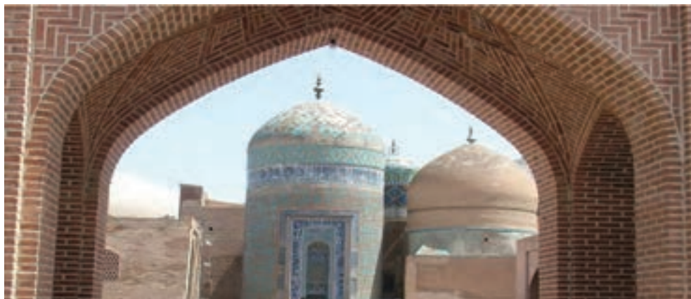
شکل ۷-۴- مجموعه بقعه شیخ صفی - گنبد الله الله در اردبیل