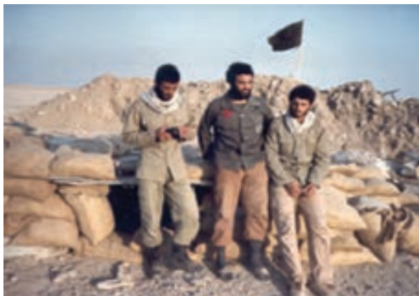
شکل ۲۱-۴- شهید میر محمود بنی هاشم (نفر دوم)