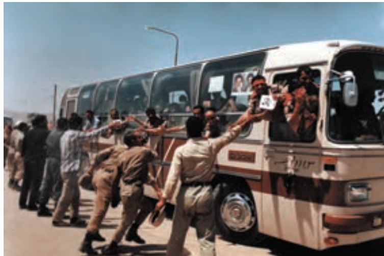
تصویر ۱۰-۱۱- ورود آزادگان به کشور