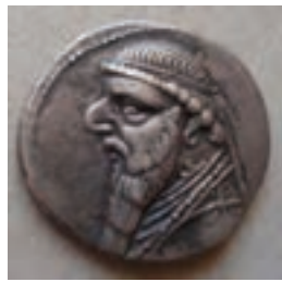
تصویر ۸-۱۰- سکه دوره اشکانی