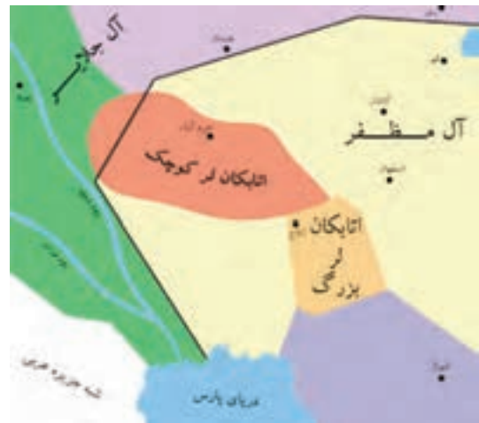
تصویر ۱۲-۱۰- محدوده حکومتی اتابکان لر

استان در دوران صفویه: در دوره صفویه استان چهارمحال و بختیاری به دلیل نزدیکی به شهر اصفهان - پایتخت صفویان - نقش مهم ایلات و عشایر، وجود چراگاه ها و مراتع غنی و سرسبز، مورد توجه پادشاهان صفوی قرار گرفت. اولین بار در دوره صفویه بود که منطقه ای که قبلاً به نام «لُر بزرگ» خوانده می شد کم کم به «بختیاری» معروف گشت. از زمان شاه تهماسب با توجه به تلاش های وی برای انتقال آب کارون به زاینده رود، منطقه مورد توجه بیشتری قرار گرفت.