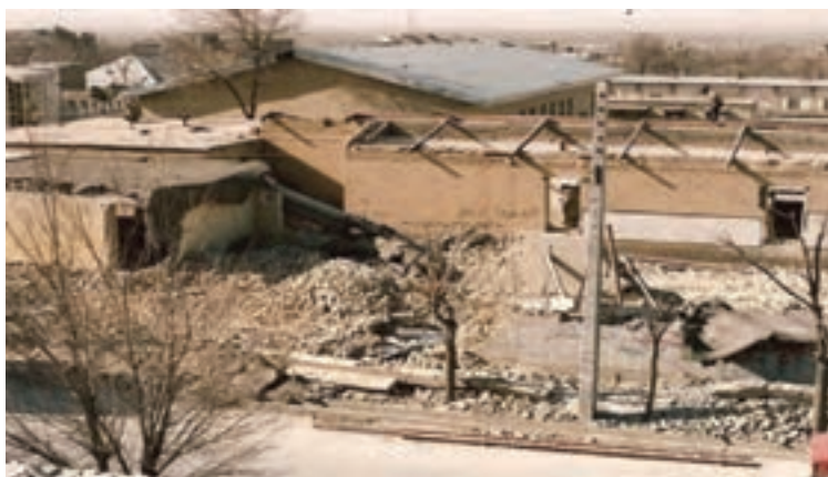
تصویر ۱۱-۱۱- بمباران شهرکرد توسط جنگنده های دشمن یعنی در تاریخ ۱۳۶۶/۱۲/۲۰

از آنجایی که مردم استان با تمام توان از رزمندگان اسلام حمایت می نمودند، دشمن یعنی برای شکستن مقاومت آنها، حملات وحشیانه ای به شهرکرد انجام داد که در اثر این حملات تعداد ۸۴ نفر از هم استانی های ما به درجه رفیع شهادت نایل آمدند.