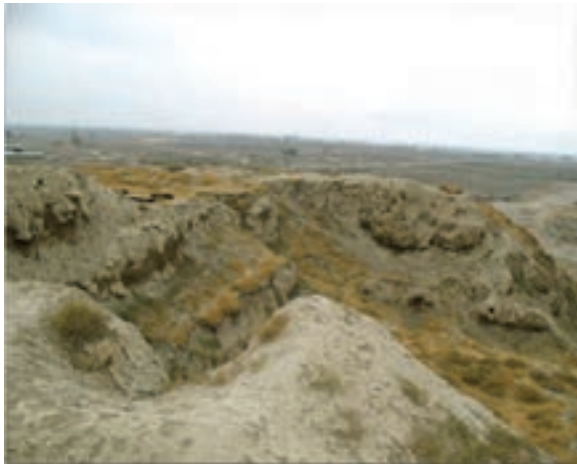
شکل ۲-۴ قدمت سکونت در تپه گودین در کنگاور به هزاره ششم قبل از میلاد می‌رسد.