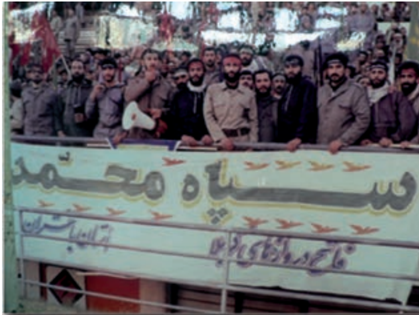
شکل ۴-۵- تصویری از سپاه محمد (ص)

رژیم عراق برای پیروزی در جنگ از هیچ عمل ننگینی علیه رزمندگان و مردم بی دفاع مرزنشین استان فروگذار نکرد؛ به طوری که در طول جنگ بارها از سلاح های شیمیایی استفاده کرد. از مناطقی که این چنین ناجوانمردانه مورد حمله شیمیایی دشمن قرار گرفت، می توان به روستای بان زرده ریجاب اشاره نمود.