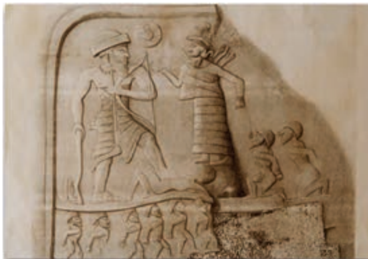
شکل ۳-۴- نقش آنوبانی نی - سرپل زهاب

از نخستین اقوام ساکن در منطقه کرمانشاه کنونی که نام آن‌ها در تاریخ ذکر شده، می‌توان اقوام گوتی، کاسی و لولوبی را نام برد. در این میان لولوبی‌ها یکی از قدیمی‌ترین سنگ‌نگاره‌های شناخته شده ایران (نقش آنوبانی نی) را پدید آوردند (شکل ۳-۴).