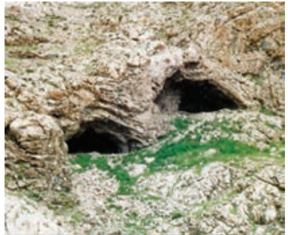
شکل ۱-۴ غار دواشکفت یکی از کهن‌ترین سکونتگاه‌های بشر در منطقه کرمانشاه در دامنه کوه تاق بستان

به نظر شما آیا رابطه‌ای بین گذشته تاریخی هر منطقه و جغرافیای طبیعی آن وجود دارد؟ با ذکر مثال برای گفته‌های خود دلیل بیاورید.