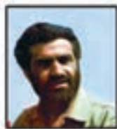
شهید حسن نوکند پور جانشین کسبک کل جبهه