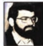
شهید سید اکرم کاشانی جانشین اطلاعات کل جبهه