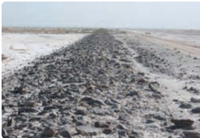
شکل ۲-۴- جاده سنگ فرش جهت عبور کاروان‌ها در جنوب گرمسار