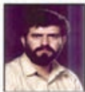
شهید سید حسن تکلیفانی نماینده مجلس و منطقه امام فر ریزشگاه کهنان