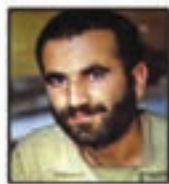
شهید حاج محمود انصاری مسئول مبارزات ۲۲ طی از ایستگاه ۱۰