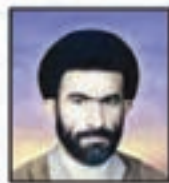
شهید سید الوالد بنامه نایب رئیس هیئت مدیره نماینده برادران فر