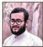
شهید حیدر عباسی مسئول نظامی جبهه و جنگ جنوب کشور

نتیجه این که رده استان را بین اول تا سوم کشور با اختلاف بسیار زیاد میانگین از کشور.