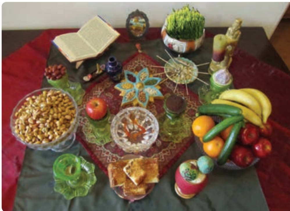
شکل ۲-۹- سفره هفت سین

سرخ، مانند هندوانه، انار و سیب را که نمادی از خورشید است تناول می‌کنند. چهارشنبه‌سوری: در این آیین کهن ایرانیان هفت بوته‌خار را آتش می‌زدند و از روی آن می‌پریدند و اشعاری را می‌خواندند که آثاری از آن در فرهنگ عامیانه ما موجود است. پس از برافروختن بوته‌های خار، خاکستر آن را جمع می‌کردند و از خانه بیرون می‌بردند. در بازگشت نیز اهل خانه را به تندرستی و دور کردن بلا یا مژده می‌دادند. در کنار آتش‌بازی آداب و رسوم دیگری مانند خوردن آجیل مشکل‌گشا، قاشق زنی، پختن آش و کوزه شکستن نیز مرسوم بود. همه این آیین‌ها تمایل مردم را برای تقسیم شادی با یکدیگر نشان می‌دهد اما بسیاری از این مراسم‌ها به دست فراموشی سپرده شده است و صمیمیت و شادمانی آن را تنها در حکایت پدربزرگ‌ها و مادربزرگ‌ها می‌توان شنید و تصور کرد. عید نوروز: مهم‌ترین جشن باستانی متداول در میان مردم استان، جشن نوروز است. به راه انداختن پیک‌های نوروزی، خانه‌تکانی، رویاندن دانه‌های گیاهی و آتش زدن بوته و شاخه‌های خشک درختان در شب چهارشنبه‌سوری، برگزاری مراسم یاد بود درگذشتگان، خرید لباس نو، خرید شیرینی و آجیل، گستردن سفره‌های نوروزی و ... از جمله آیین‌هایی است که در استقبال از بهار در سرتاسر خطه ایران برگزار می‌شود. هنگام تحویل سال خانواده‌ها در کنار سفره هفت‌سین می‌نشینند و دعای مخصوص لحظه تحویل سال را می‌خوانند و بعد از آن برای دید و بازدید به خانه اقوام می‌روند؛ به یکدیگر هدیه می‌دهند و سال خوبی برای هم آرزو می‌کنند. روز سیزدهم فروردین اعضای خانواده به دشت و سبزه‌زار می‌روند و سبزه سفره‌های هفت‌سین را به طبیعت می‌سپارند.