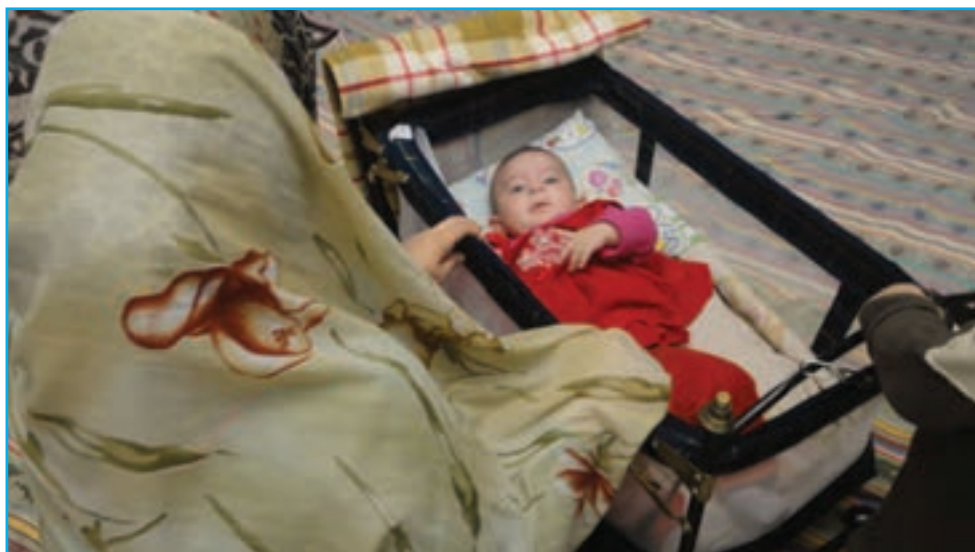
شکل ۳-۶- لالایی موجب آرامش جسم و روح مادر و کودک می‌شود.

لالایی‌ها بخش لطیفی از ادبیات شفاهی سرزمین ماست که به عنوان نخستین ارتباط کلامی مادر با کودک، مهر و محبت مادرانه را به طرز زیبایی در وجود کودکان جاری می‌سازد و موجب آرامش جسم و روح مادر و کودک می‌شود. از دیرباز در آذربایجان لالایی‌ها در فرهنگ عامیانه مردم جایگاه مهمی داشته است.