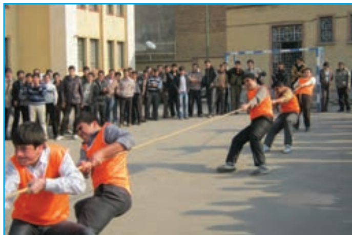
شکل ۷-۳- تصویری از مسابقه طنابکشی در میان دانش آموزان در مدارس

در گذشته در مناطق مختلف آذربایجان همچون دیگر مناطق ایران، کودکان و نوجوانان اوقات فراغت خود به صورت های گوناگون سپری می کردند که هم موجب تفریح و شادی آنان می شد و هم آنها را با فنون و مهارت های اجتماعی آشنا می ساخت. امروزه این بازی ها که پر از شادی و نشاط بوده اند، جای خود را به وسایل ارتباط جمعی به ویژه تلویزیون، بازی های رایانه ای، آتاری و ... داده است که هم آثار نامناسبی بر سلامت روح و روان کودکان و نوجوانان برجای می گذارد و هم سلامت جسمی آنان را به مخاطره می اندازند. در آذربایجان با توجه به تنوع این منطقه انواع بازی های محلی مشاهده می شود. از جمله آنها می توان به بازی: بنفشه بنده دوشتر، بش داش، طناب کشی، تیرنا ووردی، پیل دسته (کلینگ آغاج)، آرادا ووردی، گیزلین پالانج (قایم باشک) و... اشاره کرد.