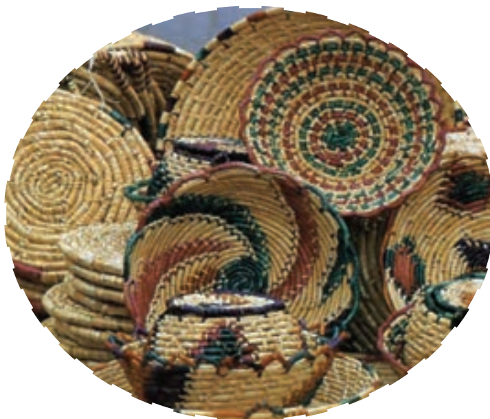
شکل ۱۵-۳- سبدهافی در کشکسرای

از سبدهافی نیز باید به عنوان یکی از صنایع در حال انقراض یاد کرد. این صنعت خانگی در گذشته نه چندان دور در بیشتر مناطق آذربایجان رونق داشته است. سبدهافی از ساقه‌های گندم و جو در مناطقی از شهرستان مرند (کشکسرای) و سبدهافی از چوب موسون در روستاهای اطراف مراغه پیشینه تاریخی زیادی دارد. زنان این مناطق این سبدها را در طرح‌ها و رنگ‌های بسیار زیبا می‌بافتند و این سبدها بیشتر مصارف خانگی داشته است.