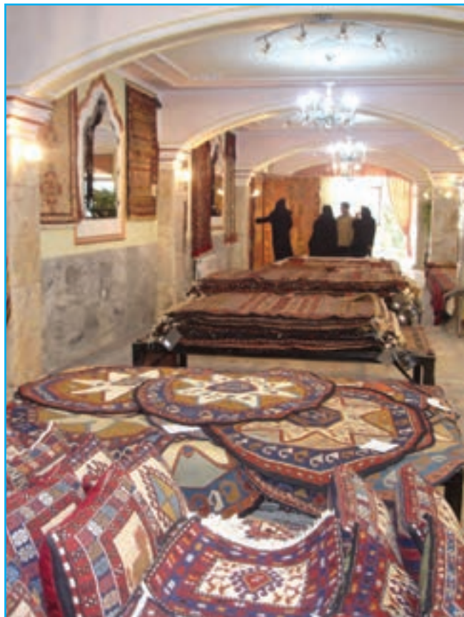
شکل ۱۲-۳- نمایشگاه و فروشگاه صنایع دستی عشایر

در این میان صنایع دستی به‌عنوان جلوه‌ای بدیع از هنرهای سنتی در آذربایجان توانسته همواره تحسین نظاره‌گران را برانگیزد.