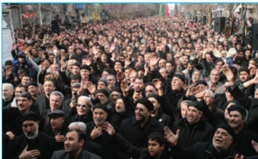
شکل ۲-۳- تصویری از مراسم سینه‌زنی در ایام محرم در استان

شبیه‌خوانی، برخی روستاییان با روشن نمودن سماور زغالی جلوی منازل خود از عزاداران حسینی پذیرایی می‌کردند. امروزه این مراسم با گذشت زمان شکل‌های متفاوتی پیدا کرده است.