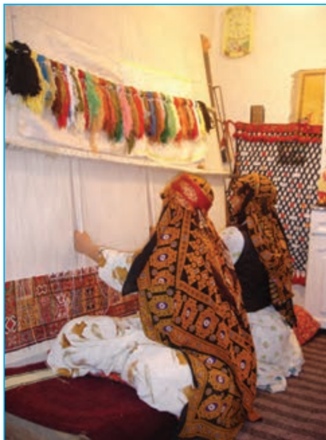
شکل ۱۱-۳- قالی‌بافی در استان

استان آذربایجان شرقی در بسیاری از زمینه‌های هنری پیشرو بوده و مکتب خاص خود را داشته است و توانسته در طول تاریخ صفحات درخشان را از حضور فعال و مؤثر مردان و زنان هنرمند خود به نمایش بگذارد.