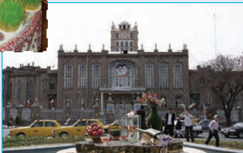
شکل ۱۰-۳- تصویری از مراسم عید نوروز در استان