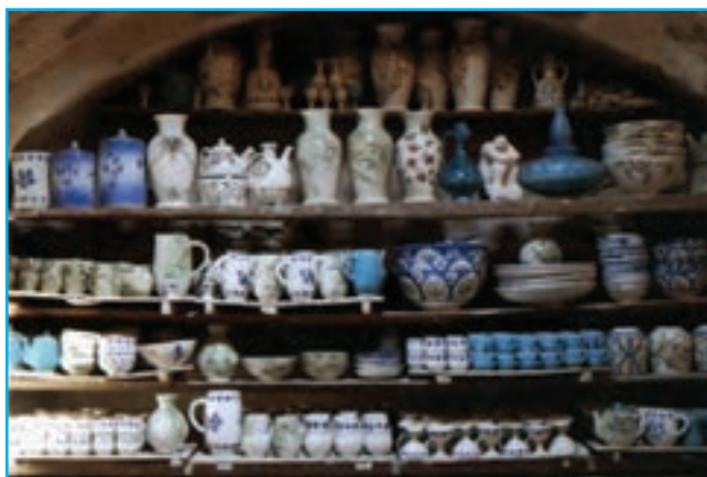
شکل ۱۴-۳- سفالگری در زنوز

صنایع دستی برجسته این استان شامل قالی‌بافی، ورنی بافی، گلیم بافی، سوزن دوزی، جاجیم بافی، تذهیب، هنرهای چوبی، سفالگری، نقاشی روی چرم، سبذبافی و... است. رونق صنعت زیبای فرش بافی در این استان به حدی است که عمده‌ترین صادرات غیرنفتی استان را به‌خود اختصاص داده است. فرش این استان معمولاً به کشورهای آلمان، فرانسه، ایتالیا و انگلیس صادر می‌شود.