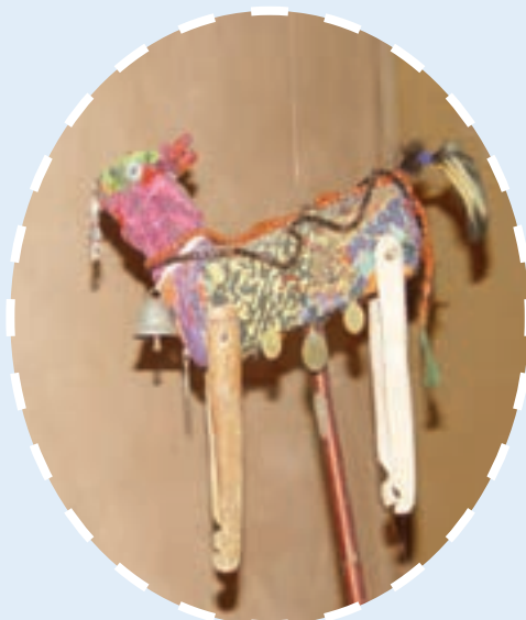
شکل ۹-۳- تصویری از «تکم» در روستا

نوروز یکی از مهم‌ترین اعیاد مردم آذربایجان شرقی است. مردم از فصل سبز و زاینده‌گی طبیعت با نام‌هایی چون: نوروز بایرامی، ایل بایرامی یاد می‌کنند. در گذشته نه چندان دور با آمدن بیک‌های نوروز، این مراسم آغاز می‌شد. پنجاه روز مانده به عید سفیران نوروزی با آوازخوانی و دست‌افشانی رفتن زمستان سرد و طولانی و آمدن بهار سرسبز را به مردم مزه می‌دادند. مردم آمدن آن‌ها را به فال نیک می‌گرفتند و اعتقاد داشتند که سالی که بیک‌های نوروزی به راه می‌افتند، برای آن‌ها سالی پر محصول خواهد بود. بیک‌های نوروزی چند دسته بودند که یک دسته از آن‌ها تکم چی‌ها بودند. تکم نام پادشاه بزه‌است و آن را از چوب و دانه‌های رنگین درست می‌کردند و دم خروس برایش می‌گذاشتند. بعد آن را سوار تخته‌ای می‌کردند و با تکان دادن اهرمی که به شکم تکم وصل بود، آن را می‌رقصانند و درباره‌ی خوشبختی‌ها و بدبختی‌های تکم شعر می‌خواندند.