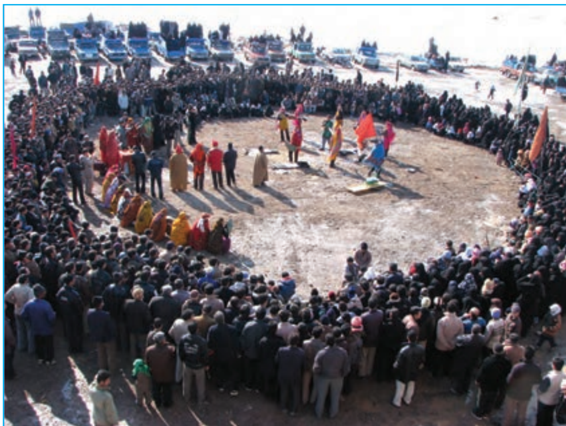
شکل ۳-۳- تصویری از مراسم شبیه‌خوانی