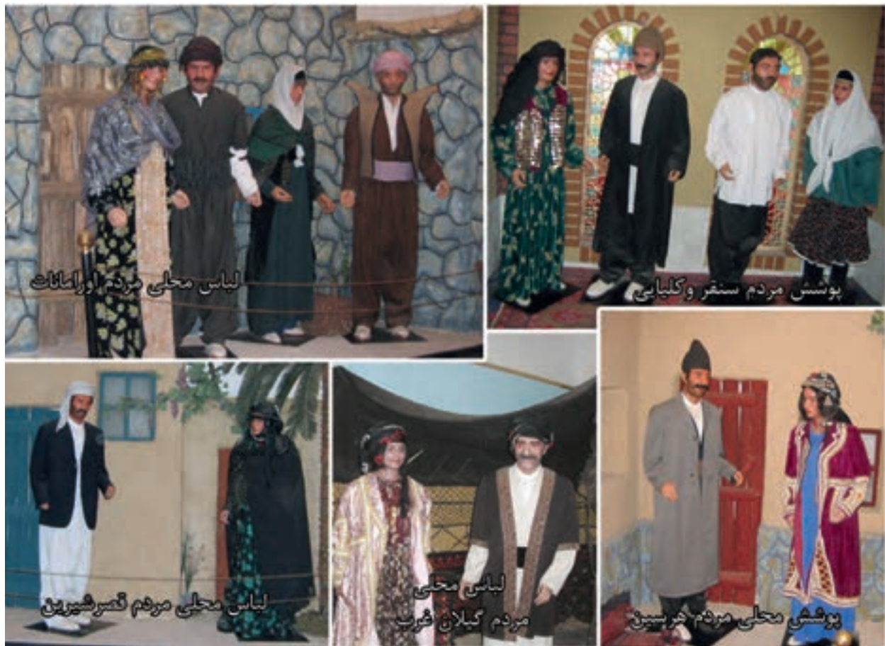
شکل ۲-۳- لباس های محلی مردم استان کرمانشاه (موزه مردم شناسی واقع در تکیه معاون الملک)