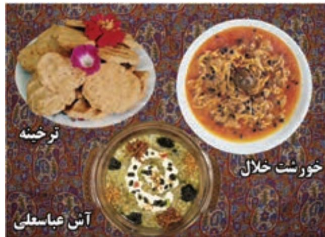
شکل ۳-۳- برخی از غذاهای محلی استان کرمانشاه

بیشتر غذاهای رایج در استان همان‌هایی هستند که در اکثر نقاط کشور رواج دارند ولی برخی از خوراک‌ها و شیرینی‌ها نیز ویژه این استان بوده و از تنوع و شهرت خاصی برخوردار است. از جمله می‌توان به موارد زیر اشاره کرد: برخی از غذاهای محلی استان کرمانشاه شامل: دنده کباب، خورش خلال، پلو کشمش، دانه کولانه، بورانی کنگر، پلو شویت، قورمه، هلیسه، آش غوره، بُورانی چغندر، آش ترخینه، آش عدس، دلمه، خورش کدو حلوایی و شیرینی‌ها شامل: نان برنجی، نان خرمايي، کاک، بڑی (پرساق) و حلوا است. در بین انواع شیرینی‌ها نان برنجی و کاک و نان خرمايي از شیرینی‌های مشهوری است که در سطح کشور به عنوان سوغات استان کرمانشاه شناخته شده‌اند؛ چنانکه روغن حیوانی کرمانشاه نیز در تمام کشور جایگاه ویژه‌ای دارد.