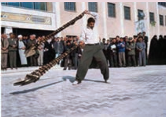
شکل ۳-۳- بیل گردانی در نیمور

مراسم بیل گردانی: از حدود نیمه اسفند هر سال، کشاورزان اهالی شهر نیمور و باقرآباد محلات برای لایروبی رودخانه بزرگ نیمور یا شاه جوی به صورت دسته جمعی و مطابق زمین خود اقدام می‌کنند. بعد از پایان عملیات لایروبی همگی در کنار سد نیمور که از سدهای قدیمی و تاریخی استان است، جمع می‌شوند. این لایروبی ممکن است چند روز طول بکشد. هنگامی که بعد از لایروبی آب به پخشگاه (محل توزیع آب) می‌رسد، مردم جشن می‌گیرند و به شیوه ورزش‌های پهلوانی اقدام به گرداندن بیل‌ها می‌کنند. بدین طریق که ۴ بیل را در یک دسته و ۳ بیل را در دسته‌ای دیگر به هم می‌بندند و افراد آن‌ها را برمی‌دارند و به دور سر خود می‌چرخانند. اگر بیل‌ها به هم نخورد، برنده است و مردم او را تشویق می‌کنند.