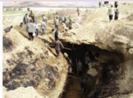
شکل ۳-۲- همکاری روستاییان خمین در لایروبی قنوات

جشن کوسه ناقلدی (ناقالدی): در روستاهای استان مرکزی ۴ روز پس از سپری شدن زمستان و ۵ روز باقی مانده به نوروز، جشن کوسه برگزار می‌شود که بسیار دیدنی است. در این مراسم تعدادی از چوپانان و جوانان و نوجوانان در نقش داماد (کوسه)، عروس با پوشیدن لباس‌ها و کلاه‌هایی از پوست و بستن زنگوله‌هایی به خود به در خانه‌ها رفته و شعر معروف «ناقالدی گنده گنده، چهل رفته پنجاه مانده» را خوانده و پایکوبی می‌کردند. اگر صاحب‌خانه