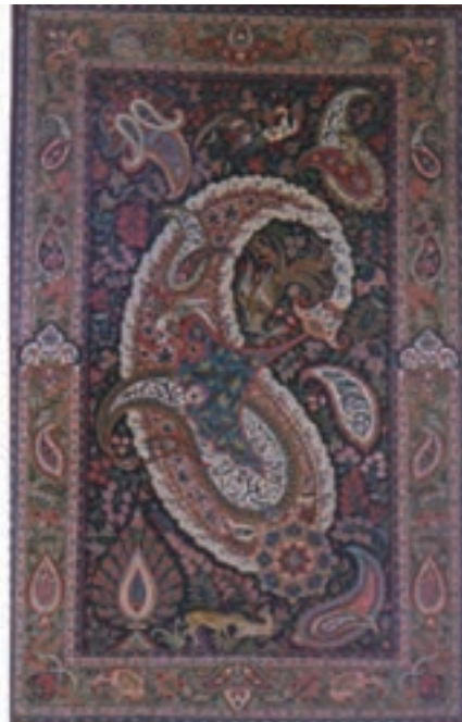
شکل ۱۰-۳- فرش‌های دست بافت جیریا و ساروق

از گذشته‌های دور، استان مرکزی به‌عنوان یکی از مراکز صنعتی و قطب‌های مهم در صنایع دستی به‌همگان شناسانده شده است. فرش دستباف استان مرکزی با نام تجاری فرش ساروق و جیریا در جهان مشهور شده است و کمتر موزه‌ای است که مزین به آثار هنرمندان و صنعتگران فرشباف استان نباشد. گلیم استان به‌خصوص گلیم ساوه از دوران صفوی با سابقه درخشان تولید شده و در حال حاضر گلیم گل برجسته استان در کشور پرآوازه است.