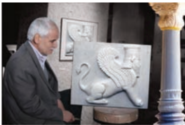
شکل ۱۴-۳- گچ‌بری از صنایع دستی استان

مسگری نیز در اراک و تفرش سابقه‌ای دیرینه دارد. از دیگر رشته‌های صنایع دستی در استان که قابلیت‌ها و زمینه‌های رشد و فعالیت زیادی دارند، می‌توان از طراحی و نقشه‌کشی فرش، رفوگری، رنگری سنتی، جاجیم بافی، هنرهای چوبی شامل: منبت کاری و کنده‌کاری روی چوب، معرق، محرق (با ساقه‌گندم)، پیکرتراشی، نازک کاری چوب، مشبک، ساخت سازه‌های سنتی و خراطی، صنایع فلزی شامل: قلمزنی روی مس، مسگری، سفیدگری، چلنگری، علامت‌سازی و دیگر رشته‌ها: آینه کاری، گچبری سنتی، سوزن‌دوزی و رسته‌های وابسته به آن، گیوه‌بافی و گیوه‌دوزی (در وفس و سنجان) البته محلی، سرامیک سفالگری و مجسمه‌سازی، صنایع دستی تکمیلی و تلفیقی، بامبو بافی، تراش سنگ‌های قیمتی و نیمه قیمتی، تذهیب و نگارگری، بافتنی‌های سنتی، عروسک‌های محلی و ... که بالغ بر ۶۶ رشته می‌باشند، نام برد. هنر خوش‌نویسی نیز جایگاه ویژه‌ای در استان دارد و استاد فتحعلی واشقانی فراهانی از خوش‌نویسان مشهور و از چهره‌های ملی است.