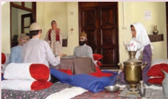
شکل ۴-۳- مراسم شب چله

مراسم شب چله: شب اول زمستان را شب چله می‌گویند. در این شب خانواده‌های فامیل عروس و داماد به خانه بزرگ‌ترها می‌روند و در آنجا بعد از خوردن شام، انواع میوه و شیرینی صرف می‌کنند و تا نیمه‌های شب شعر، قصه و هم‌چنین دیوان حافظ و شاهنامه می‌خوانند. در این شب هفت نوع خوراکی و تنقلات از جمله کدوی پخته، هندوانه، قاووت و باسلق می‌خورند. خانواده‌های داماد که دختری را به نامزدی پسرشان انتخاب کرده‌اند، هدیه‌ای برای او می‌فرستند که به آن شب چله‌ای می‌گویند. در اکثر روستاها در شب چله گوسفندی را که در فصل تابستان و پاییز پرواری کرده‌اند، ذبح کرده و برای مصرف میهمان به عنوان شام می‌پزند.