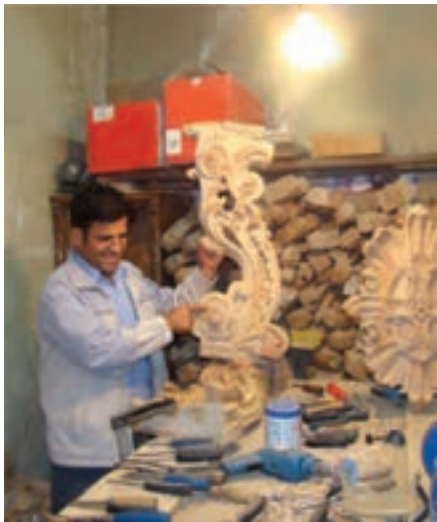
شکل ۱۲-۳- منبت کاری در سقاور کمیجان