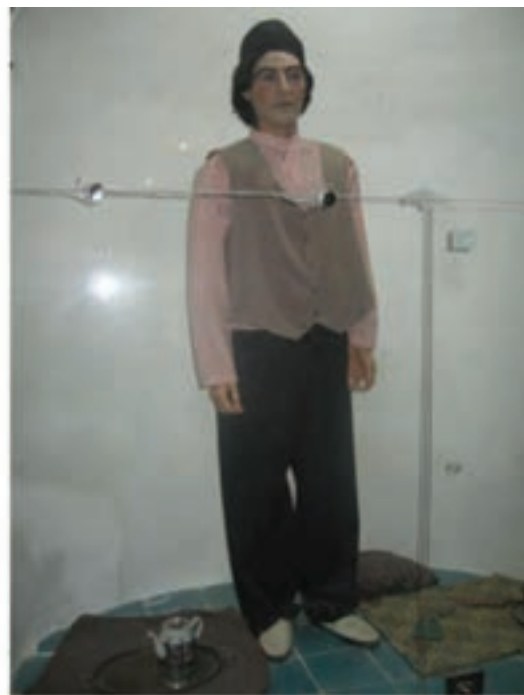
شکل ۹-۳- پوشش سنتی زنان و مردان - موزه چهارفصل اراک