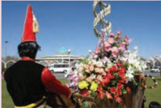
شکل ۳-۶- مراسم نوروز در شهر

همچنین هنگام تحویل سال جدید، همه اعضای خانواده اطراف هفت سین می‌نشینند و دعا و قرآن می‌خوانند تا سال جدید شروع شود. بعد از تحویل سال اعضای خانواده دست پدر و مادر را می‌بوسند و پدر به تمامی اعضای خانواده، تخم مرغ، جوراب و مقداری پول عیدی می‌دهد و شروع به خوردن شیرینی و تنقلات داخل سفره می‌کند.