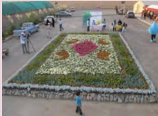
شکل ۳-۸- جشنواره گل در محلات - تابستان ۱۳۸۹

مراسم هدیه دادن به مناسبت‌های خاص، مثل خرید منزل، اتومبیل و سایر وسایل خانه نیز در مناطق مختلف استان به فراخور وضعیت مالی افراد برگزار می‌شود که از آن با عنوان سرمنزلی یا سرماشینی و... یاد می‌شود. جشنواره انار در ساوه، جشنواره انگور در هزاوه، جشنواره گل محلات و مراسم جشن درو (اول تابستان) در فراهان از مراسمی است که هر ساله برگزار می‌شود.