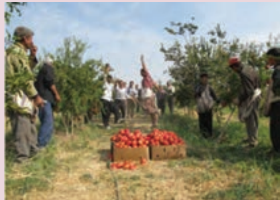
شکل ۳-۷- جشنواره انار در ساوه