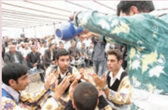
شکل ۳-۵- مراسم آب پاشان در فراهان

مراسم هدیه دادن به مناسبت‌های خاص، مثل خرید منزل، اتومبیل و سایر وسایل خانه نیز در مناطق مختلف استان به فراخور وضعیت مالی افراد برگزار می‌شود که از آن با عنوان سرمنزلی یا سرماشینی و... یاد می‌شود. جشنواره انار در ساوه، جشنواره انگور در هزاوه، جشنواره گل محلات و مراسم جشن درو (اول تابستان) در فراهان از مراسمی است که هر ساله برگزار می‌شود.