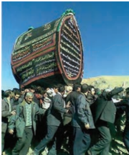
شکل ۱-۳- مراسم نخل گردانی

مراسم نخل گردانی: روز عاشورای حسینی در محله‌های تفرش، مراسم نخل گردانی برگزار می‌شود. افراد مسن و پیش‌کسوت‌های محله نخل را تزئین می‌کنند و هر یک از اعضای طایفه ساکن محله، زیر یکی از تیرهای نخل را می‌گیرند و پیشاپیش هیئت‌های سینه‌زنی و زنجیرزنی به حرکت در می‌آیند و مردم نذورات خود را به کسی که جلوی نخل حرکت می‌کند، می‌دهند. در داخل اتاقک نخل تعزیه‌خوانی می‌نشینند و روضه و نوحه سیدالشهدا (ع) را می‌خوانند. البته شبیه این مراسم در شهرهای خمین، نراق، بعضی از روستاهای منطقه فراهان و دیگر نقاط استان نیز انجام می‌گیرد.