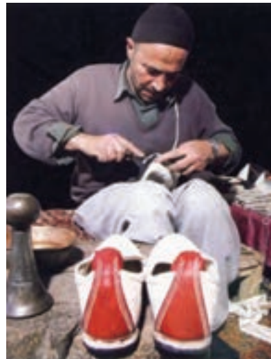
شکل ۱۱-۳- گیوه بافی در سنجان

مسگری نیز در اراک و تفرش سابقه‌ای دیرینه دارد. از دیگر رشته‌های صنایع دستی در استان که قابلیت‌ها و زمینه‌های رشد و فعالیت زیادی دارند، می‌توان از طراحی و نقشه‌کشی فرش، رفوگری، رنگری سنتی، جاجیم بافی، هنرهای چوبی شامل: منبت کاری و کنده‌کاری روی چوب، معرق، محرق (با ساقه‌گندم)، پیکرتراشی، نازک کاری چوب، مشبک، ساخت سازه‌های سنتی و خراطی، صنایع فلزی شامل: قلمزنی روی مس، مسگری، سفیدگری، چلنگری، علامت‌سازی و دیگر رشته‌ها: آینه کاری، گچبری سنتی، سوزن‌دوزی و رسته‌های وابسته به آن، گیوه‌بافی و گیوه‌دوزی (در وفس و سنجان) البته محلی، سرامیک سفالگری و مجسمه‌سازی، صنایع دستی تکمیلی و تلفیقی، بامبو بافی، تراش سنگ‌های قیمتی و نیمه قیمتی، تذهیب و نگارگری، بافتنی‌های سنتی، عروسک‌های محلی و ... که بالغ بر ۶۶ رشته می‌باشند، نام برد. هنر خوش‌نویسی نیز جایگاه ویژه‌ای در استان دارد و استاد فتحعلی واشقانی فراهانی از خوش‌نویسان مشهور و از چهره‌های ملی است.