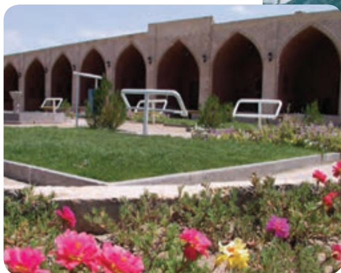
شکل ۱۷-۲- کاروانسرای وهابزاده رفسنجان