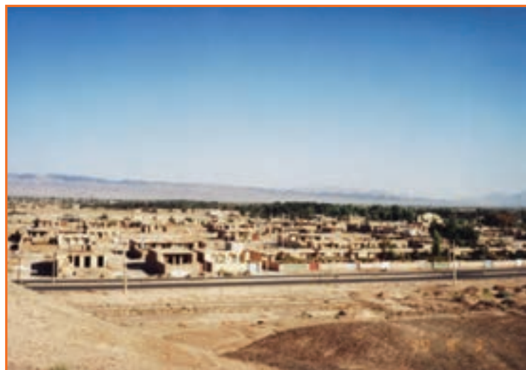
شکل ۱۲-۲- شهر راور با نقش ارتباطی