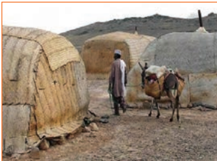
شکل ۹-۲- کپز نشینی در جنوب استان کرمان

در نواحی جنوبی استان کرمان که از محروم‌ترین مناطق ایران است هنوز بیشترین درصد جمعیت در مناطق روستایی زندگی می‌کنند. عده زیادی از آن‌ها در خانه‌هایی به نام کپز زندگی می‌کنند. که اگر برای اشتغال و مسکن آن‌ها فکر اساسی نشود در آینده‌ای نه چندان دور، آن‌ها نیز به نواحی شهری مهاجرت کرده و بر درصد جمعیت شهرنشین و همچنین مشکلات شهرها می‌افزایند.