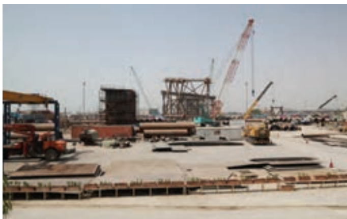
شکل ۷-۸- نمایی از بندر دیر

بندر بوشهر: بوشهر بندری است شبه جزیره‌ای در بخش مرکزی شهرستان بوشهر که از سمت شمال غرب و جنوب به خلیج فارس محدود شده است. این بندر در منطقه ساحلی خلیج فارس واقع شده و به خاطر عواملی مانند صیادی، وجود نیروگاه اتمی، کشتی‌سازی و صادرات رونق اقتصادی دارد.