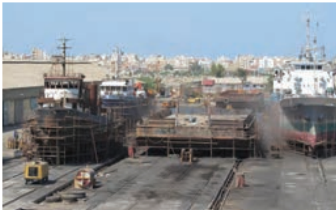
شکل ۷-۷- نمایی از بندر بوشهر

قدیمی ترین نشانه‌های به دست آمده از سکونت انسان در سرزمین بوشهر به دوران حکومت ایلامی‌ها و تمدن بین النهرین برمی‌گردد. منطقه تجاری بوشهر در آن زمان دهکده‌ای به نام لیان بود. از دوره هخامنشیان نیز آثار با ارزشی در شهرستان دشتستان کشف شده است. در زمان اردشیر بابکان شهر رام اردشیر در دو فرسنگی شهر بوشهر بنا گذاشته شد که اکنون به نام ریشهر معروف است. نحوه شکل‌گیری مراکز شهری استان بیانگر استقرار جمعیت و فعالیت‌های اقتصادی وابسته به منابع آب و فعالیت‌های مرتبط با دریا در ساحل می‌باشد. شکل‌گیری این مراکز از شمالی‌ترین نقطه استان تا جنوبی‌ترین آن که عمدتاً بر روی نوار ساحلی، دشت‌ها و کوهپایه‌ها بوده که نشانگر توزیع مناسب آنها از نظر استقرار و فاصله بین این مراکز است. شهر بوشهر به عنوان مرکز استان و دیگر شهرهای ساحلی از دیرباز مراکز تجارت و فعالیت‌های بندری بوده‌اند.