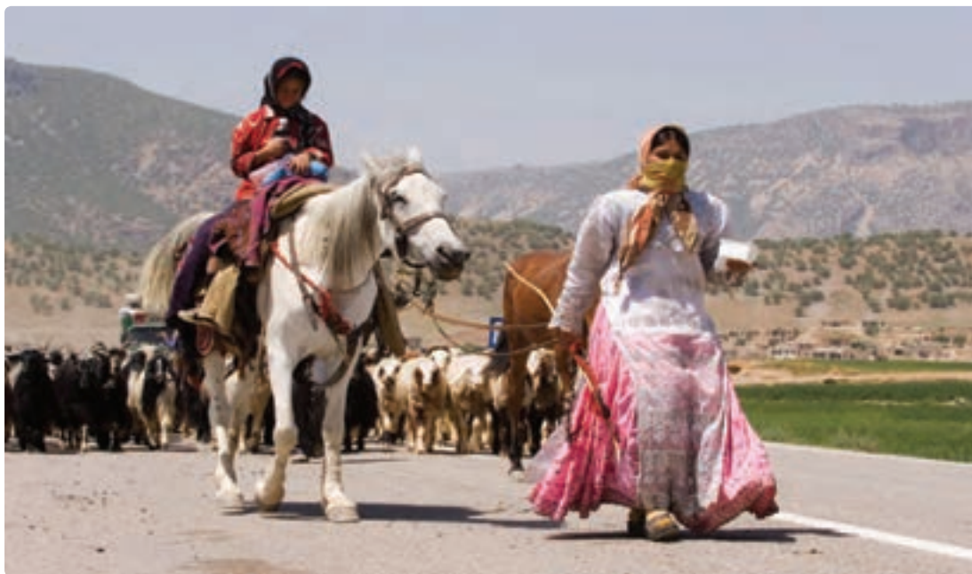
شکل ۱-۷- کوچ عشایر در استان بوشهر

همچنین گستره وسیعی از استان بوشهر قلمرو زیست و محل اسکان دائمی و فعالیت عشایر است. اگرچه جمعیت عشایری نسبت کمی از جمعیت استان را در بر می‌گیرد، ولی به اقتضای شیوه زیست این گروه، بخش عظیمی از خاک استان قلمرو زیست طوایف مختلف ایل قشقایی است. شهرستان دشتستان بیشترین جمعیت عشایری استان را در خود جای داده است.