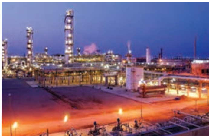
شکل ۹-۷- نمای از بندر عسلویه

بندر عسلویه : این بندر مرکز شهرستان عسلویه می‌باشد. عسلویه یک منطقه عظیم صنعتی از توابع استان بوشهر در جنوب ایران است و مهم‌ترین پایگاه اقتصادی ایران و بزرگ‌ترین منطقه تولید انرژی جهان است. از دیگر بنادر استان بوشهر به کنگان و منطقه گناوه و دیلم می‌توان اشاره نمود.