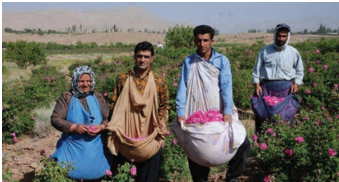
برداشت گل برای گلاب‌گیری