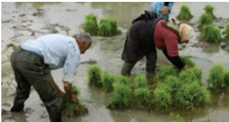
کار در شالیزار

به نظر شما آیا می‌توان ساعت کاری کارگران برای یک‌ماه را به روش دیگری نیز محاسبه نمود؟ با دوستان خود در این مورد بحث کنید.