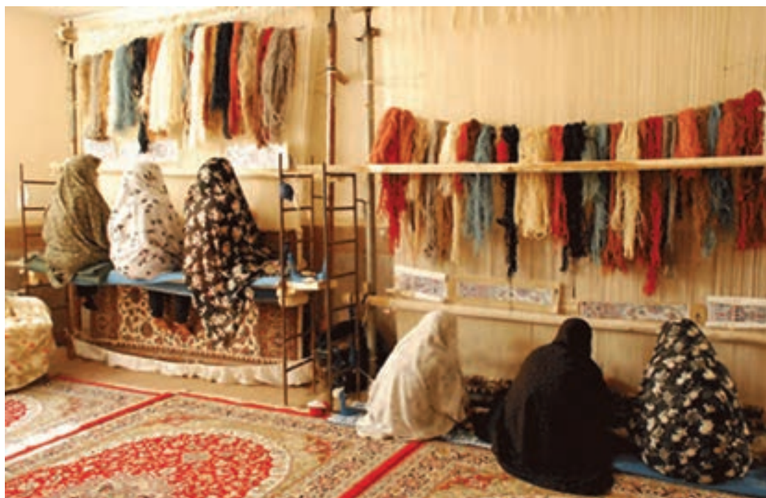
کارگاه فرش بافی (اشتغال و تولید)