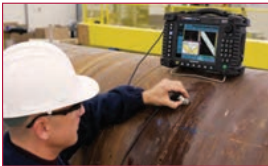
شکل ۶-۱- بازرسی جوش (تست التراسونیک)

تکنسین جوش پلاسما، تکنسین جوش میگ و مگ، بازرسان جوش: تکنسین تست التراسونیک، تکنسین کنترل کیفی جوش، تکنسین تست مایع نافذ و ذرات مغناطیسی برخی از مشاغل رشته صنایع فلزی است که هنرجویان پس از کسب شایستگی‌های لازم در این رشته، می‌توانند در هر یک از این مشاغل در صنایع نام‌برده مشغول به کار شوند.