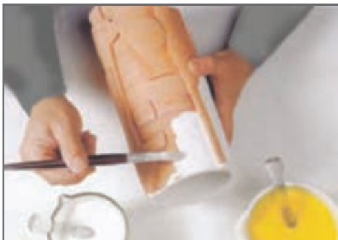
شکل ۱۱- اعمال لعاب بر روی سطح بیرونی قطعه

برای جلوگیری از جذب سریع لعاب که باعث پوششی غیر یکنواخت می‌شود، بهتر است لایه اول با لعاب رقیق‌تر زده شود. باید اولین لایه، کل سطح شامل تمام فرورفتگی‌ها و خلل و فرج‌ها را به خوبی بپوشاند. قبل از آنکه لایه دوم لعاب زده شود، صبر کنید تا لایه اول خشک شود. همین‌طور وقتی که لایه‌های بعد لعاب زده می‌شود باید مراقب بود که قلم‌مو، لایه‌های قبلی را خراب نکند.