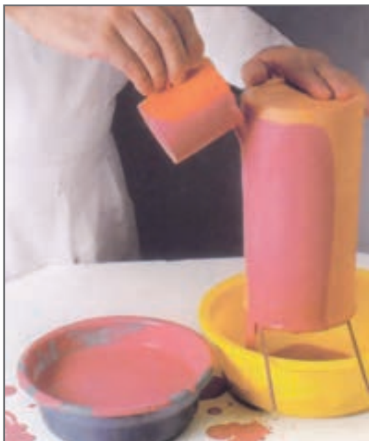
شکل ۱۴- اعمال لعاب به روش ریختنی

اگر قطعه، یک گلدان یا شکلی شبیه به آن است، در مرحله بعد، لبه را تا حدود ۲ تا ۳ سانتی‌متر به‌طور مستقیم به داخل لعاب فرو برده تا از لعاب پوشیده شود. سپس گلدان به‌طور ایستاده بر روی میله‌های آهنی یا تکه‌های چوب قرار داده می‌شود. از لبه محل لعاب خورده شروع به ریختن لعاب می‌شود و همزمان گلدان یا ترجیحاً پایه گردان با دست دیگر چرخانده می‌شود. نباید لبه ظرف حاوی لعاب با سطح قطعه تماس پیدا کند. هنگام ریختن لعاب، باید به‌طور یکنواخت روی سطح کار، با پوشش کافی و بدون هیچ چکه‌ای (مگر آن‌که خواهان یک جلوه‌گری چکه‌ای برای قطعه باشیم) جاری شود.