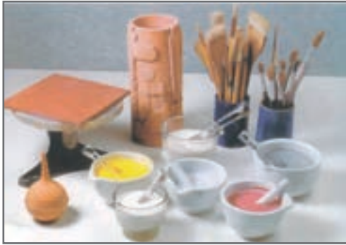
شکل ۱۰- تجهیزات مورد استفاده جهت لعاب‌زنی با قلم‌مو

اگر بخواهیم قطعه‌ای با رنگ‌های مختلف لعاب زده شود یا ته رنگ‌های تزیینی به آن اضافه شود، بدون شک روش لعاب‌زنی با قلم‌مو مناسب‌ترین روش است. این روش به‌ویژه برای لعاب‌کاری نقوش دیواری، مجسمه‌ها یا نقوش برجسته که اغلب به بیش از یک نوع لعاب نیاز دارند، مناسب است. با این روش امکان لعاب‌زنی قسمت‌های مختلف بدنه با لعاب‌های گوناگون نیز وجود دارد. افراد مبتدی باید لعاب‌زنی را با روش قلم‌مو شروع کنند زیرا کسب مهارت در این روش با کمی تمرین و تجربه نسبتاً آسان است.