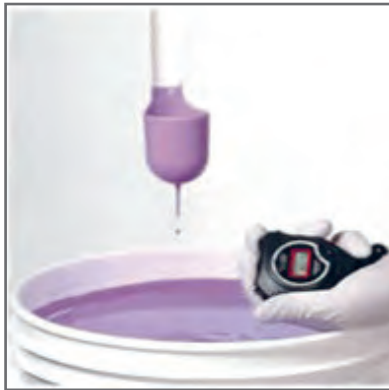
۲ اندازه‌گیری گرانشی