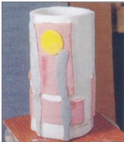
شکل ۱۲- قطعه لعاب زده‌شده با استفاده از روش قلم‌مو

گاهی بدنه برای پوشش کامل به دو یا سه لایه لعاب نیاز دارد. برای جلوگیری از حباب زدن یا متورم شدن لعاب، قبل از زدن لایه بعدی صبر کنید تا لایه قبلی خشک شود. برای پوشش بهتر، جهت لایه‌ها تغییر داده می‌شود. اگر اولین لایه به صورت عمودی لعاب زده شده است لایه بعدی به صورت افقی اعمال شود.