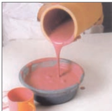
خارج کردن اضافی لعاب از داخل قطعه

برای لعاب‌زنی بدنه‌ای که از قبل آماده شده است، ابتدا داخل قطعه لعاب زده می‌شود. به این صورت که قطعه از لعاب پر می‌شود و سپس چرخانده می‌شود تا لعاب به‌طور یکنواخت سطح داخلی را پوشش دهد. سپس لعاب اضافی به ظرف محتوی لعاب برگردانده می‌شود.