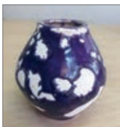
شکل ۲۹- عیب جمع شدگی لعاب