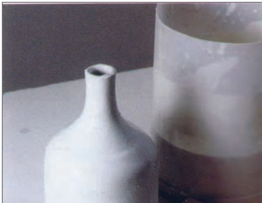
شکل ۱۸- قطعه لعاب‌زده شده به روش غوطه‌وری

بعد از غوطه‌وری محل تماس انبرک یا انگشتان با قطعه، باید لعاب زده شود.