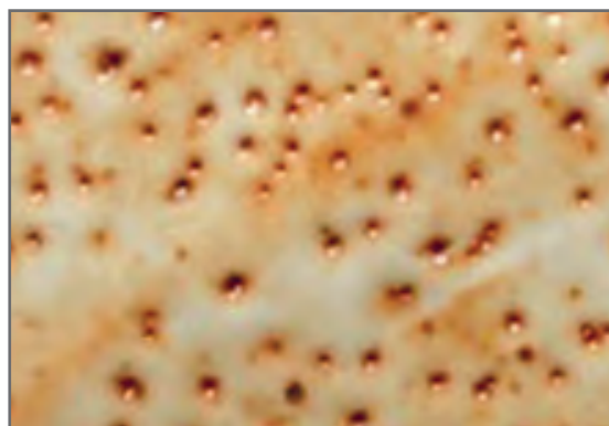
شکل ۳۲- عیب ته سوزنی

منظور از این عیب، سوراخ‌های ریزی است که بر سطح لعاب پدید می‌آید. یکی از عوامل ایجاد جوش بر سطح لعاب حبس شدن حباب‌های هوا بر سطح بدنه‌ای است که بر روی آن لعاب اعمال شده است، که در هنگام پخت لعاب در کوره این حباب‌ها از زیر لعاب، جوش زده و سطح لعاب را ناصاف می‌کنند.