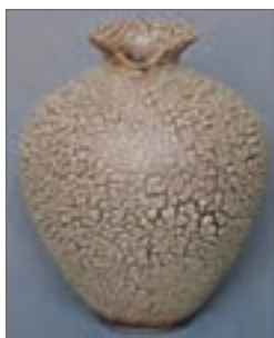
شکل ۳۱- عیب خزیدگی لعاب

ایجاد این عیب ممکن است به علت چرب و روغنی بودن یا وجود شوره در سطح بدنه باشد که از اتصال و چسبیدن صحیح لایه لعاب خام به بدنه جلوگیری می‌کند. علاوه بر این موارد، ترکیب لعاب و درجه حرارت پخت نیز مؤثر هستند. افزایش درجه حرارت پخت احتمال لعاب نگرفتگی را کمتر می‌کند.