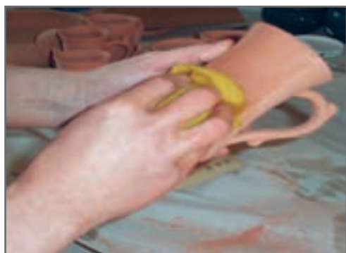
شکل ۴- حذف گرد و غبار از سطح سرامیک با استفاده از اسفنج مرطوب جهت اعمال لعاب

پاک کردن گرد و خاک ممکن است باعث شود که گرد و غبار در خلل و فرج قطعه نفوذ کند، همچنین بدنه آغشته شده به مواد روغنی باید به دقت با مواد پاک کننده شست و شو شده و قبل از استفاده کاملاً خشک شود. با حرارت دادن نیز می‌توان روغنی که بر روی قطعه برجا مانده را حذف کرد.