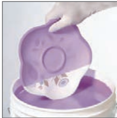
۳ انجام عمل غوطه‌وری