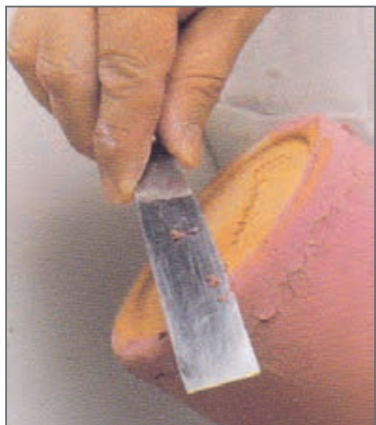
شکل ۱۵- پاک کردن کف قطعه از لعاب

برای قطعات بزرگ‌تر، به لایه دوم لعاب بر روی لایه اول نیاز خواهد بود تا لعابی مناسب ایجاد شود، زیرا اولین پوشش لعاب ضخامت لازم را نخواهد داشت. لعاب‌زنی در دولایه، لعاب بسیار زیباتری را ایجاد خواهد کرد تا آنکه سعی شود لعاب به‌صورت لایه‌ای ضخیم زده شود. دومین لایه بلافاصله بعد از خشک شدن لایه اول لعاب، باید اعمال شود اگر فاصله زمانی اعمال لایه دوم لعاب طولانی‌تر شود، در لعاب حباب‌هایی ایجاد می‌شود و حتی ممکن است در قسمت‌هایی ترک ناخواسته ایجاد شود. در صورت تمایل، برای دستیابی به جلوه‌های جذاب، می‌توان برای دومین لایه از لعابی دیگر استفاده کرد.