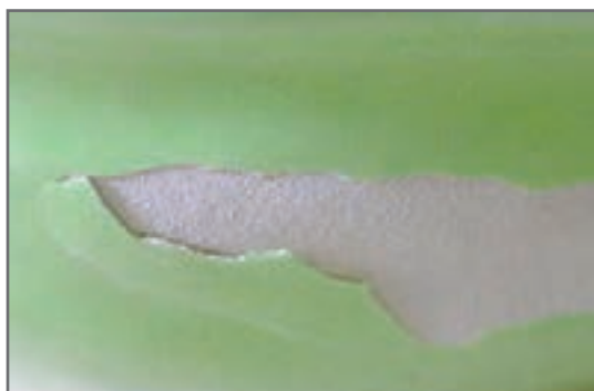
شکل ۲۷- عیب پوسته شدن لعاب

عکس این مطلب هم ممکن است اتفاق بیفتد یعنی اگر ضریب انبساط بدنه خیلی بیشتر از لعاب باشد. هنگام سرد شدن نیز بدنه بیشتر منقبض می‌شود ولی لعاب انقباض کمتری دارد، اما اغلب اوقات بدنه انقباض خود را انجام می‌دهد و لعاب را در هم می‌فشرده که باعث چروکیدگی و پوسته شدن لعاب می‌شود و اگر میزان اتصال بین بدنه یا لعاب کم باشد و فشار وارده از آستانه تحمل لعاب بالاتر باشد لعاب از بدنه جدا شده و حتی ممکن است این پوسته‌ها با لمس کردن سطح لعاب به صورت قُلَس‌های نازکی جدا شوند.