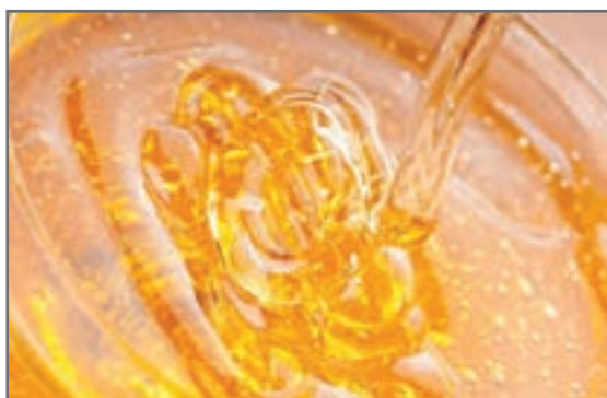
شکل ۳۳- عسل

عیب ته‌سوزنی هنگام خروج گازها و در زمان پخت بروز می‌کند، زیرا لعاب سیالیت کافی را ندارد تا اجازه خروج به گازها را بدهد. برای درک بهتر چنین لعابی می‌توان آن را شبیه به عسل در نظر گرفت، در صورتی که لعاب در دمای پخت این‌گونه باشد حتی اجازه خروج حباب‌های گازهای مختلف که به هنگام حرارت دیدن لعاب ایجاد می‌شوند را نخواهد داد و در نتیجه سطح لعاب جوش‌دار خواهد شد.