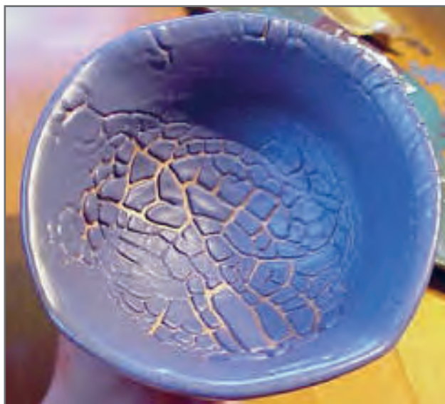
شکل ۲- عیب خزیدگی لعاب

در فرایند لعاب‌کاری، آماده‌سازی قطعات جهت اعمال لعاب از اهمیت بالایی برخوردار است. عدم آماده‌سازی صحیح قطعات برای اعمال لعاب می‌تواند منجر به بروز عیوب مختلفی مانند عیب خزیدگی ۱ لعاب در قطعه ۲ نهایی شود که بر روی کیفیت و ارزش محصول نهایی تأثیر بسزایی دارد.