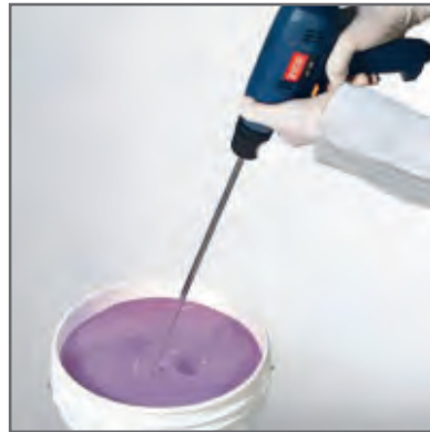
۱ مخلوط کردن لعاب با استفاده از همزن