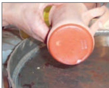
شکل ۶- آغشته کردن پایه لیوان به پارافین

اگر قطعات سرامیکی دارای چند جزء باشند مانند قندان، محل اتصال دو جزء قطعه، با استفاده از موم پوشش داده می شود تا در حین پخت لعاب و بر اثر ذوب شدن لعاب به یکدیگر نچسبند.