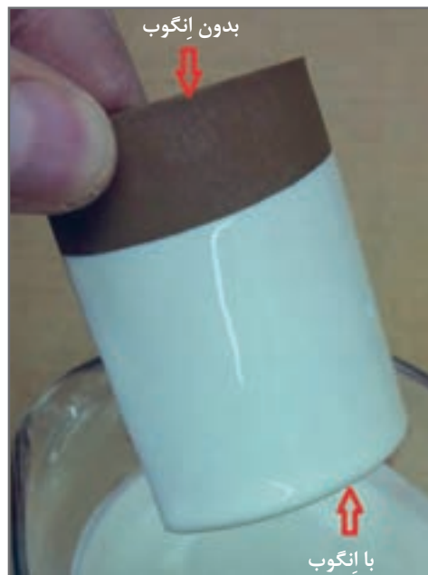
شکل ۸- قطعه بدون انگوب و بعد از اعمال انگوب

بعد از این مرحله می‌توان لعاب را با استفاده از روش‌های مختلف بر روی قطعه مورد نظر اعمال کرد.