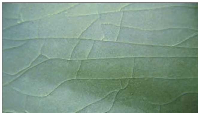
شکل ۲۶- عیب ترک برداشتن لعاب

در محیط اطراف همواره شاهد انبساط اجسام مختلف در اثر گرم شدن و انقباض آنها در اثر سرد شدن بوده‌ایم. میزان این انبساط و انقباض نیز برای اجسام و مواد مختلف متفاوت است. یک فراورده لعاب خورده را در نظر بگیرید، بدنه و لعاب اعمال شده، هر کدام از مواد مختلف تشکیل شده‌اند و هر کدام ضریب انبساط حرارتی مختلفی دارند. بعد از اینکه مرحله پخت در کوره انجام شد، به هنگام سرد شدن هم لعاب و هم بدنه منقبض خواهند شد و اگر میزان انقباض آنها با یکدیگر، تفاوت زیادی داشته باشد، عیوب ترک خوردن یا پوسته شدن به وجود می‌آیند. اگر انقباض لعاب بیشتر از بدنه باشد چون لعاب و بدنه بعد از پخت کاملاً به هم متصل شده‌اند، بدنه اجازه انقباض آزادانه به لعاب را نخواهد داد، در این حالت لعاب تمایل به جمع شدن و انقباض دارد، ولی بدنه آن را به سمت خود می‌کشاند و اجازه جمع شدن به لعاب نمی‌دهد و اگر میزان این کشش از استحکام لعاب بالاتر باشد، لعاب تسلیم شده و در نهایت لعاب ترک خواهد خورد.