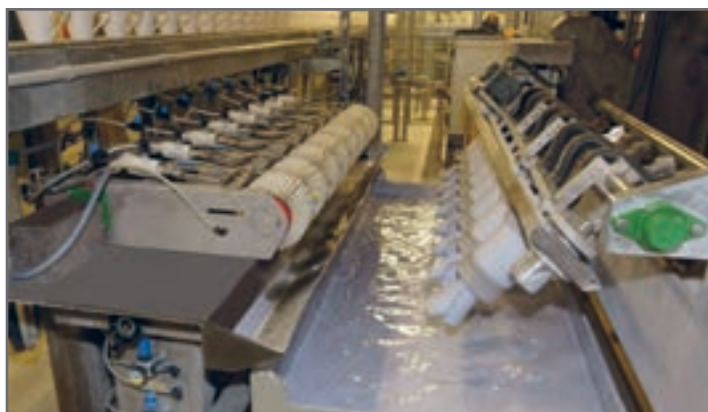
شکل ۲۰- لعاب‌زنی ماشینی