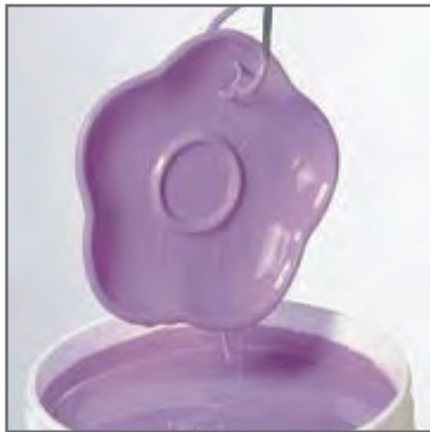
۴ خارج کردن قطعه