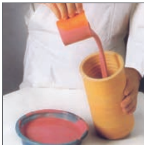
پر کردن داخل قطعه از لعاب