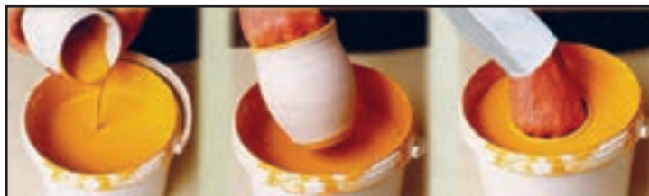
شکل ۱۹- لعاب‌زنی دستی و کارگاهی

با استفاده از دستگاه‌های پیشرفته امکان مکانیزه کردن فرایند غوطه‌وری وجود دارد. این روش برای ایجاد پوشش داخلی ظروف میان‌تهی تا حدودی موفق بوده است.