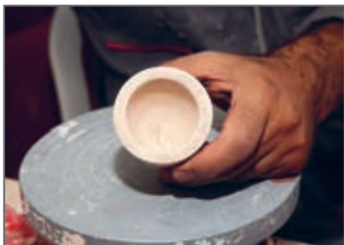
شکل ۳- بدنه‌های سرامیکی حاوی گرد و غبار

پاک کردن گرد و خاک ممکن است باعث شود که گرد و غبار در خلل و فرج قطعه نفوذ کند، همچنین بدنه آغشته شده به مواد روغنی باید به دقت با مواد پاک کننده شست و شو شده و قبل از استفاده کاملاً خشک شود. با حرارت دادن نیز می‌توان روغنی که بر روی قطعه برجا مانده را حذف کرد.