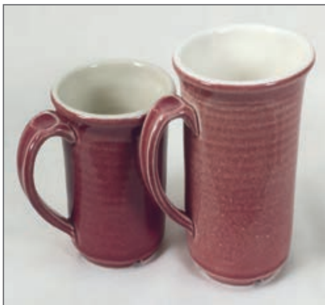
شکل ۲۵- لعاب با دمای پخت نامناسب

نامناسب بودن دمای حرارت پخت باعث بروز عیوب می‌شود. لعابی که در درجه حرارت پایین‌تر از حد لازم پخته شود زبر و خشن است و دارای درخشندگی و براقیت لازم در سطح نیست. این عیب را می‌توان با حرارت دادن مجدد قطعه و رساندن به حرارت کافی از بین برد. برعکس این حالت هنگامی که لعابی که بیش از حد حرارت داده شود دچار سوختگی می‌شود که رنگ آن با لعاب معمولی تفاوت محسوسی دارد و نازک و براق است و اغلب از سطح ظرف شره می‌کند. البته گاهی اوقات لعاب سوخته ظاهر زیبایی به خود می‌گیرد.