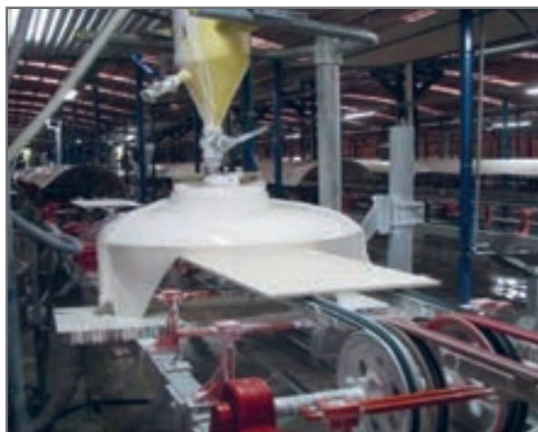
شکل ۲۳- لعاب‌زنی به روش آبشاری

در این روش یک بخش متحرک دیسکی مانند وجود دارد که بدنه از زیر آن حرکت می‌کند و لعاب از سوراخ‌های موجود بر روی دیسک به روی بدنه ریخته می‌شود. در این روش با تغییر سرعت دیسک می‌توان وزن لعاب اعمالی بر روی سطح مورد نظر و ضخامت لعاب را تغییر داد.