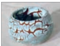
شکل ۳۰- عیب لعاب نگرفتگی

در صورتی که لعاب به هنگام پخت، خاصیتی شبیه به جیوه از خود نشان دهد و خود را جمع کند، عیب جمع شدگی لعاب رخ می‌دهد.