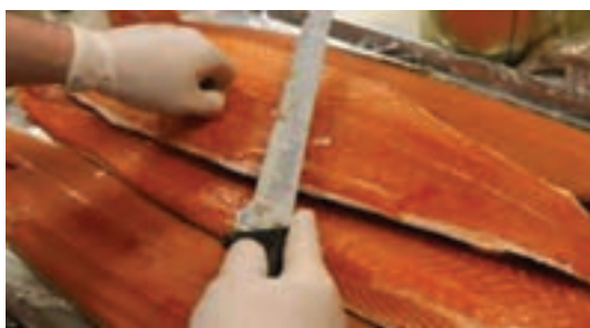
شکل ۱۱- فیله کردن گوشت ماهی