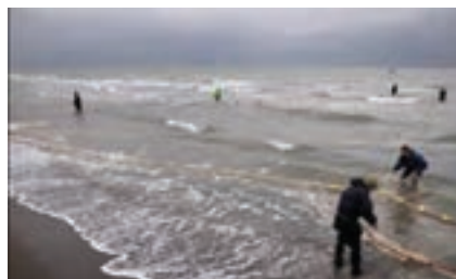
شکل ۲- صید میگو