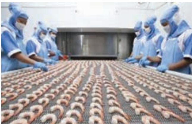
شکل ۱۳- بازرسی میگو

۹- بازرسی مجدد: در این مرحله میگوها روی نوار نقاله از نظر بقایای پوست و روده و تمیز بودن، بازرسی مجدد می شوند (شکل ۱۳).