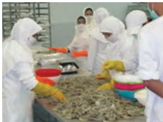
شکل ۱۴- توزین و قرار دادن در ظرف

۱۰- غوطه‌وری در محلول ترکیبات گوگرددار: میگوهای شسته شده در یکی از محلول‌های متابی سولفیت سدیم یا سولفیت سدیم یا متابی سولفیت پتاسیم یا سولفیت پتاسیم غوطه‌ور می‌شوند. پس از پایان عملیات باید میزان باقی‌مانده مجاز این مواد در محصول باید استاندارد باشد. ۱۱- توزین و قرار گرفتن در ظرف: میگوها با وزن مشخص توزین شده و داخل ظروف مناسب قرار داده می‌شوند (شکل ۱۴).