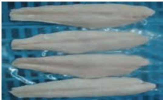
بسته بندی با سلوفان