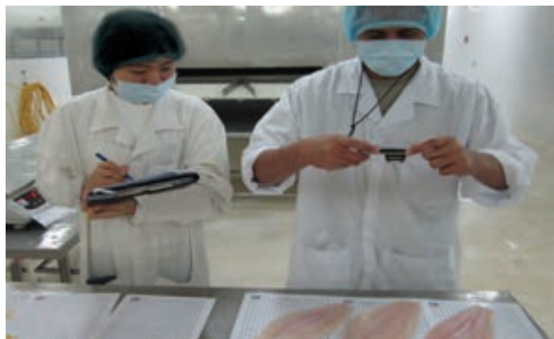
شکل ۱۷- کنترل کیفیت نهایی ماهی

- برای نمونه‌برداری از پوست ماهی با سوآپ نقاط مختلفی از پوست ماهی با استفاده از الگو مشخص می‌شود. سپس سوآپ سترونی را که با محلول رقیق کننده مرطوب شده است روی سطح مشخص شده مالیده و درون لوله حاوی ۵ میلی لیتر آب پپتونه ۰/۱ درصد فرو می‌کنند. در نهایت سر سوآپ را از قسمت اتصال آن به دسته بریده به‌طوری