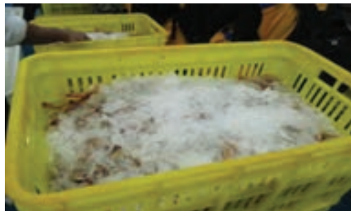
شکل ۸- نگهداری میگو در یخ