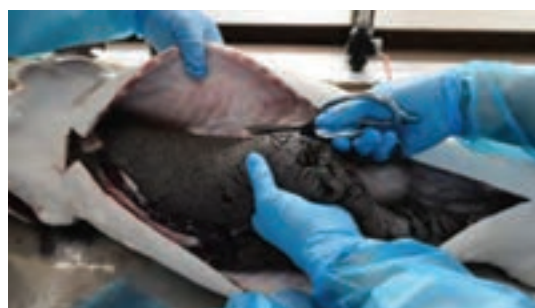
شکل ۸- اشپل ماهی