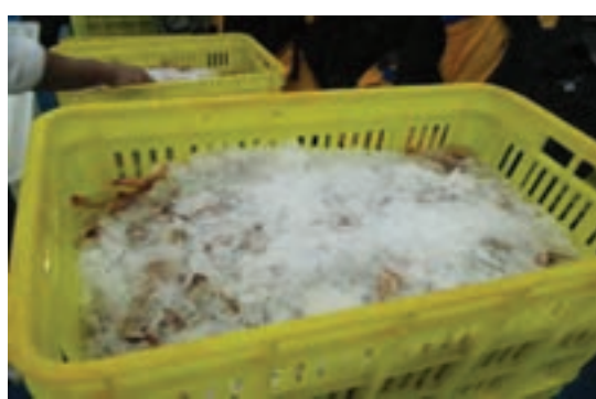
شکل ۳- نگهداری میگو در یخ

جعبه‌ها نباید بیش از حد پر شوند چون سنگینی حین حمل و نقل باعث بروز فشار به میگوها و آسیب به آنها می‌شود.