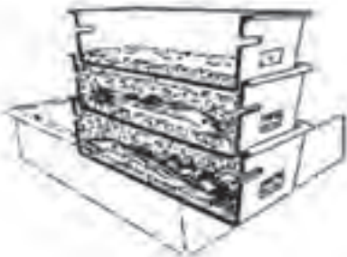
شکل ۶- نگهداری در جعبه

یخ می‌ریزند و در نهایت یک لایه یخ به ارتفاع ۵ سانتی‌متر روی آنها می‌ریزند. نباید بین ماهی و جعبه، تماس مستقیم وجود داشته باشد. جعبه‌ها نباید به‌طور مستقیم روی کف اتاق نگهداری ماهی قرار داده شوند و باید از زمین فاصله داشته باشند. این روش بهتر از ۲ روش دیگر کیفیت محصول را حفظ می‌کند.