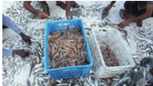
شکل ۵- درجه‌بندی میگو

اگر میگوها بر روی عرشه کشتی در معرض نور خورشید قرار گیرند، به سرعت و در مدت چند ساعت فاسد می‌شوند.