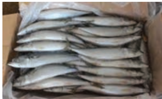
بسته بندی کارتنی