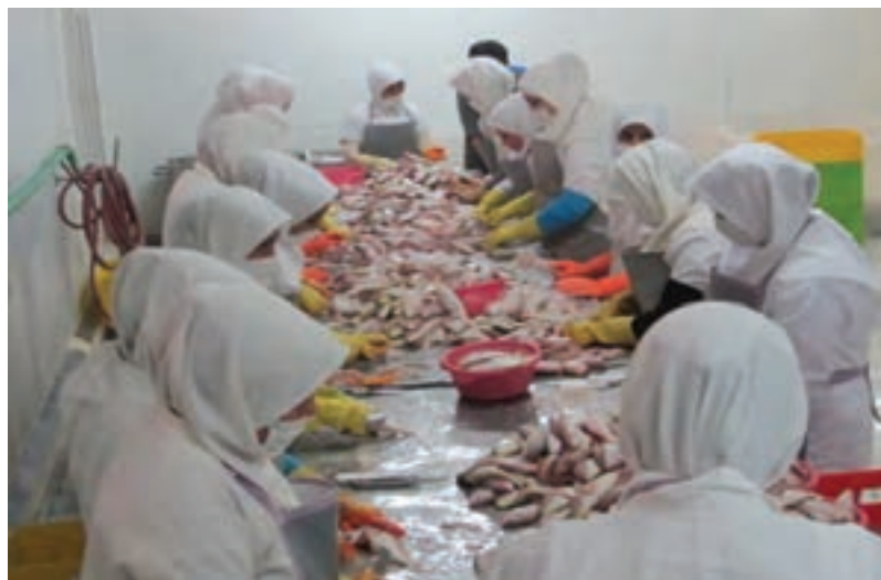
شکل ۷- شست‌وشو و تمیز کردن ماهی

تخلیه اندرونه شکمی: در این مرحله ابتدا ماهی‌ها را به محل ویژه تخلیه شکم هدایت می‌کنند. کارگر باید هر ماهی را با یک دست به‌طور ثابت نگه داشته و سپس با دست دیگر با استفاده از یک کارد تیز و یا اهر، یک برش طولی و سراسری بر روی خط میانی شکم، در راستای درازای بدن ماهی، از ناحیه گلو تا مخرج ایجاد کند و محتویات درون شکم را تخلیه نماید به گونه‌ای که تنها ماهیچه و اسکلت بدن آن باقی بماند. اجزای محوطه شکمی، که از لاشه خارج می‌شوند شامل روده‌ها، معده، بادکنک، کبد، کلیه‌ها، قلب، تخمدان‌ها (ماهی ماده) و بیضه‌ها (ماهی نر) و غدد مترشحه داخلی هستند. این کار باید به روش درست و بهداشتی با بهره‌گیری از ماشین‌آلات یا با فشار دست کارگر انجام شود.