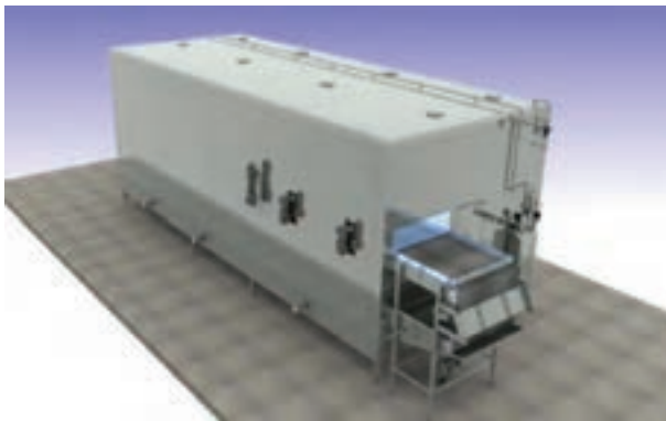
شکل ۱۹- تونل انجماد

در اتاق انجماد، فضا مکعب مستطیل است و کناره‌ها و وسط اتاق، قفسه‌بندی شده است. در اتاق انجماد همیشه فضایی را برای رفت و آمد کارگران و همچنین گردش هوا، بدون قفسه‌بندی می‌گذارند که «فضای مرده سردخانه» نامیده می‌شود. در این اتاق‌ها به علت کم بودن سرما و عدم وزش باد، محصول انجماد کند دارد و شکستگی سلول‌ها در اثر انجماد کند به وقوع می‌پیوندد.