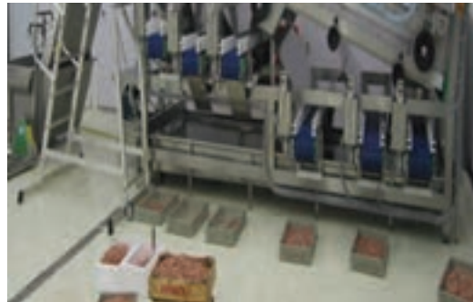
شکل ۱۱- درجه بندی میگو

۷- سرزنی، پوست و روده گیری: در این مرحله سر، پوست و روده میگوها با دست و یا دستگاه جدا می شوند (شکل ۱۲).