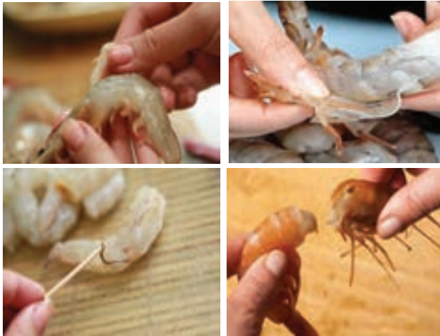
شکل ۱۶- پوست گیری و سرزنی

با فشار چرخشی، پوست جدا می شود (شکل ۱۶). البته در اکثر کارخانه ها سرزنی و پوست گیری با دستگاه انجام می شود. برای تمیز کردن میگو در صورتی که منجمد باشد باید آن را از حالت انجماد خارج نمود که با جریان ملایم آب سرد هم می توان این کار را انجام داد. در مورد میگوی پرورشی چون ۴۸ ساعت قبل از برداشت تغذیه نمی شوند روده آنها خالی است و به همین دلیل بر طول عمر نگهداری آنها افزوده می شود.