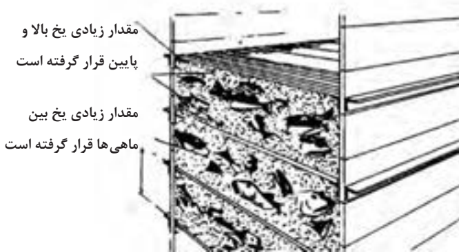
شکل ۴- نگهداری به صورت انباشته

را احاطه نموده است. زیرا در غیر این صورت ماهی ها با هم تماس پیدا می کنند و سرعت سرد شدن آنها کم می شود. عمق یا ارتفاع حوضچه یا طبقات نگهداری ماهی از ۴۰ سانتی متر نباید بیشتر باشد. زیرا ماهی در لایه های زیرین تحت فشار قرار گرفته و آسیب می بیند.