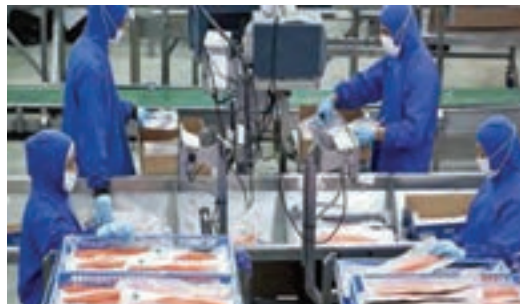
شکل ۱۳- کارخانه بسته بندی ماهی