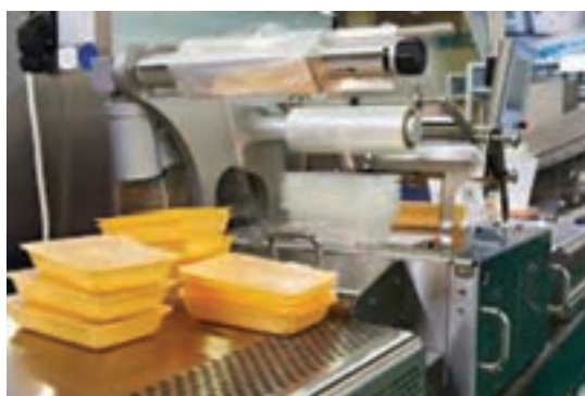
شکل ۱۵- بسته‌بندی در جعبه مادر

۱۴- نگهداری در سردخانه: جعبه‌های مادر پس از نشانه‌گذاری در حداقل دمای ۱۸- درجه سلسیوس، بر روی پالت مخصوص تا زمان عرضه به بازار در سردخانه نگهداری می‌شوند.