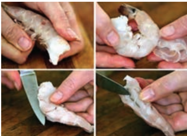
شکل ۱۲- پوست و روده گیری

۷- سرزنی، پوست و روده گیری: در این مرحله سر، پوست و روده میگوها با دست و یا دستگاه جدا می شوند (شکل ۱۲).