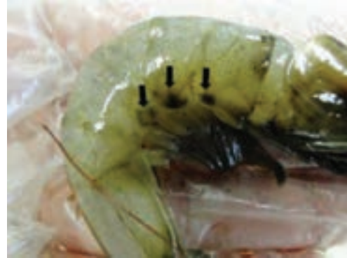
شکل ۴- لکه سیاه