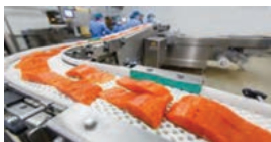
شکل ۱۲- استیک ماهی

ماهی تازه خنک‌شده را می‌توان به شکل‌های زیر، بنا به نیاز بازار و تقاضای مصرف‌کنندگان، با رعایت مقررات و ضوابط بهداشتی، عرضه نمود: ماهی کامل، ماهی شکم خالی، ماهی شکم خالی سر زده، ماهی شکم خالی سر و دم زده، ماهی پوست‌کنده، شقه ماهی، فیله ماهی، استیک ماهی، ماهی کبابی و خمیر ماهی