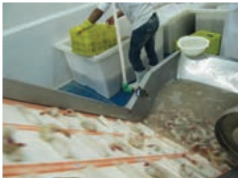
شکل ۷- شست‌وشوی اولیه

۲- شست‌وشوی اولیه: میگوهای دریافت شده در آب کلرینه (با کلر باقی‌مانده حداکثر ۳ میلی‌گرم در لیتر) در مخازن مخصوص با پمپاژ و فشار زیاد آب شست‌وشو شده تا همه اجسام خارجی و همچنین یخ از محصول جدا شوند (شکل ۷).