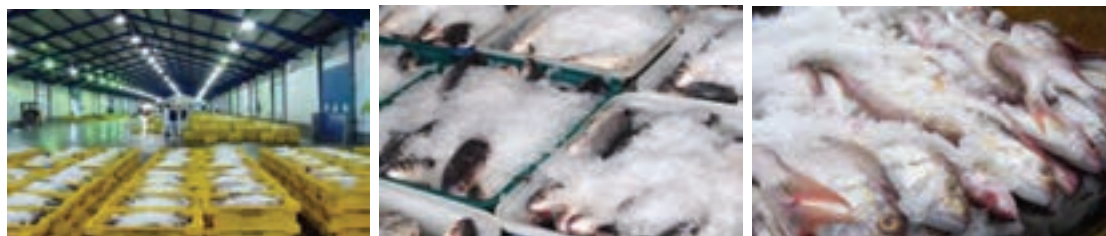
شکل ۳- نگهداری ماهی در یخ

۲ یخ هنگامی که ذوب می‌شود به‌طور مداوم باکتری‌ها، خون و مواد لزج را از سطح بدن ماهی شسته، در نتیجه آلودگی‌های سطحی را نیز تا حد زیادی کاهش می‌دهد.