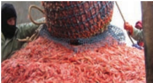
شکل ۶- تخلیه میگو روی عرشه

آماده‌سازی و نگهداری میگو در عرشه پس از صید مهم است زیرا فعالیت شدید سیستم آنزیمی در بدن میگو و شرایط آب و هوایی مناطق صید محصول، آن را مستعد تغییرات سریع شیمیایی پس از صید کرده و سبب کاهش سریع کیفیت محصول در شرایط نامساعد می‌شود. از این‌رو آماده‌سازی اولیه و سرد کردن سریع محصول پس از صید، مهم‌ترین مرحله عمل‌آوری محسوب می‌شود. در شرایط معمول و در پایان عملیات، تور از آب خارج شده و میگوهای صید شده در عرشه تخلیه می‌شود. در این حال عمل جداسازی میگوها از سایر آبزیان و نوعی درجه‌بندی اولیه به‌صورت دستی صورت می‌گیرد، سپس میگوها با آب دریا شسته می‌شوند و در صورت لزوم سر آنها به سرعت توسط کارگران عرشه با دست جدا شده و سپس میگوها درون سبدهای مخصوص ریخته و مجدداً با آب دریا شست‌وشو می‌شوند.