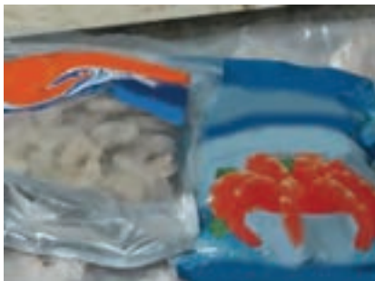
شکل ۱۷- ظروف بسته‌بندی میگو