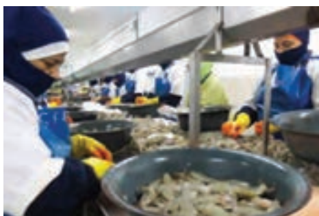
شکل ۱۰- بازرسی میگو

۴- شست‌وشو با آب سرد: میگوها در این مرحله، با آب سرد (با حداکثر دمای ۴ درجه سلسیوس) شست‌وشو می‌شوند (شکل ۹).