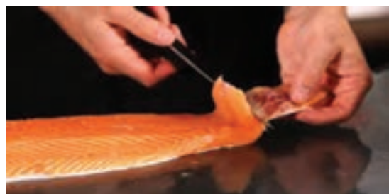
شکل ۹- پوست کنی ماهی

پوست کنی ماهی: تنها بعضی از گونه های ماهی پوست کنی می شوند و در برخی دیگر فقط فلس های پوشش بدن ماهی کنده شده و برداشته می شوند (شکل ۹).