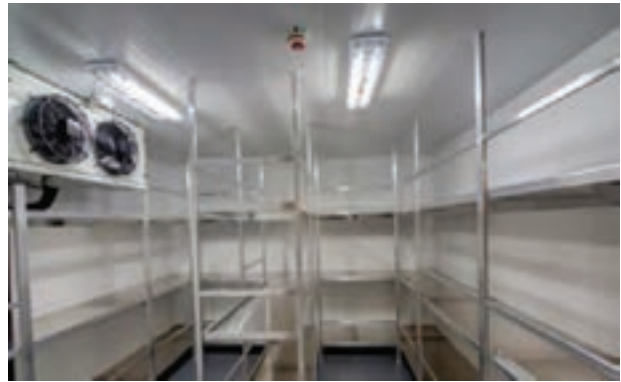
شکل ۱۸- اتاق انجماد

۲- انجماد با تماس غیرمستقیم (پلیت فریزر): انجماد غیرمستقیم معمولاً در فریزرهای صفحه‌ای انجام می‌شود. در این فریزرها محصول روی صفحات فلزی که از داخل آنها مبرد عبور می‌کند، قرار می‌گیرد. در این روش چون محصول در تماس مستقیم با صفحه سرد شونده است، انتقال عمده حرارت از محصول به طریقه هدایت انجام می‌شود و راندمان انجماد تا حد زیادی به سطح تماس بستگی خواهد داشت. این روش به ویژه در مواردی که مقدار محصول منجمدشونده کم باشد مناسب است.