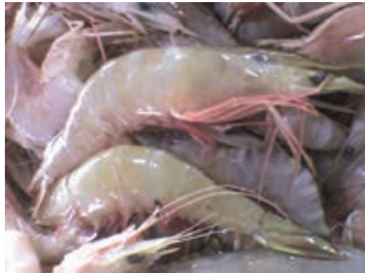
شکل ۱- میگو