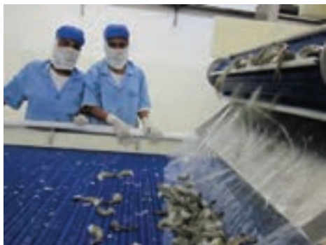
شکل ۹- شست‌وشو با آب سرد

۴- شست‌وشو با آب سرد: میگوها در این مرحله، با آب سرد (با حداکثر دمای ۴ درجه سلسیوس) شست‌وشو می‌شوند (شکل ۹).