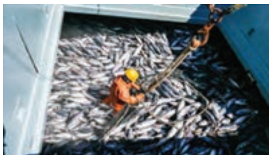
شکل ۲- صید ماهی

نگهداری پس از صید، منجر به تسریع فساد ماهی می‌شود.