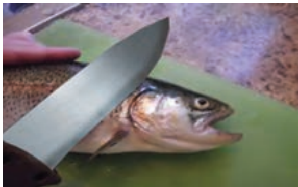
شکل ۱۰- قطع کردن سر ماهی

قطع سر و دم ماهی: برای انجام این کار باید ماهی را در برابر خود به پهلو قرار داد به گونه‌ای که سر ماهی سمت چپ و دم آن سمت راست باشد. سپس ناحیه سر را با یک دست ثابت نگه داشته و با دست دیگر، ایجاد