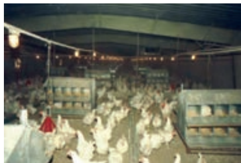
تصویر ۸-۳- استفاده از لانه‌ی مرغداری به تعداد کافی

این افراد برای ورود باید لباس خود را تعویض کنند و پس از گرفتن دوش و پوشیدن لباس کار، با چکمه‌های خود از داخل ماده‌ی ضدعفونی‌کننده عبور نمایند. کارکنان واحد جوجه‌کشی نباید در مرغداری‌ها شاغل باشند و یا در خانه‌ی خود از پرندنگه‌داری کنند. هم‌چنین برای رعایت بهداشت فردی باید به‌طور منظم به پزشک مراجعه کنند.