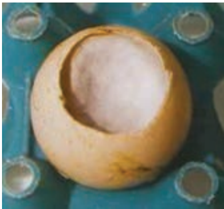
تصویر ۱-۳- آلودگی قارچی

بیماری‌ها و تلفات در چند روز اول، بعد از خروج جوجه از تخم مرغ، نیز اغلب با فساد باکتریایی ارتباط دارند. هم‌چنین فساد باکتریایی سبب کاهش میزان جوجه درآوری است. بنابراین، تخم مرغ‌های جوجه‌کشی که به شدت به میکرب‌ها آلوده‌اند، مشکلات زیادی در واحدهای جوجه‌کشی ایجاد می‌نمایند. از این رو لازم است در ابتدای ورود تخم مرغ‌ها به واحد جوجه‌کشی به اتاق‌های گاز انتقال یابند و ضدعفونی شوند.