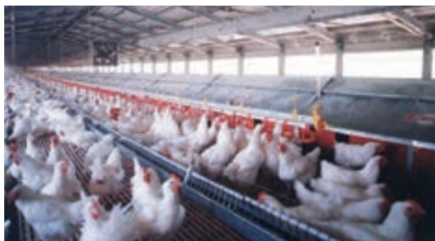
تصویر ۳-۷- لانه‌ی تخم‌گذاری اتوماتیک