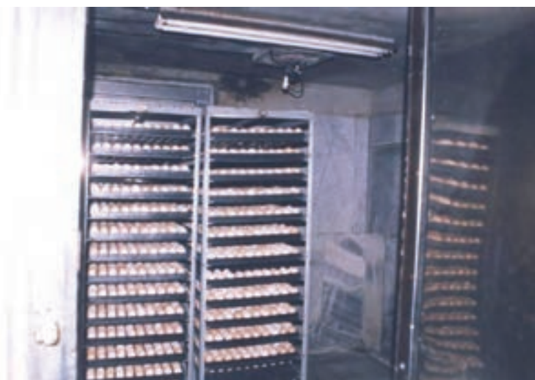
تصویر ۲-۳- تخم مرغ‌ها در اتاق دود

مقادیر فرمالین و پرمنگنات پتاسیم ذکر شده در جدول برای ۲/۸ متر مکعب فضاست.