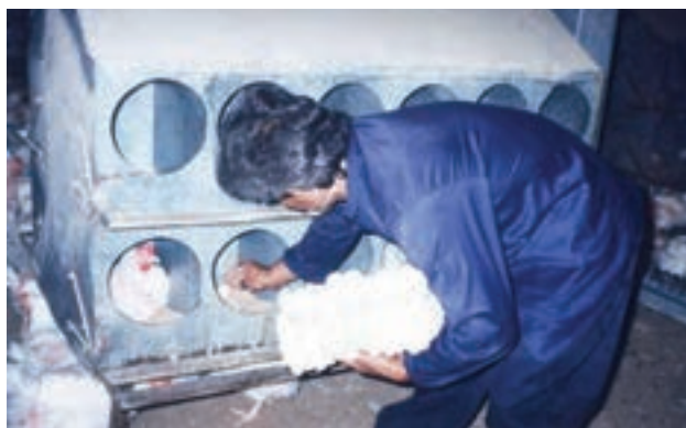
تصویر ۳-۶- جمع‌آوری دستی تخم مرغ