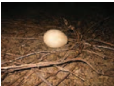
تصویر ۷-۲- تخم غاز