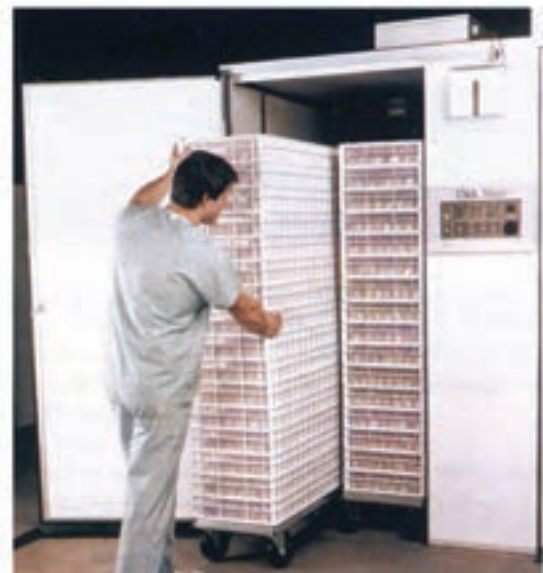
تصویر ۴-۲- انواع دستگاه تفریخ