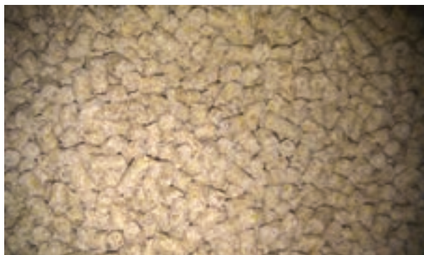
شکل ۹-۲ کنجاله سویا

مقدار انرژی کنجاله سویا ۲۲۳۰ کیلوکالری و پروتئین آن ۴۴ درصد است. مقدار کلسیم و فسفر کنجاله سویا ۲۹٪ و ۲۷٪ درصد است.