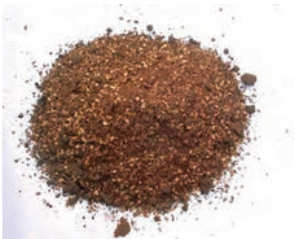
شکل ۱۳-۲ کنجاله کنجد

مقدار انرژی قابل سوخت و ساز و پروتئین کنجاله کنجد ۲۲۱۰ کیلو کالری و ۴۳ درصد است. مقدار کلسیم و فسفر قابل استفاده ۱/۹۹ و ۳۴/۰ درصد است.