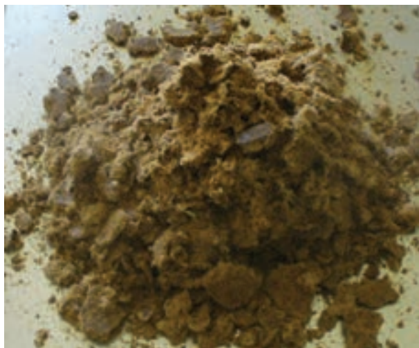
شکل ۱۲-۲ کنجاله تخم پنبه

درصد و فسفر قابل استفاده آن ۳/۰ درصد است.