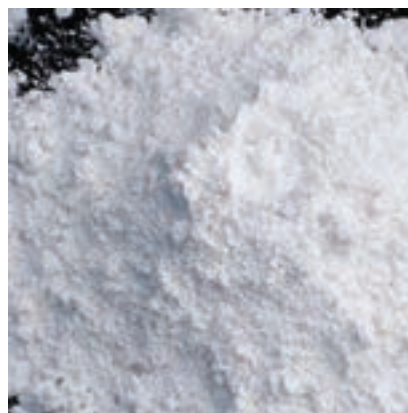
شکل ۱۷-۲- کربنات کلسیم

ممکن است به طور طبیعی سنگ آهک حاوی فلزات سنگین باشد، که تولیدکنندگان موظف‌اند این محصول را از این نظر تضمین کنند.