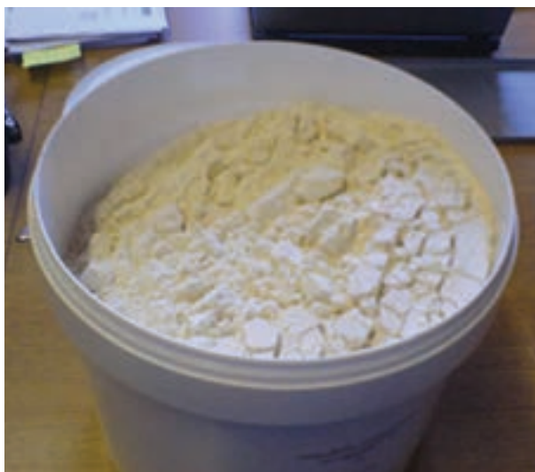
شکل ۱۵-۲- پودر آب پنیر خشک شده

کلسیم است، در جیره طیور استفاده می‌شود. این ماده را از معادن سنگ آهک استخراج می‌کنند. پس از آسیاب کردن و به صورت پودر درآمدن از آن می‌توانید استفاده کنید. مقدار کلسیم