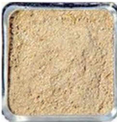
شکل ۸-۲- سبوس برنج

الیاف غیر قابل هضم (فیبر) و متغیر بودن ترکیب این خوراک ممکن است استفاده از آن را در خوراک طیور محدود کند. همچنین به دلیل وجود روغن و آنزیم‌های تجزیه‌کننده چربی، مستعد فساد است و آن را نمی‌توان زیاد نگهداری کرد.