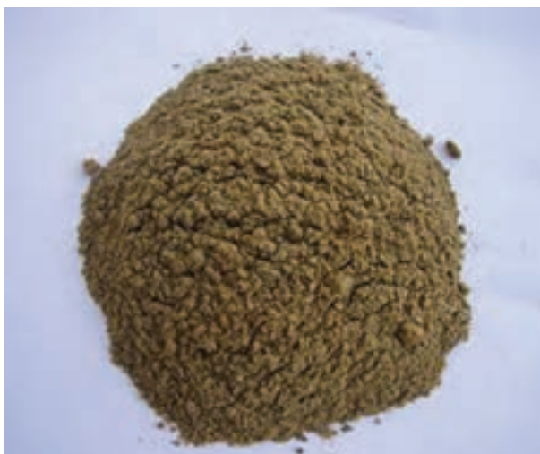
شکل ۱۴-۲- پودر ماهی

صدف (گوش ماهی) و آسیاب کردن آن به دست می‌آید. صدف منبع بسیار خوبی از کلسیم است. از صدف غالباً در جیره مرغ‌های تخم‌گذار، که احتیاج بیشتری به کلسیم دارند، می‌توانید استفاده کنید. در جیره جوجه‌های در حال رشد نیز می‌توانید از آن به مقدار کم و به صورت پودر استفاده کنید. مقدار کلسیم پوسته صدف ۳۸ درصد است.