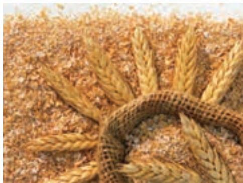
شکل ۷-۲- سبوس گندم

کنجاله سویا : کنجاله سویا منبع پروتئینی استاندارد است که سایر منابع پروتئینی در جهان را با آن مقایسه می‌کنند. این محصول حاوی انرژی و پروتئین بالا و ترکیب اسید آمینه آن برای