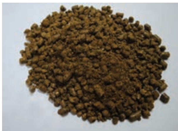
شکل ۱۱-۲ کنجاله کلزا (کانولا)

کنجاله تخم پنبه: کنجاله تخم پنبه فرآورده باقیمانده از روغن کشی تخم پنبه است. تخم پنبه دارای گوسیپول است که در گله های تخم گذار اهمیت دارد، زیرا در سفیده و زرده تخم مرغ ایجاد رنگ می کند. به هنگام استفاده از کنجاله تخم پنبه در جیره، تغییر رنگ زرده را به صورت لکه های سبز تا سیاه، بسته به مدت زمان انبارداری آن، مشاهده خواهید کرد.