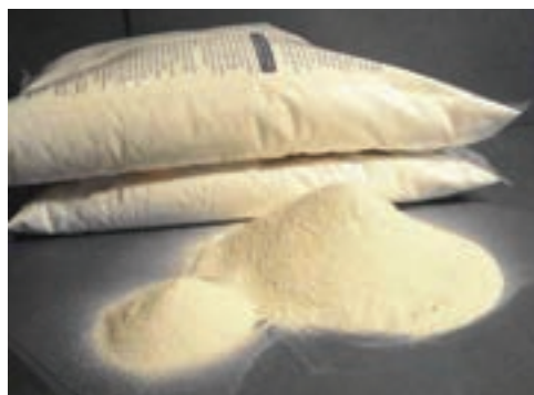
شکل ۱۸-۲- دی کلسیم فسفات

مقدار کلسیم و فسفر دی کلسیم فسفات ۲۲ و ۱۸/۷ درصد است و مقدار کلسیم و فسفر منو کلسیم فسفات ۱۶ و ۲۱ درصد است.