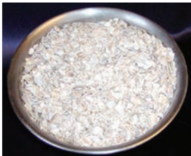
شکل ۱۶-۲- پوسته صدف

شیر رسوب داده می‌شود و جدا می‌گردد و همراه آن بخش عمده چربی و تقریباً نیمی از کلسیم و فسفر موجود در شیر هم گرفته می‌شود. مایعی که بعد از این مراحل تولید می‌گردد آب پنیر نامیده می‌شود. تنها مقدار کمی از این ماده خوراکی برای مصرف در جیره‌های طیور مناسب است، زیرا نمک در پودر آن به میزان بالایی وجود دارد.