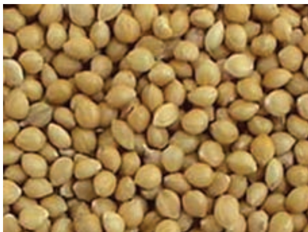
شکل ۲-۶- دانه ارزن

ارزن: میزان انرژی ارزن بالاست، اما قبل از مصرف باید عمل آوری شود. به علت داشتن مقدار بالایی از لیاف غیر قابل هضم، باید از استفاده آن در تغذیه پرندگان جوان اجتناب کرد. مقدار انرژی قابل سوخت و ساز و پروتئین ارزن حدود ۲۷۰۰ تا ۲۹۰۰ کیلوکالری و ۱۱ تا ۱۴ درصد در واریته‌های مختلف است.