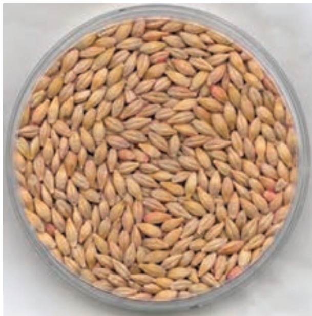
شکل ۳-۲- دانه جو