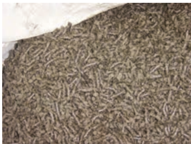
شکل ۱۰-۲ کنجاله آفتاب گردان

تنها محدودیت مصرف کنجاله آفتاب گردان ملین بودن آن (هنگام مصرف بیش از اندازه) است. همچنین هنگام ذخیره در انبار، به دلیل داشتن روغن، کنجاله آفتاب گردان اکسیده و فاسد خواهد شد.