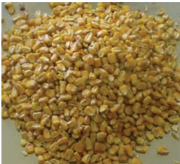
شکل ۱-۲- دانه ذرت

استفاده آن ۸٪ درصد است. اگر از ذرت به مقدار زیاد و برای مدت طولانی در جیره طیور استفاده شود، به دلیل گزانتوفیل (رنگ دانه زرد) موجود در آن، چربی لاشه زرد می شود.