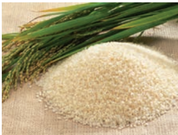
شکل ۲-۵- دانه برنج

برنج دارای مقدار زیادی بازدارنده تریپسین است که با حرارت معمولی از بین می‌رود.