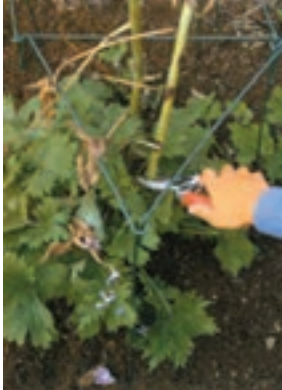
شکل ۵-۹- الف