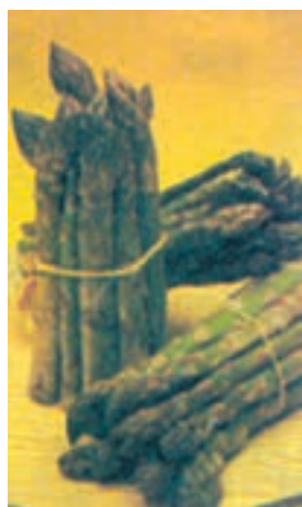
شکل ۸-۲- مارچوبه