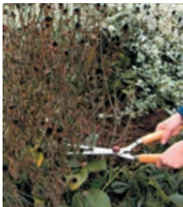
شکل ۵-۹- ج