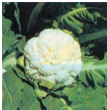
شکل ۸-۱- گل کلم

پاره‌ای از سبزیجات مانند کرفس، گل کلم، ریواس، مارچوبه و ... باید قبل از مصرف سفید گردند تا از نظر طعم و لطافت قابل استفاده شوند. برای این منظور باید به طرق مختلف از رسیدن نور خورشید به قسمت مورد نظر جلوگیری نمود که این عمل را «سفید کردن» می‌گویند (شکل‌های ۸-۱ و ۸-۲).