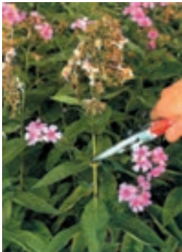
شکل ۵-۹- ب