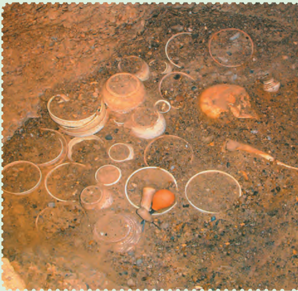
آثار یافت‌شده در شهر سوخته

پس از مدتی، زردشت که پیامبر ایران باستان است در میان ایرانیان ظهور کرد. او مردم را به پیروی از خدای یگانه که اهورامزدا نام داشت، دعوت کرد و مروج اندیشه، گفتار و کردار نیک بود. اعتقاد به سرای آخرت و جهان پس از مرگ، عقیده به آخرالزمان و ظهور یک منجی که حکومتی با عدل و داد و به‌دوراز ناپاکی و ستم برپا خواهد کرد، از بنیان‌های استوار و اعتقادی ایرانیان بوده است که آن‌ها را از سایر ملل دوران باستان متمایز می‌ساخت. ۲