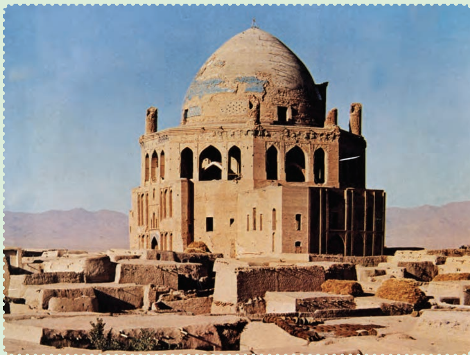
مقبره الجایتو، سلطانیه

چنگیزخان انجامید. این حادثه بهانه‌ای برای حمله به ایران بود. ۱ لشکرکشی مغولان یکی از بزرگ‌ترین راهپیمایی‌های نظامی تاریخ به‌شمار می‌رود. حدود ۲۵۰ هزار نفر از قبایل مغول، در سرمای سخت از سرزمین مغولستان در شمال چین، به فرماندهی تموچین (چنگیزخان) به سوی ایران سرازیر شدند. ۲ هدف نخستین آنها شهر اُترار بود، اما پس از قتل عام اهالی این شهر و دستگیری عاملان قتل بازرگانان، به سوی شهر بخارا و سایر ایالت‌های ایران پیشروی کردند. ۳ حمله مغول همچون طوفانی سهمگین، نه تنها طومار حکومت خوارزمشاهی را در هم پیچید، بلکه بیشتر شهرهای ایران را ویران و مظاهر تمدن باشکوه دوران اسلامی را نابود کرد. دامنه این تندباد، علاوه بر ایران، بخش‌های زیادی از جهان اسلام را نیز درنوردید. ۴