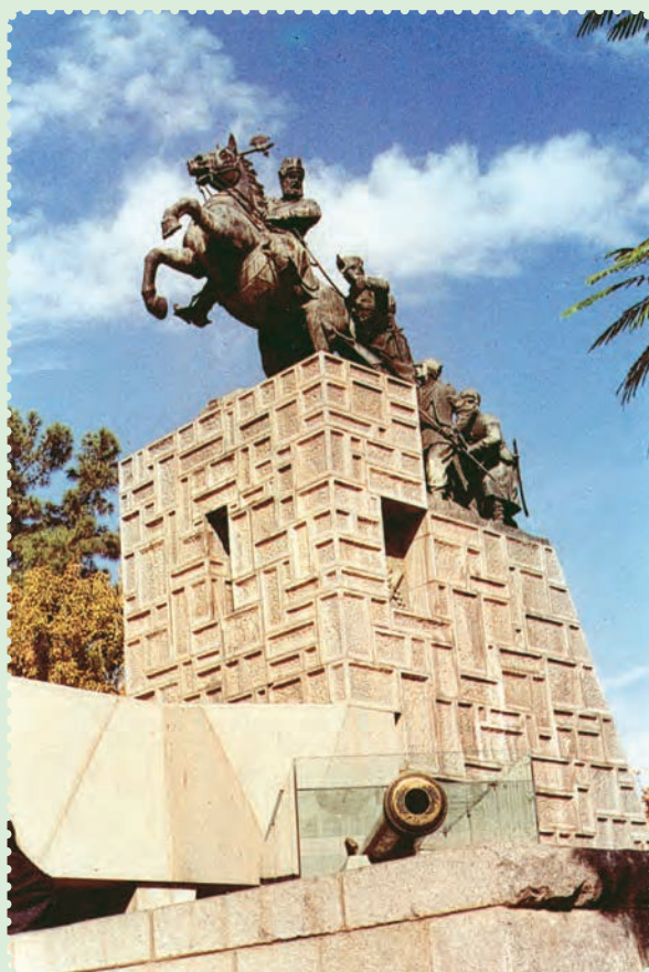
مجسمه و آرامگاه نادرشاه افشار در مشهد مقدس

توانست با شیوه حکومت داری توأم با ملاحظت، عدالت و رفاه نسبی، نام نیکی از خود بر جای بگذارد. ۱ وی تلاش کرد روابط خارجی ایران را که به دلیل هرج و مرج و نبود امنیت دچار اختلال شده بود، سامان بخشد، همچنین در برابر گسترش فعالیت‌های بازرگانی انگلستان در ایران ایستادگی کرد ۲ و از منافع نامشروع و استعماری این دولت جلوگیری به عمل آورد.