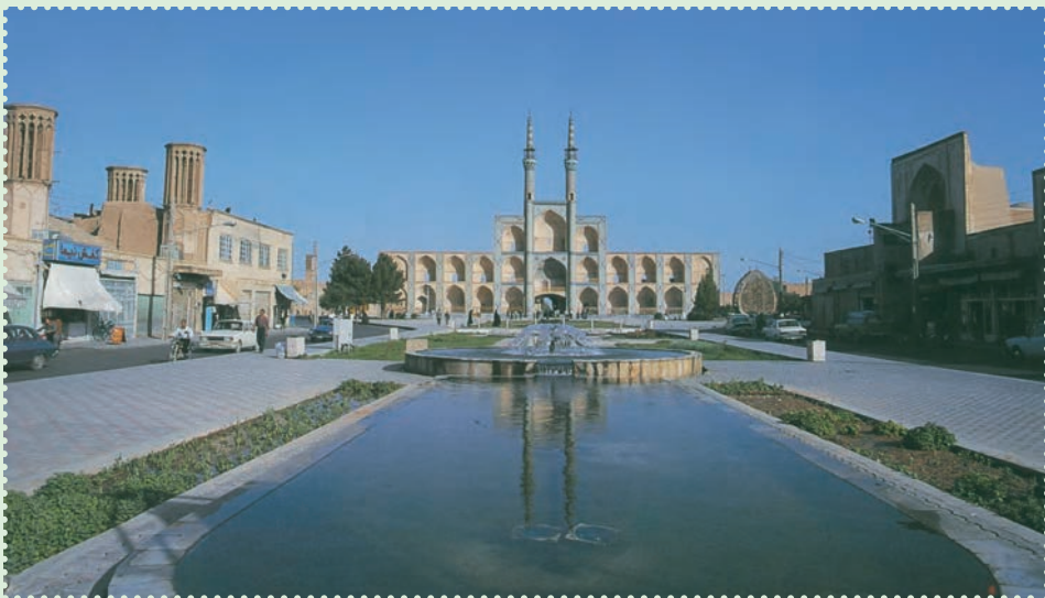
میدان تاریخی امیر چخماق در مرکز شهر یزد

با آنکه مغولان در آغاز ویرانی های بسیاری به همراه آوردند، ولی بر اثر آشنایی با فرهنگ ایران و اسلام، از طریق آنان فرهنگ، هنر و تمدن ایران و اسلام رواج یافت. پس از پایان حکومت ایلخانان، حکومت های ملوک الطوائفی و محلی متعددی چون تیموریان، آل جلایر، آل مظفر، سرداران و آل کرت، اتابکان، قراقویونلوها و آق قویونلوها طی قرن های هشتم و نهم قمری بر ایران حکومت کردند، اما هیچ کدام نتوانستند یکپارچگی ایران را حفظ کنند. سرانجام در سال ۹۰۷ق، حکومت صفوی توانست پس از