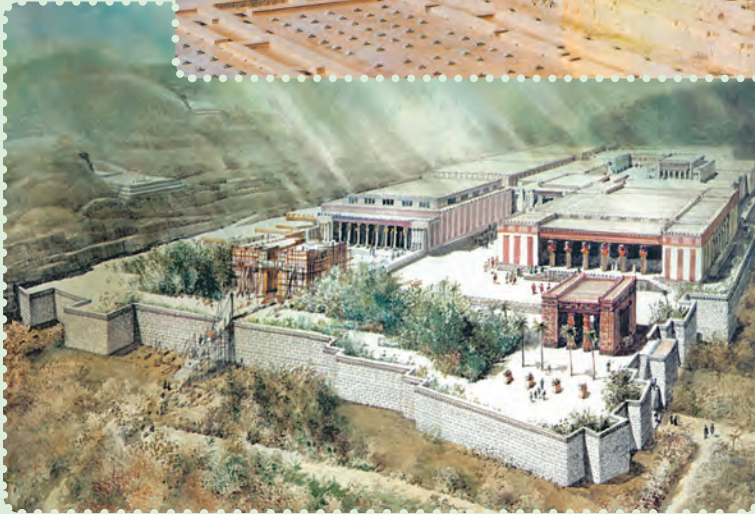
تخت جمشید و طرح خیالی آن

یافته است. ۱ برخی معتقدند، «ذوالقرنین» که در قرآن مجید ۲ به عنوان فرمانروایی نیک سیرت ستوده شده، همان کوروش پادشاه ایران است. ۳ با اینکه مؤسس دولت مقتدر هخامنشیان از سرزمین پارس