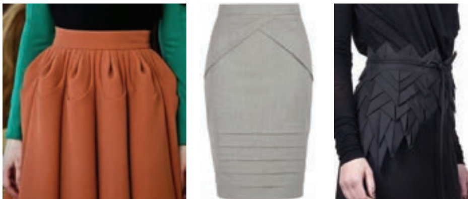
نمونه‌هایی از تصاویر خطوط ساختاری

خطوط دو دسته هستند. خطوط ساختاری و خطوط تزئینی. خطوط ساختاری به واسطه برش و دوخت ایجاد می‌شوند و زمانی بیشتر به چشم می‌آیند که پارچه لباس ساده باشد.