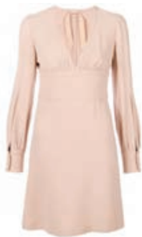
تصاویری از شکل و فرم در لباس