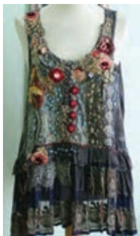
نمونه ای از خطوط تزئینی

خطوط تزئینی به واسطه اضافه کردن جزئیات، بر روی پارچه و لباس به وجود آمده و برای جذاب تر شدن لباس، اضافه می‌شوند مانند توردوزی، مغزی دوزی، ملیله و پولک دوزی، افزودن ردیف دکمه‌ها و ریشه‌های تزئینی که از نمونه‌های تزئینی در لباس هستند. مانند نمونه زیر.