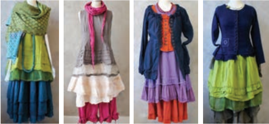
طرح رنگ‌های مختلف در لباس