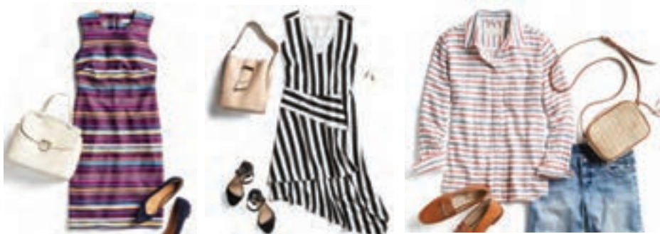
نمونه‌هایی از خطوط در لباس

از کنار هم قرار گرفتن نقطه‌ها، خطوط تشکیل می‌شوند. خطوط انواع مختلفی دارند مانند: مورب، موجدار، حلقه‌ای، زیگزاگ، ناهموار، شکسته، نازک، ضخیم، دندانه‌دار و... که هر کدام، تأثیرات بصری خود را ایجاد می‌نمایند. چیدمان خطوط نیز در طراحی لباس می‌تواند، نتایج بصری مختلفی را ایجاد کند. یعنی ممکن است فرد را لاغرتر و یا چاق‌تر از آنچه که هستند، نشان دهد.