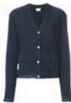
ژاکت کش بافت

برخی از روپوش‌ها، ایده‌های بسیاری را به طراحان لباس و مد ما داده، و باعث تنوع فراوانی، در مدل‌سازی‌های لباس شده‌اند. مانند نمونه‌های تصاویری که در جدول نشان داده‌ایم.