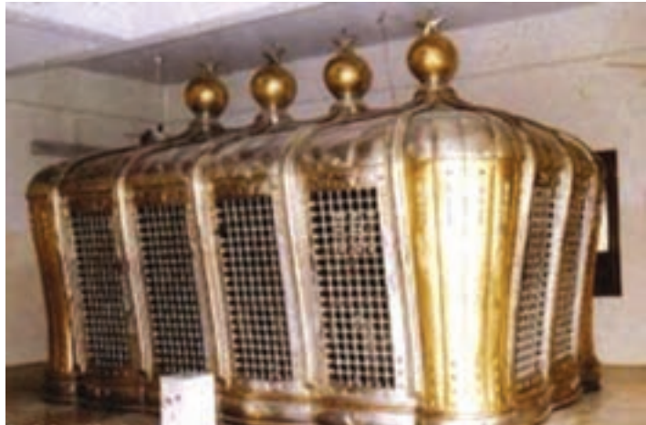
بارگاه و ضریح امامان شیعه در قبرستان بقیع پیش از تخریب