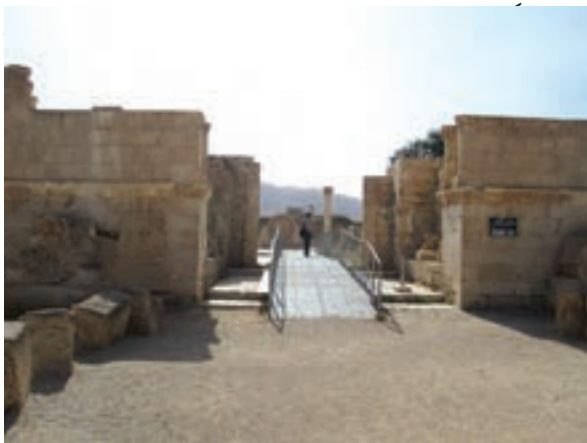
بقایای کاخ هشام بن عبدالملک در اربعا

درباره ارتباط مشروعیت و مقبولیت نداشتن حکومت‌ها با توسل آنها به زور و خشونت گفت‌وگو نمایید.