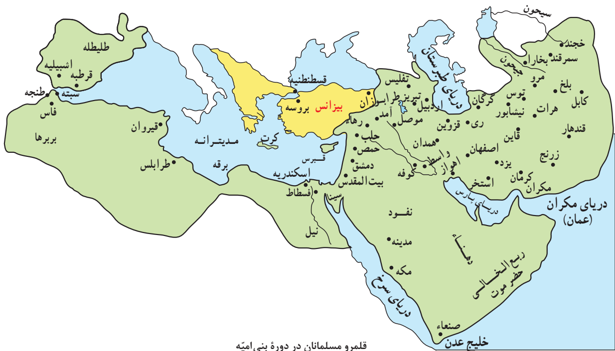
قلمرو مسلمانان در دوره بنی امیه