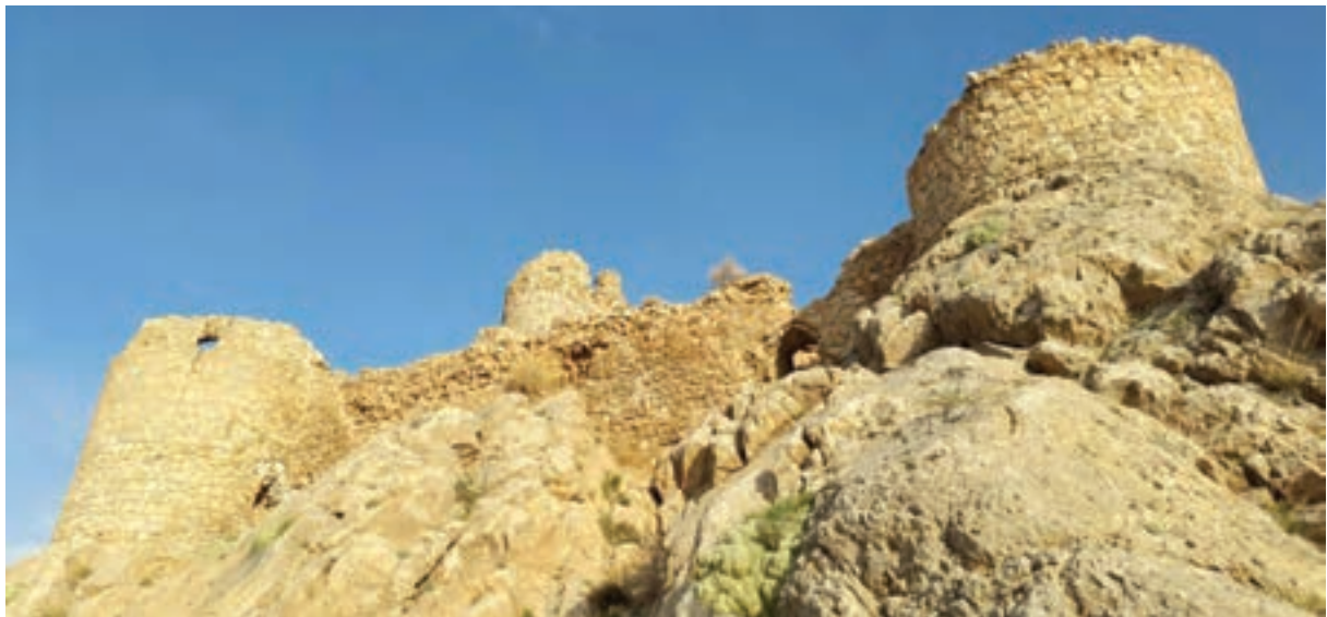
بقایای شیر قلعه شهمیرزاد - استان سمنان

در سال‌های اخیر دانش باستان‌شناسی با بهره‌گیری از ابزارها و روش‌های مدرن پیشرفت زیادی کرده است و نتایج تحقیقات آن علم، معیاری مناسب برای سنجش اعتبار اخبار تاریخی محسوب