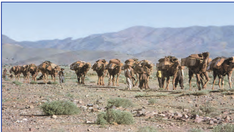
کاروان‌های تجاری در گذشته

انقلاب دریانوردی ایرانیان و مسلمانان در قرون ۱۲-۱۳ میلادی و سپس اروپاییان در قرن ۱۵، و پیدایش صنعت بخار، حمل و نقل ریلی و هوانوردی و به دنبال آن، پیشرفت دانش فنی بشر، وجود امنیت نسبی در سرزمین‌ها، راه‌های مناسب و مقررات مورد قبول بین‌المللی، موجب شد هزینه‌های تجارت نه تنها در داخل مرزها بلکه در خارج از آن نیز کاهش یابد.