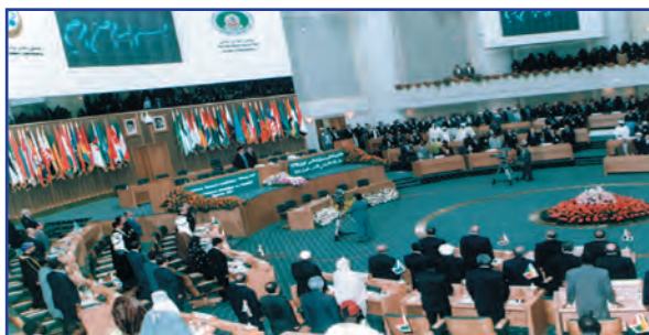
اجلاس سران کشورهای اسلامی - تهران ۱۳۷۶

بازرگانی منطقه‌ای که امروزه در بسیاری از مناطق جهان صورت می‌گیرد براساس همین قاعده است؛ برای مثال، کشورهای اروپایی با تشکیل اتحادیه اقتصادی و حتی انتخاب پول واحد، بازرگانی کل اروپا را تقریباً به صورت بازرگانی داخلی درآورده‌اند. اتحادیه ملل جنوب شرق آسیا معروف به آسه‌آن (ASEAN) ۲ با ده عضو، پس از آمریکا، ژاپن و اتحادیه اروپا چهارمین منطقه قدرتمند تجاری