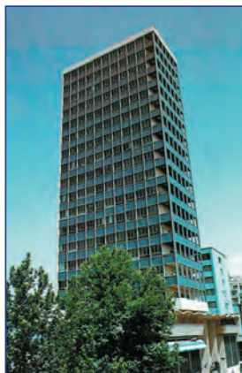
ساختمان بورس اوراق بهادار تهران

به‌طور کلی به مکانی که کار قیمت‌گذاری و خرید و فروش برخی از کالاها و اوراق بهادار در آنجا انجام می‌گیرد، «بورس» می‌گویند. در اینجا برای آشنایی بیشتر شما، بورس کالا و بورس اوراق بهادار معرفی می‌شود.