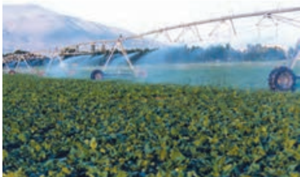
شکل ۶-۶- آبیاری بارانی قرقره‌ای

(تک‌گان): در این سیستم، از آبپاشهای بزرگ به نام «گان» استفاده می‌شود که بر روی شاسی چرخدار و یا ارابه مستقر می‌گردد و بیشتر برای آبیاری تکمیلی در اراضی دیم مورد استفاده قرار می‌گیرد (شکل ۶-۶).