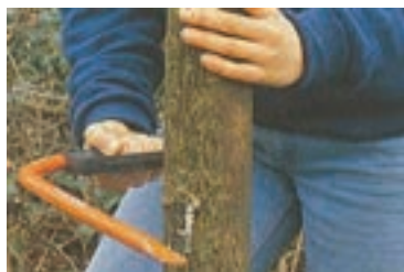
شکل ۳-۵۱ ب