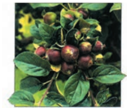
شکل ۳-۵۵ الف