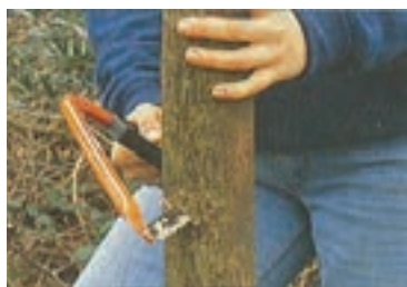
شکل ۳-۵۱ الف