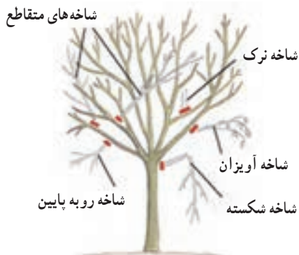
شکل ۵۲-۳- شاخه‌هایی را که با فلش مشخص شده‌اند باید در موقع هرس حذف کنید.