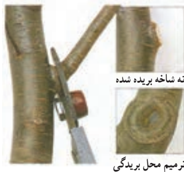
شکل ۳-۴۵ - طرز برش در شاخه نسبتاً قطور