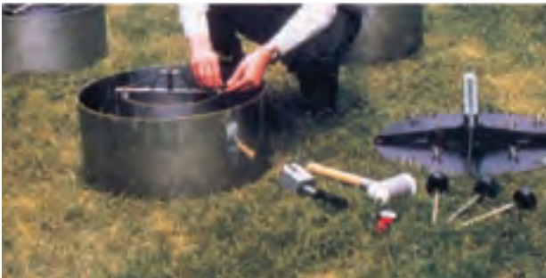
شکل ۳۰-۱ نحوه کار گذاشتن استوانه مضاعف