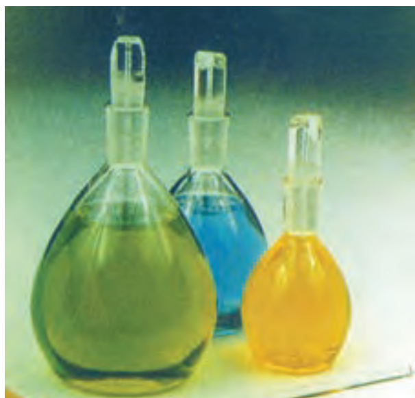
شکل ۳-۱ انواع پیکنومتر