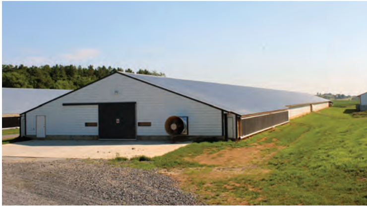
نمونه سالن در مناطق معتدل

در مناطق گرمسیری، سالن‌ها باید طوری احداث شوند که آفتاب از مسیر سقف عبور کند (شرقی- غربی).