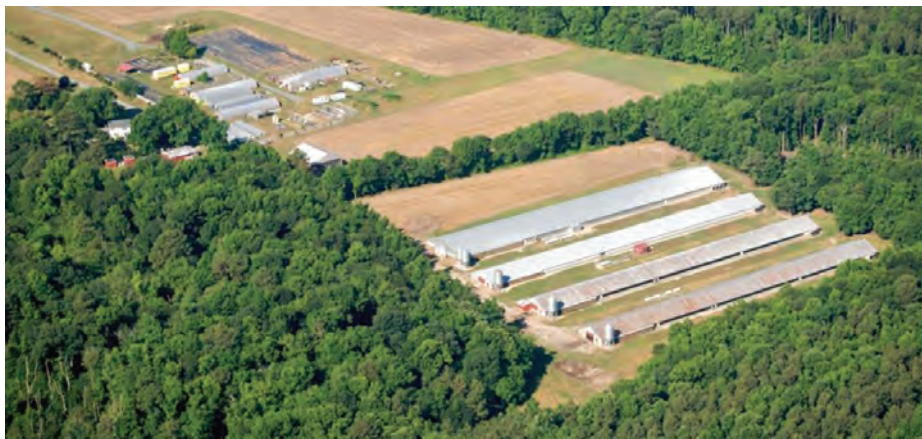
نمونه احداث بادشکن در اطراف سالن‌های مرغداری

احداث بادشکن برای اطراف سالن‌ها بسیار ضروری است. درخت کاری در اطراف سالن‌ها در صورتی که فصل مناسب است قبل از زمان شروع عملیات ساختمانی توصیه می‌شود. وجود درختان علاوه بر پاکیزگی و تعدیل هوا و نقش بادشکن، نقش مهمی در قرنطینه کردن محوطه مرغداری دارد.