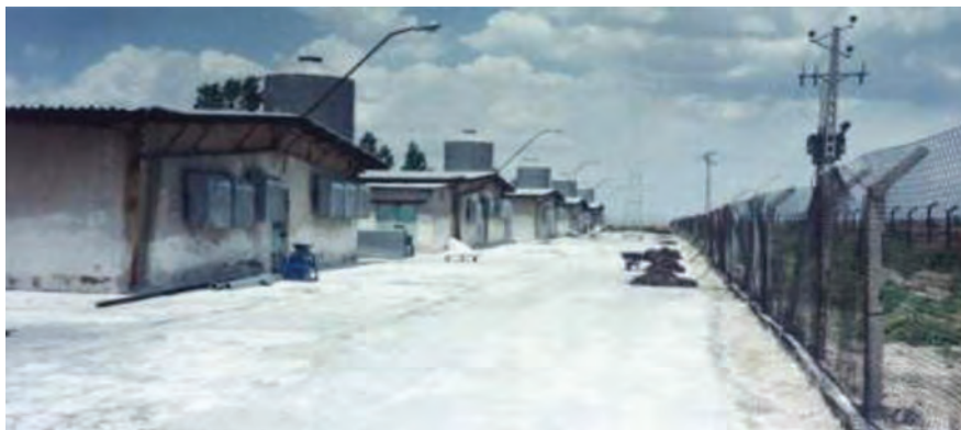
حصارکشی اطراف سالن‌های مرغداری

اقدامات لازم جهت جلوگیری از ورود حیوانات وحشی به‌عمل آید و محوطه مرغداری حصارکشی گردد (حتی‌الامکان دو ردیف حصار کشیده شود).