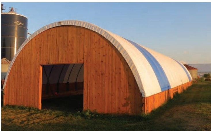
نمای بیرونی سالن‌های برزنتی (کشور فرانسه)