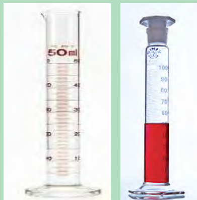
شکل ۴-۱۹- استوانه مدرج