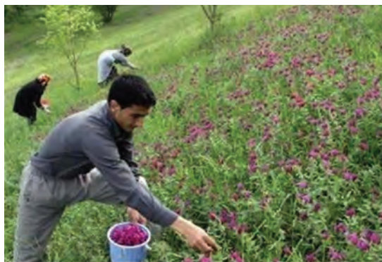
شکل ۴-۴- برداشت و انتقال گیاهان دارویی