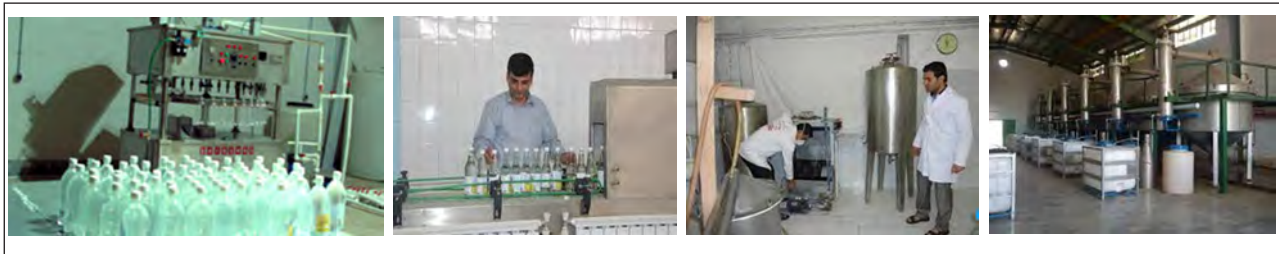
شکل ۴-۱۴- مراحل پرکردن و بسته‌بندی عرقیات

انتخاب ظرف بستگی به مدت زمان نگهداری دارد. برای نگهداری عرقیات در حجم زیاد و مدت طولانی از مخازن استیل ضد زنگ دارای همزن استفاده می‌شود؛ زیرا اسانس و عرق در طی دوره نگهداری از هم جدا می‌شوند، ولی برای نگهداری عرقیات در حجم کم از ظروف شیشه‌ای و یا ظروف پلاستیکی سفید رنگ با مواد درجه یک استفاده می‌شود.