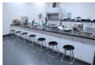
شکل ۴-۱۶- آزمایشگاه مواد غذایی

عرقیات گیاهی تولید شده باید بوی خاص و استاندارد داشته باشند، بوی سوختگی و گندیدگی ندهند و دارای ذرات معلق یا لرد نباشند. همچنین در عملیات کنترل کیفی عرقیاتی که اسانس دار هستند؛ چرب بودن آنها نشانه خالص بودن است؛ مانند خانواده نعناعیان.