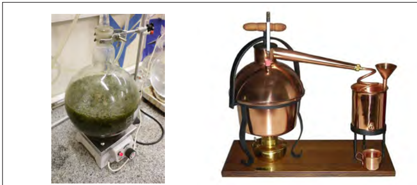
شکل ۴-۷- دستگاه تقطیر