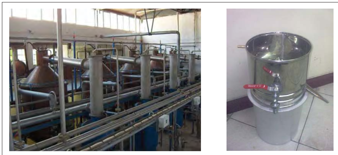
شکل ۴-۱۱ مراحل پاستوریزاسیون

معمولاً عرقیات گیاهی در بسته‌های اسپتیک بسته‌بندی می‌شوند.