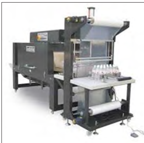
شکل ۴-۱۳- دستگاه پرکن عرقیات