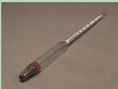
شکل ۴-۱۸- الکل سنج