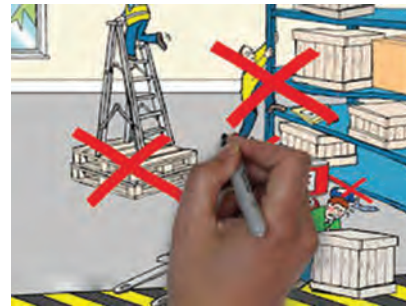
شکل ۴-۱۵- انبارداری

کیفیت به چه معناست و منظور از انجام عملیات کنترل کیفی در صنایع غذایی چیست؟