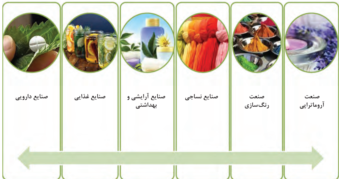
شکل ۱-۴. استفاده از گیاهان در صنایع مختلف

این بخش‌های گیاهی به صورت سنتی و فقط با خشک کردن به عنوان «کالای عطاری» عرضه می‌شوند. علاوه بر این، برخی از گیاهان دارویی به عنوان چاشنی با هدف ایجاد عطر و طعم دلپذیر به غذاها اضافه می‌شوند. به همین سبب دو اصطلاح دارویی و معطر معمولاً به صورت همراه با هم به کار می‌روند.