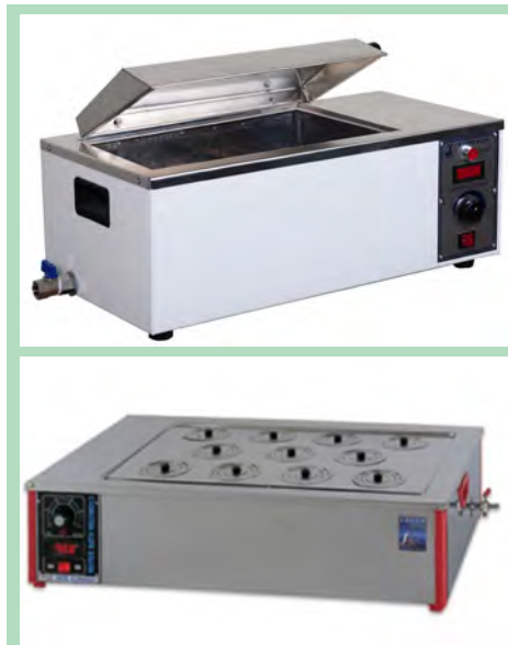
شکل ۴-۱۲- بن ماری