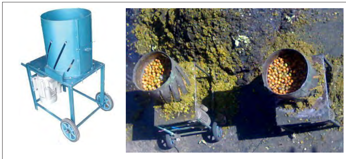
شکل ۳-۲- دستگاه پوست‌گیر گردو