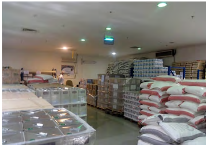
شکل ۳-۷- انبار نگهداری محصول