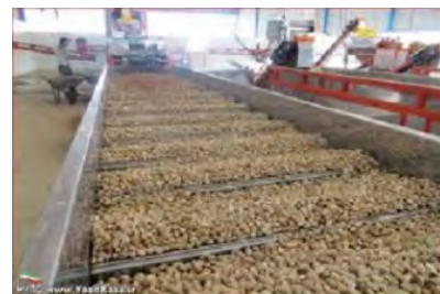
شکل ۳-۳- مراحل شست‌وشو و نم‌گیری پسته

پس از شست‌وشو، رطوبت اضافی با استفاده از دستگاه نم‌گیر کاهش می‌یابد. در این مرحله از هوای داغ با دمای حدود ۱۰۰ درجه سلسیوس به مدت ۳۰ - ۲۰ دقیقه استفاده می‌شود تا رطوبت پسته به حدود ۳۳ - ۳۰ درصد برسد.