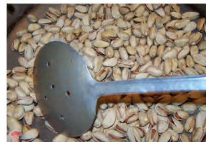
شکل ۳-۵- مراحل خشک کردن و بودادن پسته