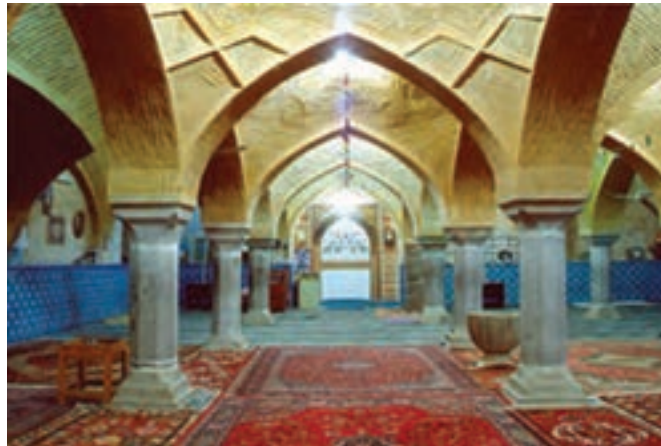
شکل ۷-۶- مسجد جامع شهرضا باقی مانده از زمان سلجوقیان

کوشش کردند. بناهای بسیاری ساخته شد که هنوز بسیاری از آنها پابرجاست. همچنین احداث چهارباغ ملکشاهی، آثار بسیار ارزشمند معماری و هنر اسلامی به ویژه در مسجد جامع اصفهان مانند گنبد نظام الملک و گنبد تاج الملک که به نظر باستان شناسان جهانی از آثار اعجاب انگیز محسوب می شوند، مسجد جامع اردستان، مسجد جامع زواره، مسجد جامع شهرضا، مسجد جامع گلپایگان نیز از جمله آثار ارزشمند معماری این دوره است.