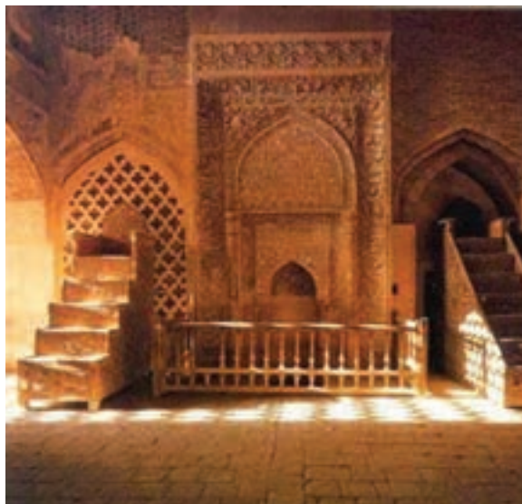
شکل ۸-۶- محراب الجایتو - جامع اصفهان

میدان عتیق (در محل فعلی میدان قیام اصفهان) نیز از میادین بزرگ عصر خود محسوب می شد که از آثار دوره سلجوقیان بود. این میدان به مرور زمان به دست فراموشی سپرده شده بود ولی به همت مسئولان شهر اصفهان در حال بازسازی است. ۳- دوره حکومت صفویه : اصفهان پایتخت دولت صفوی بود.