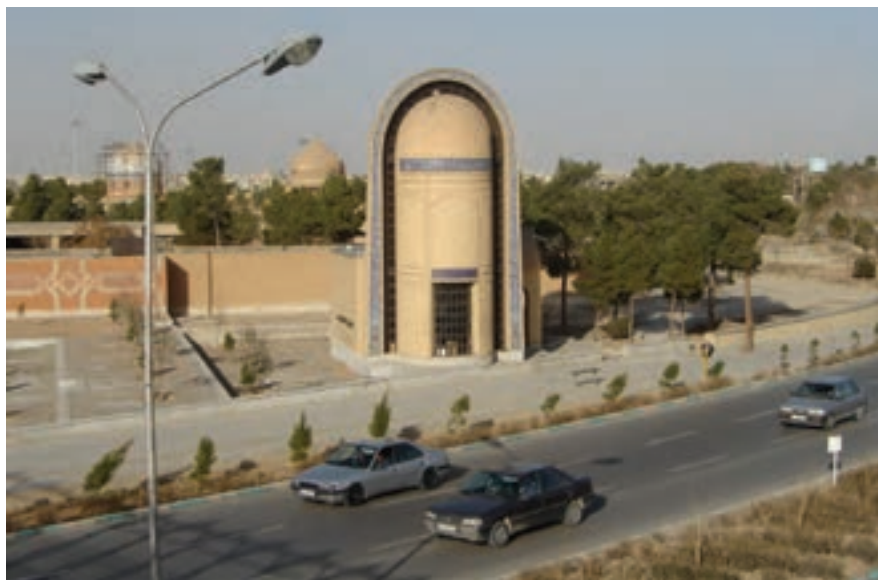
شکل ۱۴-۶- مقبره دانشمند بزرگ بانو مجتهده امین - تخت فولاد اصفهان

شخصیت‌ها و چهره‌های برجسته دوران اخیر نیز در استان ما کم نبوده‌اند. از میان آن‌ها می‌توان بزرگانی چون میرزای نائینی، سیدابوالحسن مدیسه‌ای اصفهانی، آیت‌الله سیدحسن مدرس، حاج‌آقا رحیم ارباب، سیدحسن وحید دستگردی، جلال‌الدین همایی، محیط طباطبایی زواره‌ای، پروفسور عبدالجواد فلاطوری و شهید آیت‌الله دکتر بهشتی را نام برد. علاوه بر مردان نام‌آور در تاریخ این استان بزرگ، بانوانی در صحنه علم، هنر و اخلاق در دامن این استان پرورش یافته‌اند که می‌توان به بزرگانی چون ام‌الفراسیه (اولین ایرانی مسلمان)، فاطمه جوزدانی، آمنه بیگم مجلسی، مریم بانو نائینی، هما امامزاده (اولین پزشک زن ایرانی از شهرضا)، بی‌بی‌جان کاشانی و بانو مجتهده امین اشاره کرد.