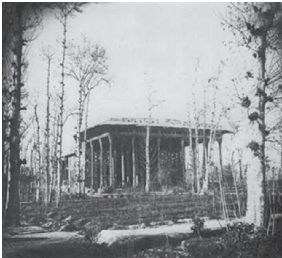
شکل ۱۲-۶- کاخ آینه‌خانه که در زمان قاجاریه از بین رفته است.