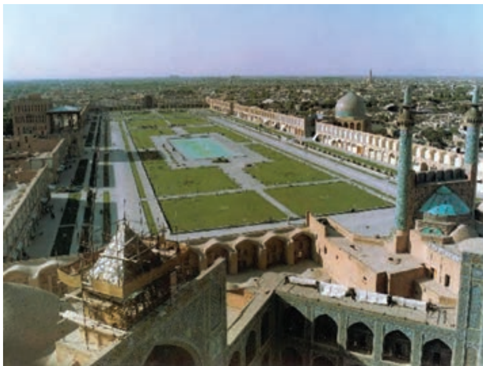
شکل ۹-۶- میدان امام (نقش جهان)

با مطالعه تاریخ صفویه درمی‌یابیم که شهر اصفهان پس از تأسیس این سلسله تا انتخاب آن به عنوان پایتخت، شهری آباد و پرجمعیت بوده است. شاه عباس اول صفوی در این اندیشه بود که پایتخت را از شمال غرب به مرکز ایران منتقل سازد تا از دشمن صفویان یعنی دولت عثمانی فاصله داشته باشد؛ از این رو، در سال ۱۰۰۰ هجری قمری، پایتخت را از قزوین به اصفهان منتقل کردند. تا سال ۱۱۳۵ هجری قمری، یعنی سال سقوط صفویه، اصفهان نه تنها در مرکز ایران بود بلکه تمام شرایط مورد نیاز برای یک پایتخت بزرگ را در خود داشت. به نظر شما، کدام شرایط برای پایتخت شدن اصفهان وجود داشت؟