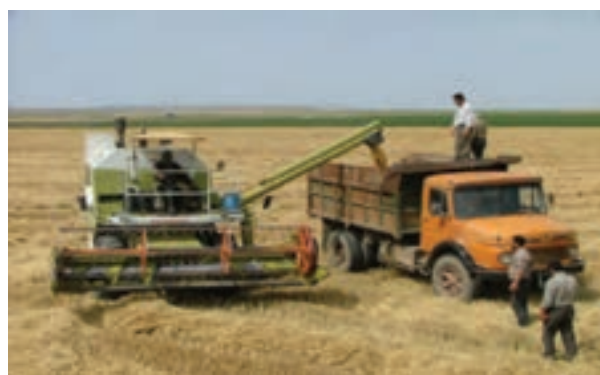
شکل ۹-۶ برداشت محصول گندم در جلگه مغان