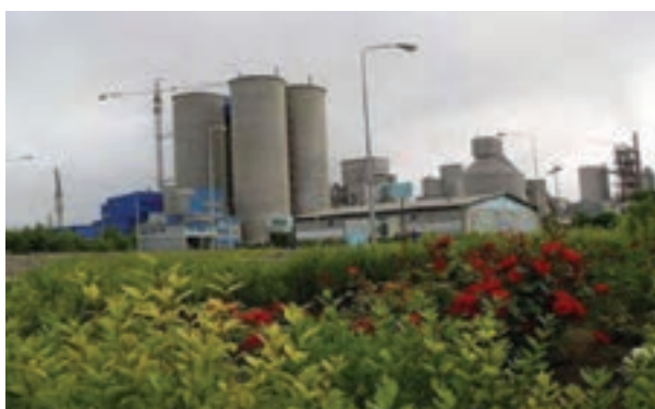
شکل ۱۰-۶ کارخانه سیمان در اردبیل

تصاویر پایین نشانگر بخشی از توانمندی های استان اردبیل در زمینه های کشاورزی و گردشگری و صنعتی و باغداری است. به نظر شما هر تصویر مربوط به کدام توانمندی های استان است؟ آیا می دانید استان اردبیل با وجود چنین توانمندی ها، با کدام موانع و محدودیت هایی در جهت توسعه مواجه است؟ این درس ضمن شرح وضعیت موجود، شما را با چشم انداز و برنامه های آتی توسعه استان آشنا می سازد.