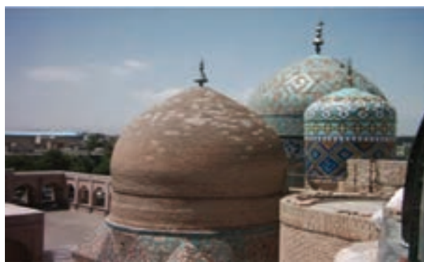
شکل ۱۱-۶ بقعه شیخ صفی در اردبیل