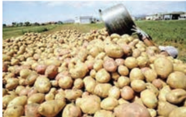
شکل ۱۳-۶- محصول سیب زمینی در دشت اردبیل