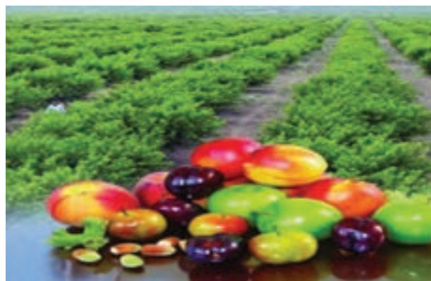
شکل ۱۴-۶- محصولات باغداری کشت و صنعت مغان

امروزه استان اردبیل با شرایط خاص جغرافیایی، تنوع محیطی، شرایط آب و هوایی، جاذبه‌های توریستی، قابلیت کشاورزی و باغداری از توان بالایی در مسیر توسعه فضایی یکپارچه برخوردار است. از طرفی همجواری با کشور جمهوری آذربایجان و ایجاد بازارچه مرزی و گمرک، ارتباط کشورمان ایران را با منطقه قفقاز و اروپا تسهیل کرده و جایگاه استان را در سطح فنی و بین‌المللی بهبود بخشیده است. با وجود قابلیت‌ها و مزیت‌های یاد شده، استان ما مسائل و مشکلاتی به شرح زیر دارد : - مرزی بودن استان و داشتن فاصله زیاد از مناطق مرکزی و توسعه یافته‌تر کشور - کوهستانی بودن استان و به تبع آن ضعف پیوند فیزیکی، اقتصادی و اجتماعی - طولانی بودن دوره سرما و یخبندان - عدم تجهیز فرودگاه‌های اردبیل و پارس آباد - نبود شبکه راه آهن