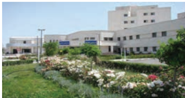
شکل ۸-۶- بیمارستان امام خمینی اردبیل