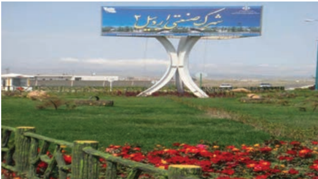
شکل ۳-۶- شهرک صنعتی اردبیل ۲

۲- شهرک صنعتی اردبیل (۲): عملیات اجرایی این شهرک از سال ۱۳۸۰ در زمینی به مساحت ۶۰۰ هکتار (امکان توسعه تا ۷۰۰ هکتار) آغاز شد. این شهرک که بزرگ‌ترین شهرک صنعتی استان است در فاصله ۱۳ کیلومتری بزرگراه اردبیل - آستارا واقع شده است همجواری این شهرک با گمرک و فرودگاه و نیز واقع شدن در مسیر بزرگراه اردبیل به تهران و نداشتن محدودیت‌های زیست محیطی برای استقرار واحدهای صنعتی مختلف از مزایا و جاذبه‌های این شهرک می‌باشد.