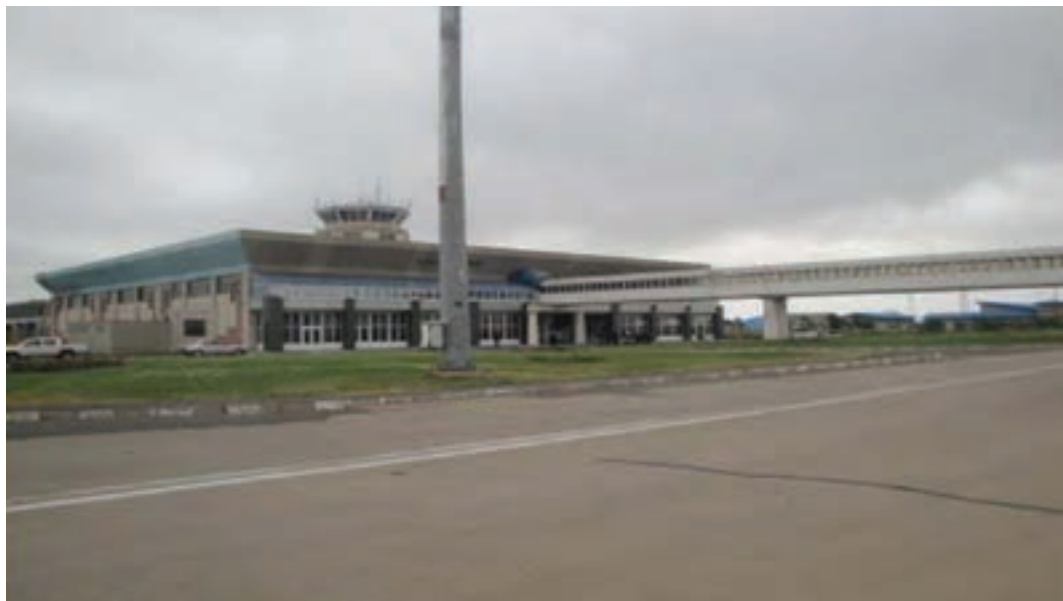
شکل ۴-۶- فرودگاه اردبیل