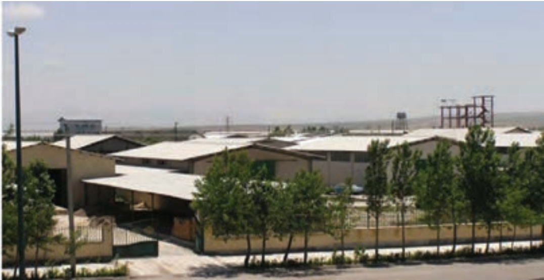
شکل ۲-۶- شهرک صنعتی اردبیل ۱

۲- شهرک صنعتی اردبیل (۲): عملیات اجرایی این شهرک از سال ۱۳۸۰ در زمینی به مساحت ۶۰۰ هکتار (امکان توسعه تا ۷۰۰ هکتار) آغاز شد. این شهرک که بزرگ‌ترین شهرک صنعتی استان است در فاصله ۱۳ کیلومتری بزرگراه اردبیل - آستارا واقع شده است همجواری این شهرک با گمرک و فرودگاه و نیز واقع شدن در مسیر بزرگراه اردبیل به تهران و نداشتن محدودیت‌های زیست محیطی برای استقرار واحدهای صنعتی مختلف از مزایا و جاذبه‌های این شهرک می‌باشد.