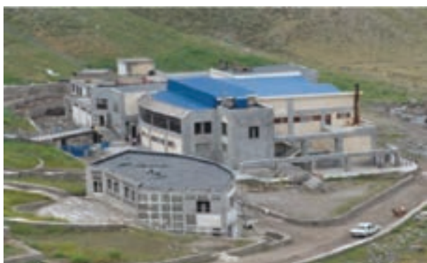
شکل ۱۲-۶ آبگرم قینرجه در مشکین شهر