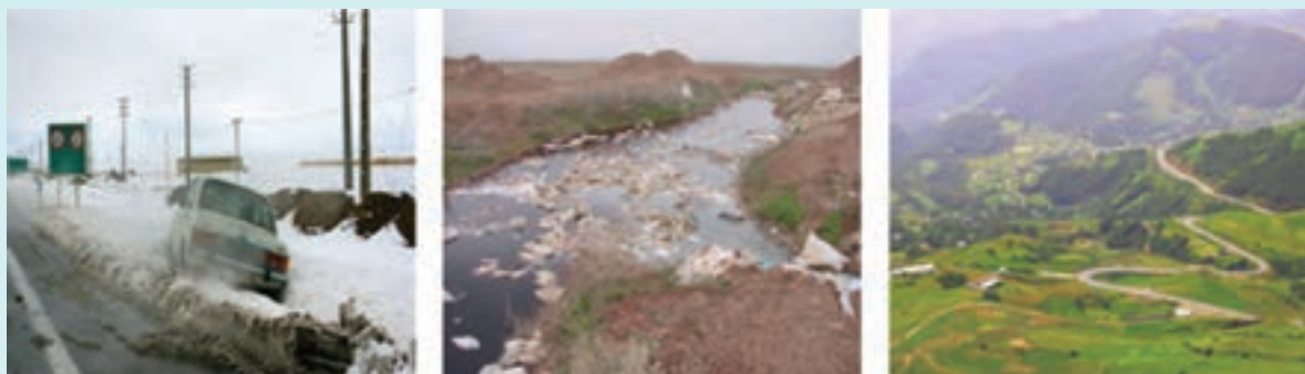
شکل ۶-۱۵ – نمونه‌هایی از محدودیت‌ها و مشکلات توسعه در استان

در شکل ۶-۱۵ نمونه‌هایی از مشکلات و محدودیت‌های استان به تصویر کشیده شده است. هر تصویر کدام یک از مشکلات و محدودیت‌های استان را نشان می‌دهد؟ راهکارهای خود را برای حل این مشکلات بیان کنید.