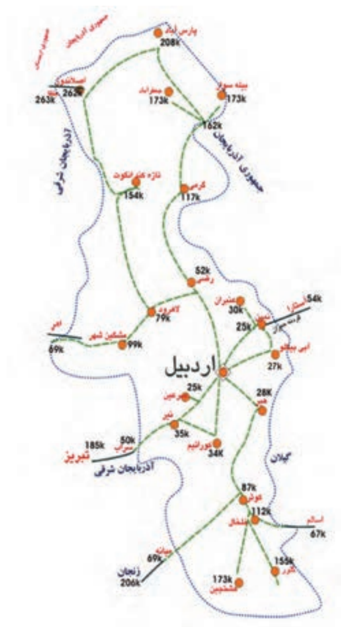
شکل ۱۶-۶- نقشه راه‌های استان اردبیل