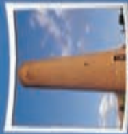
۲- منار آجری