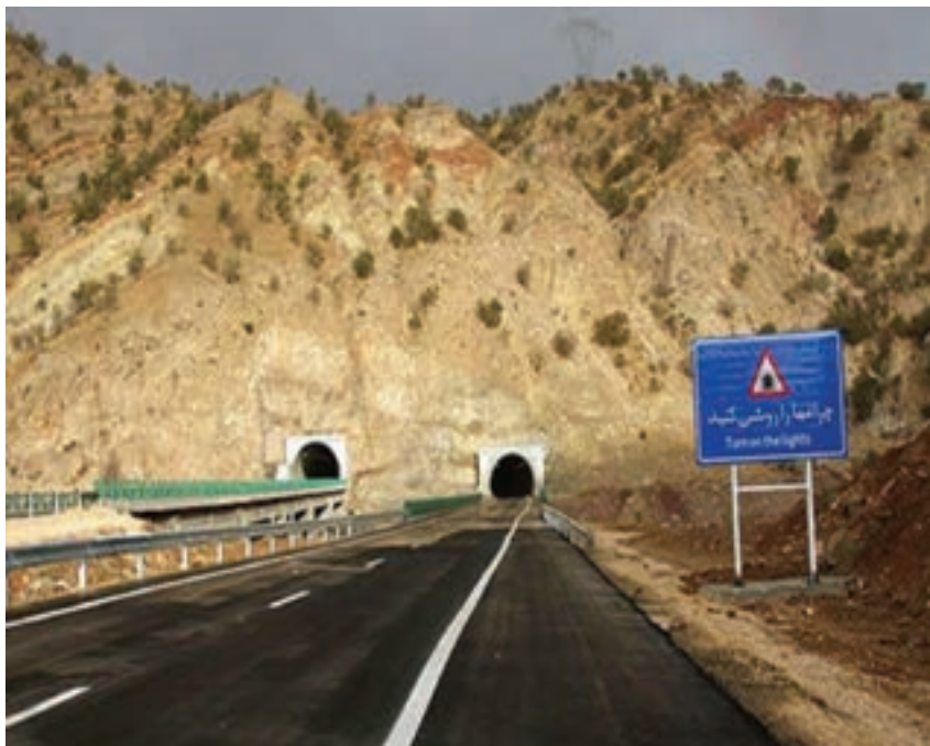
شکل ۱۲-۱۴- آزادراه خرم‌آباد - پل زال