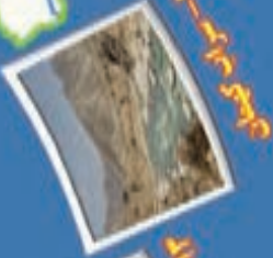
۱۵- دریاچه کور