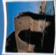
۴- بل دختر