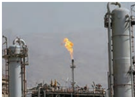
شکل ۲۰-۱۴ - نمایی از صنایع استان