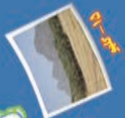
۱۴- کویری بخت