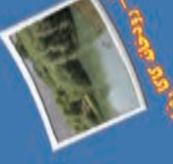
۱۶- آبشار نوزبان