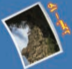
۱۳- آبشار بخت