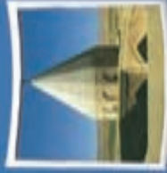
۳- امام زاده قاسم