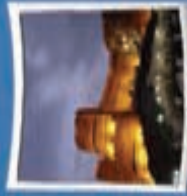
۵- فلک الاقلامی