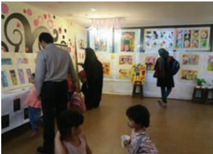
شکل ۳- بازدید کودک و والدین از نمایشگاه فعالیت‌های کودکان