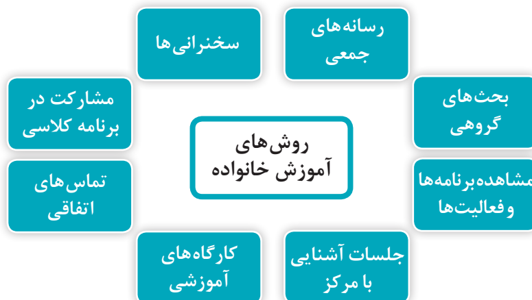
نمودار ۳- روش‌های آموزش خانواده در مراکز پیش از دبستان

برنامه آموزش والدین روش‌های متنوعی را شامل می‌شود که والدین از طریق آن، می‌توانند یاد بگیرند. بعضی از این فعالیت‌ها، برنامه‌ریزی شده هستند و بعضی به‌طور خودجوش رخ می‌دهند. در یک برنامه مؤثر ممکن است از روش‌های زیر استفاده شود (نمودار ۳):