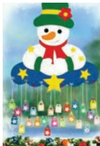
شکل ۵- نمونه طرح‌های حضور و غیاب کودکان در مهد