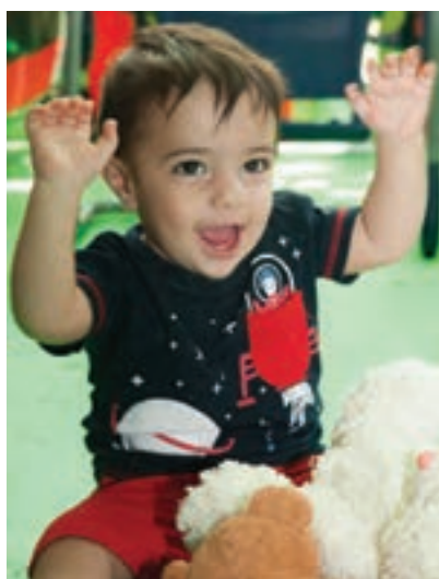
شکل ۶- کودک شاد

۵ حضور به موقع والدین برای بردن کودک به خانه: والدین برای برگرداندن کودک به خانه باید سر وقت در مهد کودک حضور داشته باشند و نگذارند او بیش از اندازه منتظر بماند. باید زمان برگشت را طوری تعیین کنند که کودک متوجه شود، زیرا کودکان ساعت را نمی‌شناسند و درک درستی از زمان ندارند. مثلاً به او بگویند بعد از خوردن ناهار یا تمام شدن کارشان به دنبالش او می‌آیند.