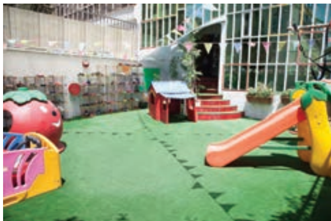
شکل ۲- جذابیت در مرکز پیش از دبستان

۴ می‌توانید نمایشگاهی از نمونه فعالیت‌هایی که کودکان در سال‌های قبل در مرکز انجام داده‌اند، برگزار کنید (شکل ۳).