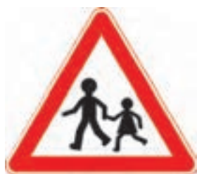
شکل ۸- تابلوی عبور اطفال

در مراکز پیش از دبستان، ایجاد یک محیط ایمن باید اولویت اصلی باشد. مربیان باید دانش کافی در مورد نحوه ایجاد یک محیط ایمن داشته باشند و نسبت به خطرات بالقوه در این محیط هشیار باشند و نحوه پیشگیری از آسیب به کودکان را بدانند. مراکز پیش از دبستان به منظور پیشگیری از حوادث احتمالی ورود و خروج کودکان لازم است برنامه منظمی تدوین کنند این برنامه می‌تواند شامل موارد زیر باشد، اما محدود به این موارد نیست: