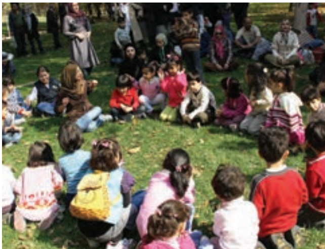
شکل ۳- ارتباط مربی با والدین

بخشی از ارتباطات بین مرکز پیش از دبستان با والدین به‌صورت رسمی انجام می‌گیرد. برای نمونه، کلیه جلساتی که در مورد رعایت نکات بهداشتی و ایمنی، تغذیه کودکان، جابه‌جایی کودکان به منظور گردش‌های علمی - تفریحی، بیماری کودکان و مواردی مانند اینها برگزار می‌شود، شکل‌هایی از ارتباطات رسمی بین مرکز پیش از دبستان با والدین محسوب می‌شود (شکل ۳).