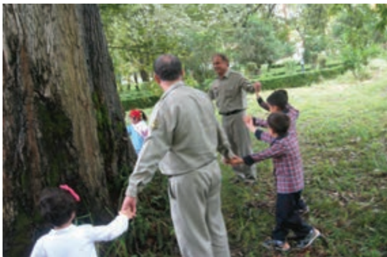
شکل ۵- همکاری در حفظ محیط زیست

۶ همکاری در حفظ محیط زیست: در برنامه‌هایی که مربی برای کودکان با هدف حفظ و احترام به محیط زیست تدارک می‌بیند، والدین می‌توانند به طور مستقیم (حافظ محیط زیست) یا غیر مستقیم مشارکت داشته باشند (شکل ۵).