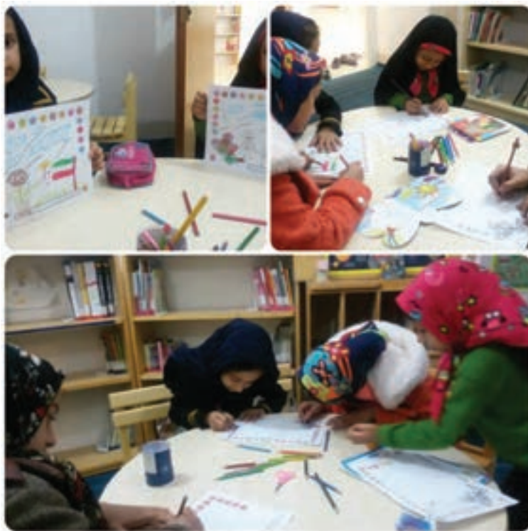
ادامه شکل ۴- فعالیت‌های روز نخستین