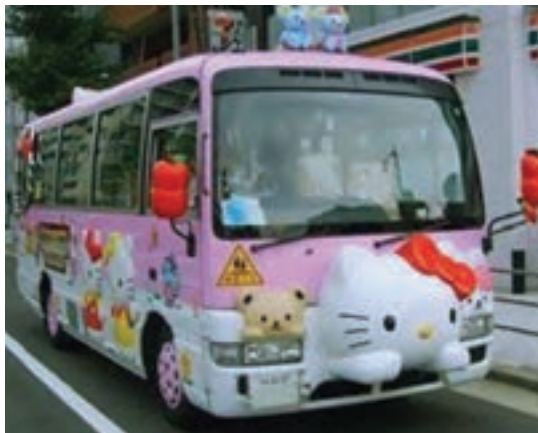
شکل ۱۱- سرویس نقلیه ایمن

■ در پرونده کودکان در مراکز پیش از دبستان، فرم اجازه کتبی والدین برای استفاده کودک از سرویس یا بردن کودکان به گردش علمی، به صورت امضاء شده نگهداری شود. در هر گردش علمی یا استفاده از سرویس حمل و نقل، کپی‌هایی از این فرم و شماره تلفن‌های اضطراری باید با کودکان همراه باشد.