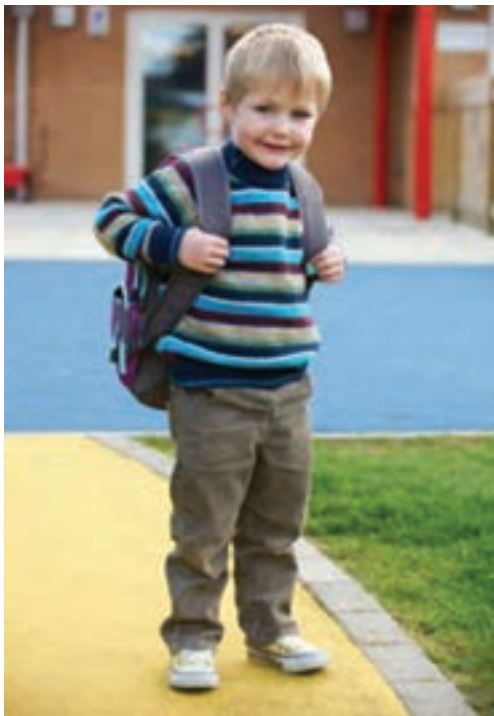
شکل ۹- کودک آماده خروج از مرکز

خروج کودکان از مرکز پیش از دبستان مانند هر مرکز آموزشی دیگر تابع مقررات و شرایطی است و کودک نمی‌تواند هر زمان که اراده کند، از مرکز خارج شود. (شکل ۹).