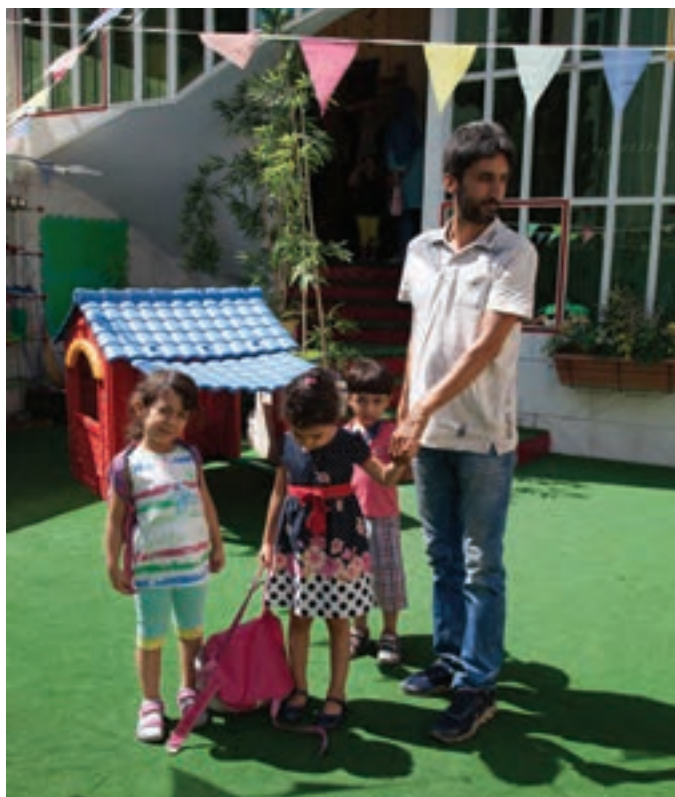
شکل ۱۰- تحویل کودک به والدینش به هنگام خروج

به منظور اطمینان از خروج تمام کودکان از مرکز، نقاط مختلف مرکز پیش از دبستان را کنترل کنید.