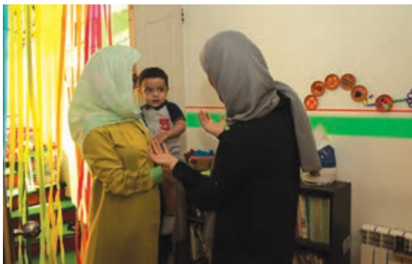
شکل ۱- استقبال مربی از کودک به هنگام ورود