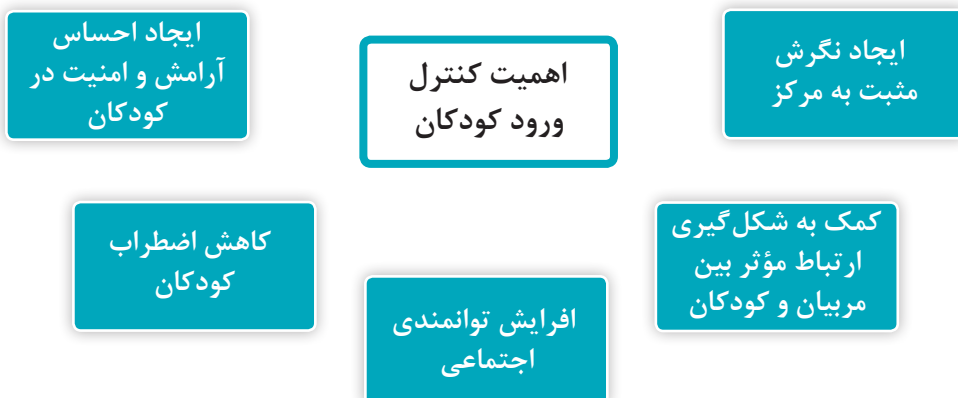
نمودار ۲- اهمیت ساماندهی ورود کودکان به مرکز پیش از دبستان

مدیریت مناسب ورود کودکان به مرکز پیش از دبستان به ایجاد نگرش مثبت والدین و آرامش آنها منجر می‌شود.