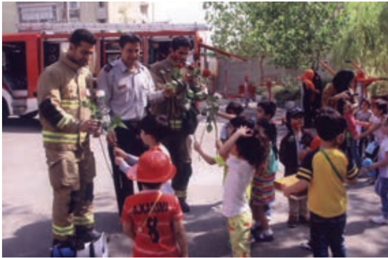
شکل ۴- مشارکت والدین در معرفی مشاغل

۴ مشارکت در برنامه‌ریزی آموزشی: در برخی از برنامه‌ها، می‌توان از مطالب پیشنهادی والدین نیز استفاده کرد. با تشکیل کمیته‌های آموزشی از والدین علاقه‌مند دعوت کنید تا در طول سال این کمیته‌ها تشکیل شود و در مورد آموزش کودکان و مربیان و پیشرفت دادن برنامه گفت‌وگو و تبادل نظر گردد.