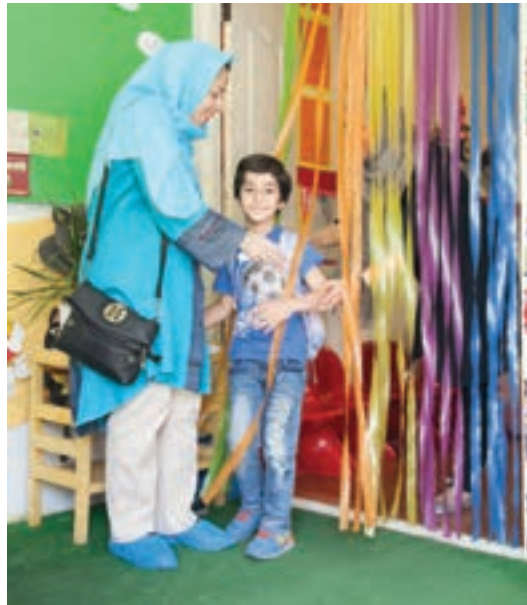
شکل ۷- خروج کودک از مرکز پیش از دبستان

فعالیت ۱۱: در گروه‌های کلاسی با توجه به شکل بالا، درمورد ضرورت کنترل خروج کودک از مراکز پیش از دبستان گفت‌وگو کنید و نتیجه را در کلاس ارائه دهید.