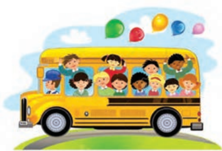
شکل ۱۲- سرویس ناایمن

فعالیت ۲۴: در گروه‌های کلاسی با توجه به شکل بالا، در مورد مشکلات سرویس هنرستان زمانی که در مسیر خراب می‌شود، گفت‌وگو کنید و نتیجه را در کلاس ارائه دهید.