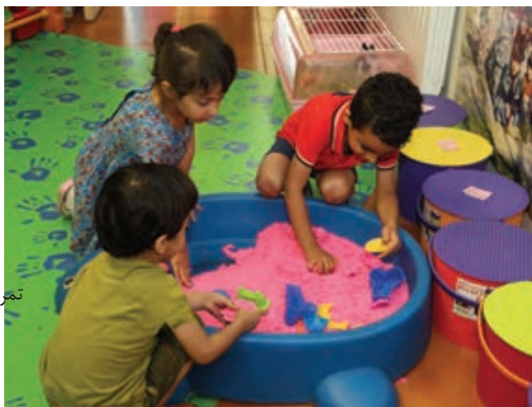
شکل ۴- فعالیت‌های روز نخستین