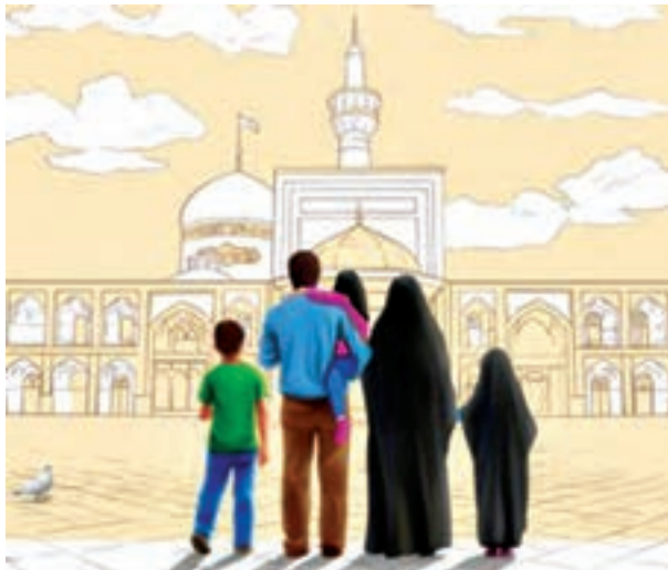
شکل ۱- خانواده

«یکی از نشانه‌های قدرت خداوند این است که برای شما از جنس خودتان همسری آفرید تا وسیله آرامش شما باشد و در میان شما دوستی و رحمت قرار داده است.» ۱ به تصویر زیر با دقت نگاه کنید.