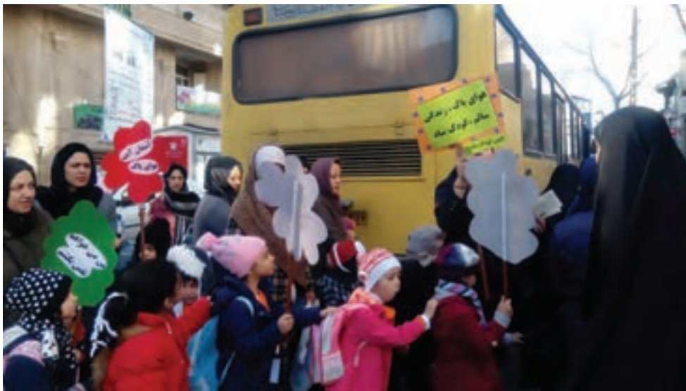
شکل ۳- ارتباط و مشارکت مربیان با همکاران

۳ ترتیب دادن اردوهای علمی، تفریحی و زیارتی با مشارکت همکاران: برگزاری اردوهای علمی، تفریحی، و زیارتی برای کودکان و مربیان و سایر کارکنان مرکز پیش از دبستان، به برقراری ارتباط صمیمی بین افراد منجر می‌شود و در نتیجه ارتباط و مشارکت نیز افزایش می‌یابد (شکل ۳).