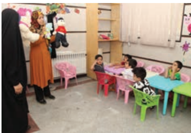
شکل ۴- نظارت مربی در مراکز پیش از دبستان

مربی‌یاران برای اجرای برنامه‌های کودکان باید یک محیط ایمن و بهداشتی متناسب با سن آنها فراهم کنند.