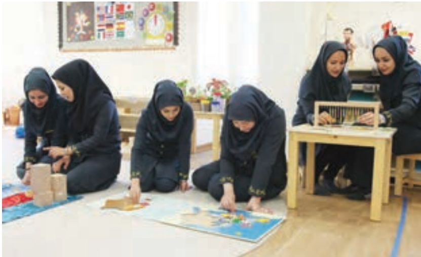
شکل ۱- مشارکت همکاران در مرکز پیش از دبستان

مراکز پیش از دبستان برای بقا، نیازمند ارتباط و مشارکت هستند. هرگاه بخواهند در دنیای پیچیده و پویای امروزی ادامه حیات دهند، باید نیروی بالقوه مشارکت کارکنان خود را پرورش دهند و از آن استفاده کنند. در صورت مشارکت و همکاری، کارکنان یک مرکز با علاقه‌مندی و تعهد بهترین فعالیت‌ها و ابتکارات را از خود نشان می‌دهند (شکل ۱).